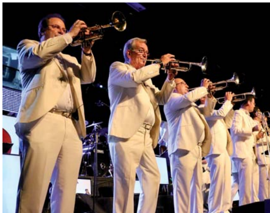
El concert de l'orquestra Maravella va omplir el Teatre Municipal en les dues sessions