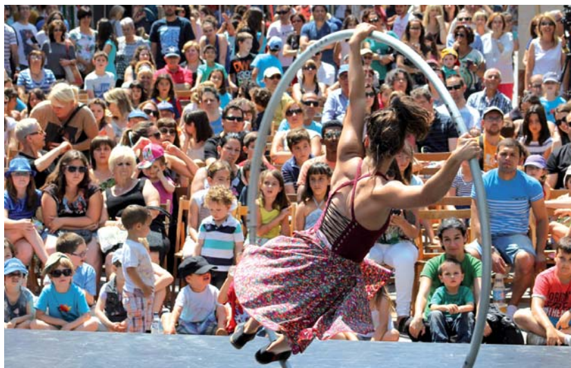
L'espectacle de circ 'Violeta', de la companyia La Persiana, va comptar amb la música en directe de Venancio i los Jóvenes de Antaño