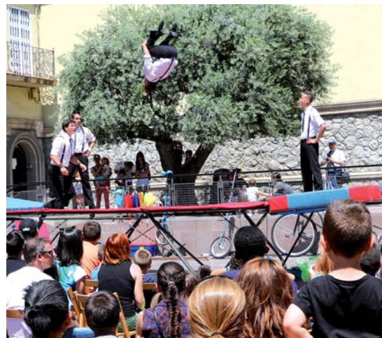
La companyia Circ Los va representar l'espectacle Xarivari Blues, amb salts espectaculars