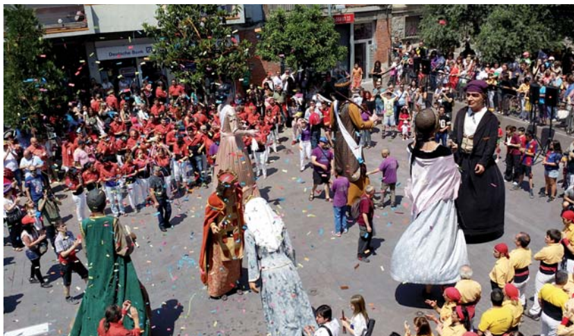
La cercavila gegantera va cloure a la plaça de l'Església, escenari de l'actuació de les colles de Sabadell, Badalona i Montcada i Reixac