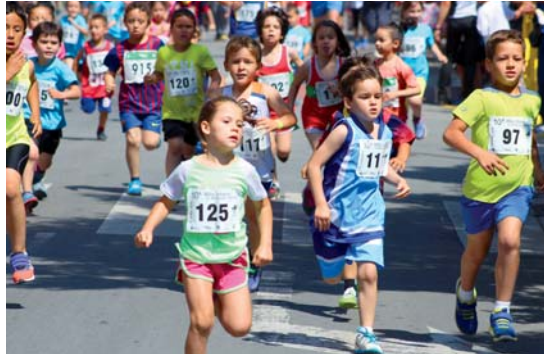
La cursa atlètica amb els més petits és una de les més populars i vistoses de la Milla Urbana

L'atletisme va ser el plat fort del programa esportiu de la Festa Major 2015 que també va comptar amb una jornada de tir al plat, un torneig d'escacs i un 3x3 de bàsquet | RJ