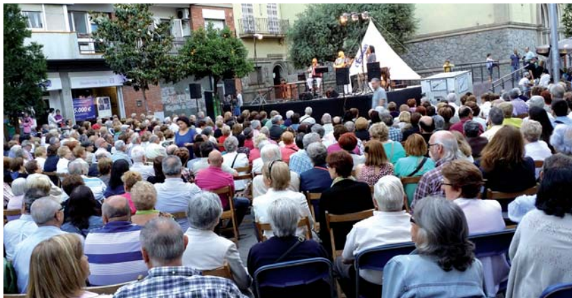
A la plaça de l'Església, no hi cabia ni un agulla durant el concert d'havaneres del grup L'Espingari, amb posterior tast de rom cremat