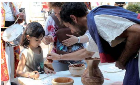
El Museu va oferir tallers sobre el món ibèr en el marc del carrer dels oficis de diumenge

Totes les fotos i els vídeos a l'aveu.cat