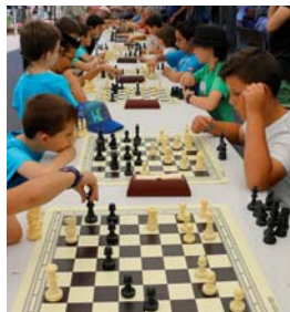
Els escacs, protagonistes al carrer Major