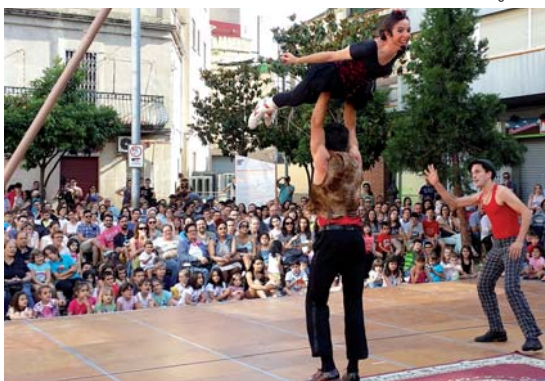
La companyia Tandarica va parodiar els números de circ amb un divertit espectacle