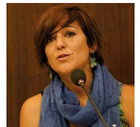
Campos és regidora des del 2008

Eixos. “La transparència i la participació seran els eixos del nou govern” , va dir la nova alcaldessa tot afegint que les urnes han demostrat que Montcada ha volgut un canvi en les formes de treballar i la manera de fer. Per simbolitzar quin serà el ta-