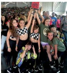
El grup Essencial Kid's, amb el nou títol

El grup de competició infantil de l'escola Cirqs Dance Studio, Essencial Kid's, va guanyar el festival Vic Dance Contest, celebrat el 7 de juny al pavelló del Castell d'en Planes. El conjunt va quedar primer entre una vintena de participants en la categoria infantil. Amb aquest títol, tanca una excel·lent temporada repleta de premis, quedant subcampionat al torneig de hip hop Vila de Moia, al festival Urban Display de Cornellà i al torneig Idance de Granollers | LG