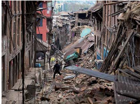
Una part dels diners de l'Ajuntament es destinaran a ajudar els damnificats del terratrèmol al Nepal

Ajudes a Gaza i el Sàhara. Un altre projecte al qual Montcada destina diners és per donar suport a la població del campament de refugiats sahrauís de Tindouf (Algèria), que al setembre del 2014 es va veure afectada per fortes pluges