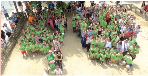
AMPA FONT FREDA

El centre va celebrar l'efemèride el 14 de juny en el marc de la festa ludicoesportiva que organitza l'Ampa