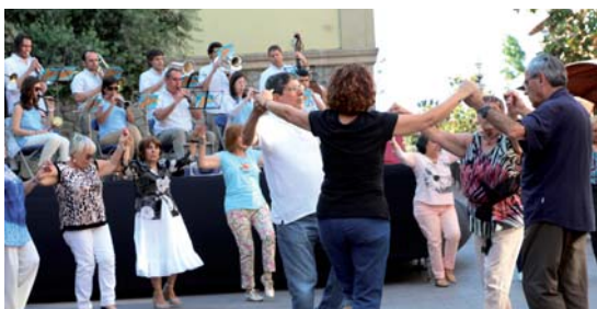
Ballada de sardanes amb la cobla Reus Jove, a la plaça de l'Església el diumenge a la tarda