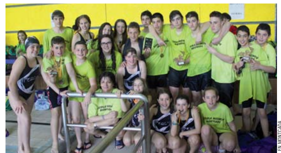
Representació de l'Escola de Natació Montcada a la final nacional dels Jocs Escolars de Catalunya