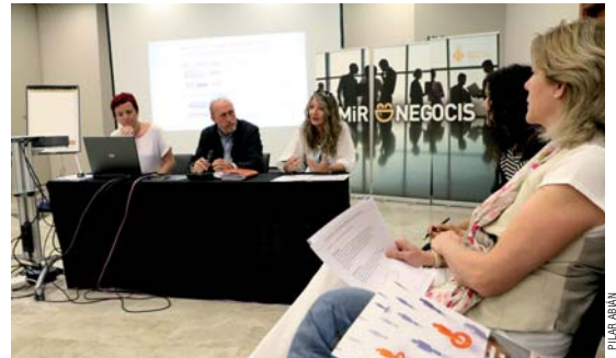
El 17 de juny es van presentar les receptes empresarials per millorar la comunicació en línia

El Departament de Promoció Econòmica, Empresa i Ocupació va presentar el 17 de juny a l'Hotel Ciutat de Montcada el resultat de la primera edició del projecte Singular, subvencionat per la Diputació de Barcelona i destinat a millorar la competitivitat de les empreses. La primera actuació, que ha comptat amb la participació de 6 pimes, ha consistit a fer 10 vídeos amb receptes destinades a explicar com millorar la comunicació en línia i la gestió a través de les eines que ofereix la xarxa. Representants de la firma Activa Prospect s'han encarregat de visitar les empreses participants per detectar les seves necessitats i assessorar-les en com aprofitar les noves tecnologies per potenciar la comunicació i la comercialització online. Cadascuna de les millores introduïdes s'ha plasmat en els vídeos que ha fet Montcada Comunicació i que es poden veure al seu canal