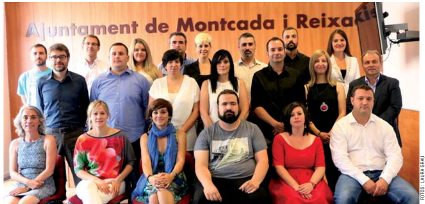
Els 21 regidors del nou mandat es van fotografiar plegats a la sala institucional de la Casa de la Vila en acabar la sessió d'investidura