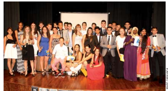
Els alumnes de 4t d'ESO de l'INS La Ferreria, a la gala dels Òscars feta a l'Auditori el 5 de juny

També fan pòsters publicitaris i anuncis a la ràdio del centre, a més d'aplicacions per descarregar-les gratuïtament al mòbil. La cloenda del projecte es fa en