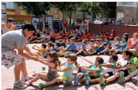
Les olimpíades populars, estrenades l'any passat, van tenir molt bona resposta de públic