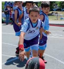
3x3 de bàsquet davant del pavelló M. Poblet