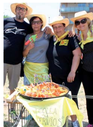
Concurs d'arròs de l'AV de Montcada Nova-Pla d'en Coll