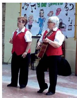
CASAL DE LA MINA

Més de 200 alumnes de 4t d'ESO d'instituts i col·legis del municipi van participar el 3 de juny a l'activitat educativa 'Canvi de marxa', impulsada per la fundació privada sense ànim de lucre Mutua de Conductors amb el suport del Servei Català de Trànsit i la col·laboració de l'Ajuntament i la Policia Local. L'objectiu és conscienciar els joves d'entre 14 i 18 anys sobre les causes i conseqüències dels accidents de trànsit. L'activitat, que va tenir lloc al Teatre Municipal, també volia fomentar conductes responsables i d'autoprotecció en aquesta edat. L'activitat forma part del programa d'Educació Viària que organitza anualment el consistori | SA