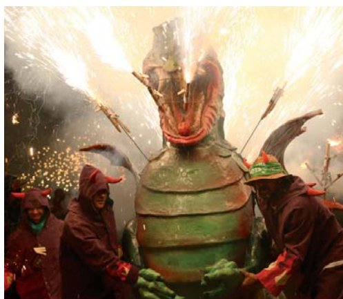
Una de les bèsties que va participar al correfoec de la colla de Diables de Can Sant Joan