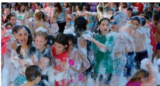
Multitudinària festa de l'escuma a la plaça de l'Església per combatre la intensa calor