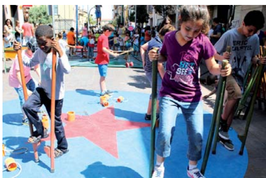
El carrer del circ va permetre als infants convertir-se en saltimbanquis durant unes hores