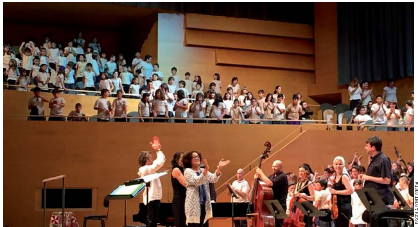
Alumnes de l'escola Font Freda, durant la seva actuació al concert de la Cantània celebrat a l'Auditori de Barcelona