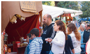
La Fira Medieval va ser una de les activitats que es van fer durant la Festa Major de 2013