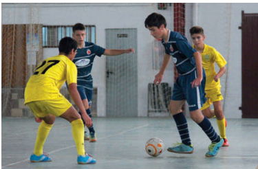
L'equip del cadet A va millorant partit a partit amb ganes de sumar els primers triomfs