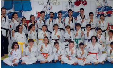
Tots els membres del Lee Young que van participar al Campionat de Catalunya del 18 d'octubre