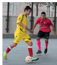
L'EF Montcada, de groc, va ser molt superior