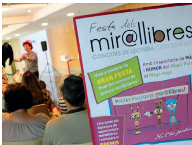
La primera edició del concurs Mir@llibres va comptar amb una seixantena de participants

Inscripcions. Els infants que vulguin participar ja es poden apuntar durant el mes de novembre a qualsevol de les dues biblioteques. El mes de juny se celebrarà la Festa del Mir@llibres, amb un sorteig de premis entre els participants i algunes sorpreses. A la passada edició, el certamen va comptar amb la participació d'una seixantena d'infants.