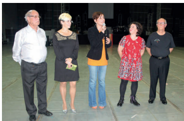
Les autoritats municipals, amb els representants de les dues associacions de gent gran del municipi