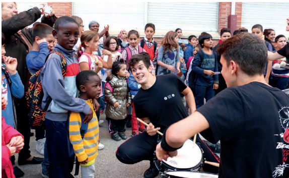
El grup Brincadeira va fer una actuació el 28 d'octubre a l'escola El Viver per presentar el taller de batucada adreçat a les famílies en el marc del PEE

El nou mapa de matriculació i el Pla d'Educatiu d'Entorn són dues de les prioritats