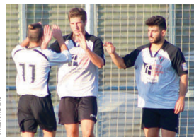
El bon inici de l'UD Santa Maria s'ha vist afectat per aquesta sanció