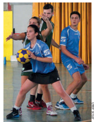
El júnior del Miró, en l'últim partit a casa

Després d'un any de transició, l'AE Montserrat Miró júnior ha aconseguit les dues primeres victòries a Tercera Divisió contra el PCK B (29-18) i el KC Barcelona C (15-13). El tècnic, Pedro López, assegura que l'equip ha començat bé, "guanyant contra rivals que l'any passat ens superaven amb comoditat". El júnior destaca, segons el seu entrenador, per un joc més fluït i dinàmic. "Portem una molt bona línia i seguim treballant per poder mantenir-la" | JA