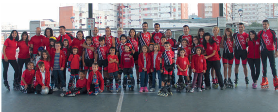
Alguns dels integrants del Rolier Can Cuiàs es van fer una fotografia de família i van oferir una exhibició durant l'acte de presentació

Per a aquesta temporada, l'AE Can Cuiàs compta amb un total de set equips de futbol sala: dos senyors masculins, un femení, un benjamí, un infantil, així com un aleví i un pre-benjamí escolar que s'han format gràcies a un acord de col·laboració establert amb l'escola del barri Ginesta.