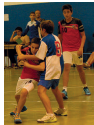
Imatge del partit contra el Sabadell Handbol

Els tècnics treballen en un projecte a llarg termini