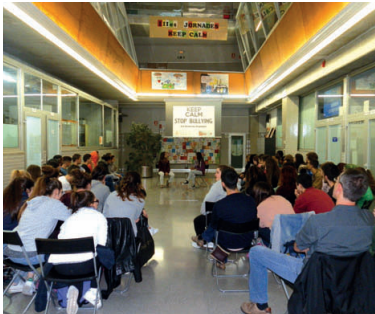
El·ls alumnes de l'INS La Ferreria han fet entre el 19 i el 21 d'octubre les III Jornades Keep Calm