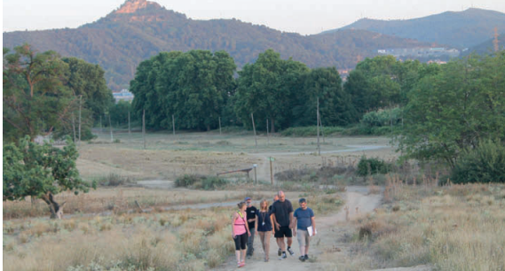
Representants del govern municipal van visitar aquest estiu el sector de Mas Duran on s'ha celebrat el Rocío des del 2003

El consistori argumenta que la celebració és incompatible amb la cura de l'espai natural