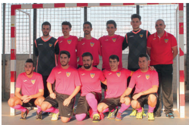
L'equip senyor B de futbol sala va debutar el 25 d'octubre a Tercera Catalana amb una derrota

Més esports. El futbol sala, però, no és l'única aposta esportiva que realitza aquest club que es va fundar el 1993. En la presentació també van tenir la seva quota de protagonisme les seves altres seccions com el patinatge en línia, roller, que en les