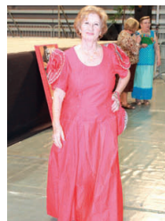
Els vestits de paper van despertar molts elogis