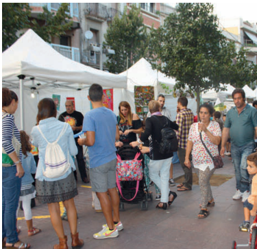
Unes 18.000 persones, segons els organitzadors, es van acostar l'any passat a la Fira de l'Aigua

Activitats. A més de l'oferta comercial, repartida en 40 carpes, els organitzadors han previst tot un seguit d'actes d'animació dirigits als més petits, destacant les tradicionals passejades amb ruc, els inflables, els tallers de manualitats, manicura infantil, servei de ludoteca i taller de pa. Dissabte al matí, es farà la festa de l'aigua i a la tarda, es podran veure a l'escenari de la plaça de l'Església, de 18 a 20h, les actuacions de l'escola