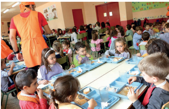
Alumnes de l'escola Elvira Cuyás, situada al barri de Mas Rampinyo, durant l'hora de dinar al menjador del centre

L'Ajuntament crearà una partida extraordinària de 50.000 euros en el pressupost d'aquest any i el vinent per fer-se càrrec de 85 beques de menjador del tram variable que compleixen els criteris de renda per poder beneficiar-se però encara no s'han pogut adjudicar a falta de la consignació pressupostària per part del Departament d'Ensenyament de la Generalitat, que té delegada la competència al Consell Comarcal del Vallès Occidental, que també farà una aportació de 100.000 euros per complementar aquests ajuts. L'ens gestiona la distribució de les beques segons els criteris d'Ensenyament i cada any rep una aportació econòmica per a aquest concepte.