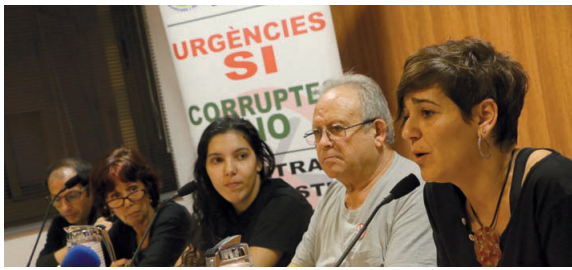
A l'assemblea feta el 22 d'octubre, l'alcaldeessa va explicar personalment les dades facilitades per l'ICS i CatSalut sobre el cost de les urgències

Esculls. A banda de l'elevat cost que, segons la Generalitat, implica el servei, en el cas que l'assumís el consistori ho hauria de fer amb un equip privat de metges que no podria retribuir gratuïtament ni accedir a la base