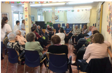
La jornada de portes obertes al Centre de Dia de Montcada va tenir una bona acollida