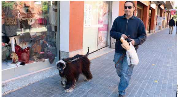
Actualment censar un gos, un gat o una fura a l'Ajuntament té un cost de 20,60 euros, tarifa que desapareixerà cara al proper exercici

Cara al 2016 el govern també proposa modificar els tipus per tal de rebaxar la quota d'Ibi de magatzems i d'estacionaments amb valor cadastral superior als 20.000 euros. D'altra banda, s'introdueixen un seguit de modificacions respecte les bonificacions. Fins ara, els pensionistes només tenien una reducció de l'impost si vivien sols o en parella i ara se'n podran seguir beneficiant encara que visquin amb ells més membres de la seva família, fent un escalat respecte la renda de la unitat familiar. Així mateix el màxim de renda que han d'ingressar les famílies monoparental per rebre la bonificació sobre l'Ibi