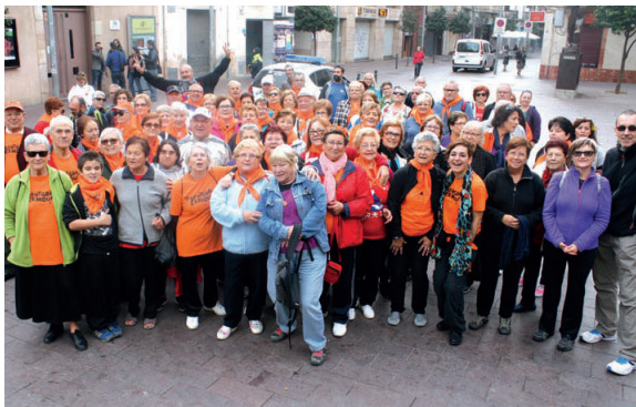
Un centenar de persones va participar a la caminada que es va fer el 25 d'octubre per Mas Duran amb sortida a la plaça de l'Església