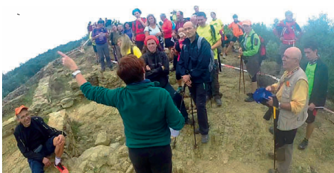
Els participants de la Ronda Vallesana van poder visitar llocs tan emblemàtics com el jaciment ibèric de Les Maleses

La 36a edició d'aquesta sortida a peu de la Unió Excursionista Sabadell, i que enguany ha comptat amb la col·laboració d'El Cim, va transcórrer el 18 d'octubre pel Parc de la Serralada de Marina amb la participació de 800 persones, que tenien la possibilitat de fer dos recorreguts: un de 15 quilòmetres i un més llarg de 23, que van sorprendre per les vistes sobre els vallesos i el front marítim barceloní. JA