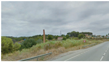
Imatge dels terrenys de la bòvila que Can Cuiàs que van ser requalificats pel trasllat de Valentine

La més greu respon a una petició de 15 milions d'euros