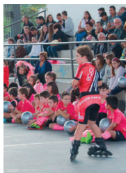
Bon ambient a les grades de la pista del barri

seves diverses modalitats involucra unes 200 persones, bona part de les quals van demostrar les seves habilitats sobre els patins. També es van afegir a la presentació les seccions d'excursionisme, que reuneix una cinquantena de persones, i un