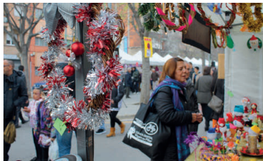
La rambla dels Països Catalans tornarà a ser l'escenari de la tradicional Fira de Nadal

municipi, així com les associacions de comerciants i artesans i les entitats locals podran beneficiar-se de les ajudes que el consistori atorgarà per a la dinamització de la seva parada. Els ajuts es donaran per ordre de les inscripcions que reuneixin els requisits específics a les bases, que es poden consultar a www.montcada.cat , portal on també es pot descarregar la sol·licitud d'inscripció i la resta de documentació necessària per formar part de la Fira.