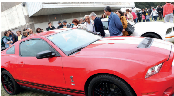
Més d'un miler de persones van visitar la tercera edició de la Fira de l'Automòbil i la Concentració de Vehicles antics el passat 18 d'octubre

Un centenar de cotxes i motocicletes va participar a la concentració de vehicles clàssics