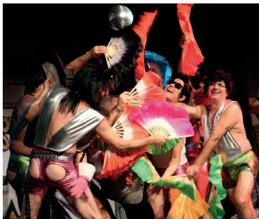
Una de les escenes de l'obra d'Els Tittelles, 'Ràdio La Tita. Los 40 Frikitaun', estrenada el dia 25

Cerimònia. La programació es va donar a conèixer el 18 d'octubre en una vistosa gala al Teatre Municipal conduïda pel grup Divinas, guanyador del premi del públic de la temporada 2013-2014. En la primera part de l'acte, els vuit grups que participen a la mostra –Els Tittelles, Teatrac, Tea345, La Salle Montcada, Teatroit, Dèria, Sayuc i l'Aula de Teatre– van avançar un fragment de les propostes que representaran fins al desembre. En la segona part,