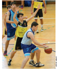
El júnior blau ha guanyat la meitat dels partits