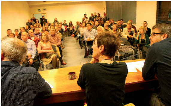
La reunió que es va convocar el 9 de novembre, a la Casa de la Vila, per presentar el projecte va aixecar força expectació

El govern tindrà en compte els suggeriments que puguin contribuir a millorar l'actuació