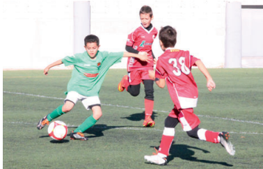
El CD Montcada B acumula 15 punts mentre que l'EF Montcada D només ha pogut sumar 4

Ambdós benjamins juguen al grup 35è de Tercera Divisió i es van enfrontar el 7N