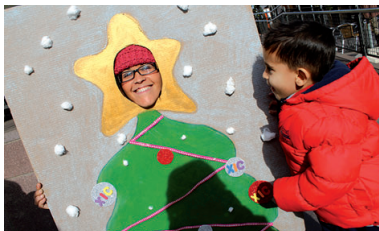
La Xic Can Ulls va fer l'any passat un taller d'arbres de Nadal per als més petits

bre roba i un altre que consistirà a fer embolcalls per als regals de Nadal amb plàstics reciclats. El Mercat d'Intercanvi comptarà un any més amb la col·laboració de la Xarxa d'Intercanvi de Coneixements de Can Ulls. L'esdeveniment coincidirà amb la celebració de la Setmana Europea de la Prevenció dels Residus. L'acte acabarà amb un aperitiu popular preparat pels voluntaris i els treballadors d'Andròmines.