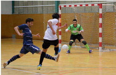
Imatge del partit contra la Barceloneta, de la 3a jornada, que va finalitzar amb derrota local