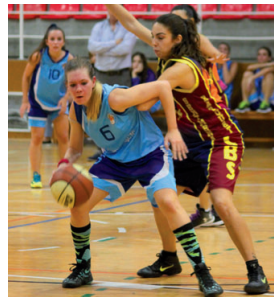
El sènior femení de l'UB MIR lluita per assolir la primera victòria