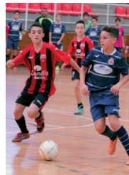
Imatge del partit contra el CF Sagarra

L'equip de Xavi Romero és 10è a la classificació general