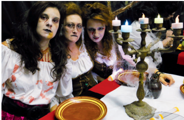
Tres hostesses inquietants esperaven els clients de l'Hotel Terra Nostra el dia 1 de novembre

Un total de 600 persones van passar per l'equipament