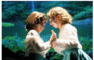
Una escena del muntatge poètic de Dèria Teatre, basat en l'obra de la poetessa Gioconda Belli

nou espectacle del grup de Teatre La Salle Montcada 'Get Back el musical' (22h). Les últimes propostes de la MAE estrenades, 'Taxi!', de Teatrac, i 'Arsénico