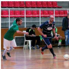
L'FS Montcada B, en un partit contra el CFS Cerdanyola