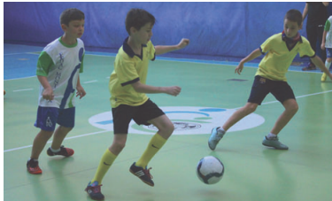
Alumnes de FEDAC Montcada, que actuen amb a locals, contra els de l'escola Reixac

Infants i joves participen des de finals d'octubre en els Jocs Esportius Escolars, organitzats per l'Institut Municipal d'Esports i Lleure i el Consell Esportiu de Montcada i Reixac (CDEM). Els representants l'AE Can Cuiàs i de les escoles Fedac Montcada (antic Sagrat cor), Reixac i El Viver juguen en partits d'anada i tornada fins a mitjans d'abril en multisport (prebenjamí) i futbol sala (aleví i benjamí).