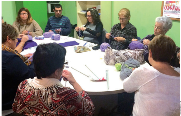
Les dones de la Xic Can Cuiàs teixint els fragments de llana de color lila per participar a la iniciativa de vestir els arbres del carrer Major el 25N

Més propostes. Altres actes del 25N seran un taller de defensa personal al pavelló Miquel Poblet, de 10 a 13h, i la lectura d'un manifest a la pista esportiva de Can Cuiàs, organitzada pel Grup de Dones del barri (18h). A les 19h, s'il·luminarà de lila l'Auditori Municipal. El programa també inclou dues xerrades sobre la prevenció de la violència de gènere, a càrrec dels Mossos d'Esquadra. La primera tindrà lloc el 26 de novembre, a les 18h, a la biblioteca Elisenda, i la segona, el dia 30 a la mateixa hora, a la biblioteca de Can Sant Joan. D'altra banda, la Casa de la Vila acollirà el 26 de novembre i el 2 de desembre, de 18 a 20h, un taller d'empoderament de les dones sota el títol 'Les identitats