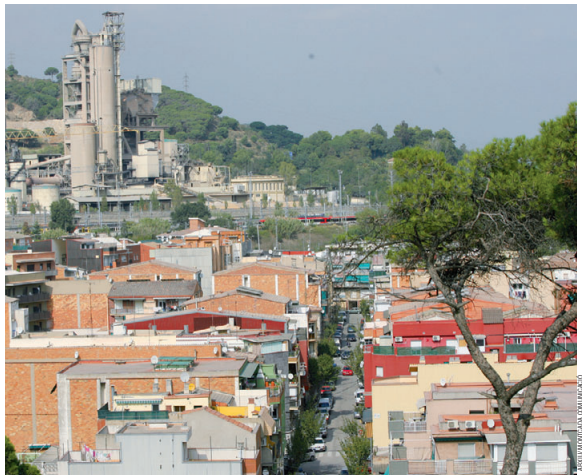
En aquesta imatge es pot apreciar la proximitat existent entre els habitatges de Can Sant Joan i la planta muntacadena de Lafarge Cementos