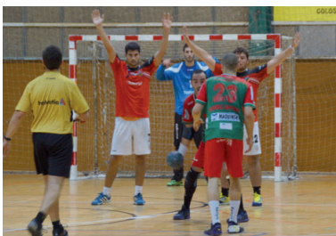
El bon treball a la porteria i en defensa va ser clau per sumar un punt contra l'H. Sant Quirze