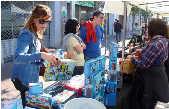
El bon temps que va fer dissabte al matí va animar la gent a visitar les diferents parades dels comercials a la recerca d'ofertes interessants

En la vessant comercial, el màxim responsable de l'MCC també ha fet una valoració positiva, tot i que, segons el seu punt de vista, aquesta fira no es fa amb l'objectiu de vendre sinó de donar a conèixer els negocis entre la ciutadania. "És la fira que volem,