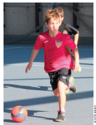
Imatge del partit contra l'FS Ripollat