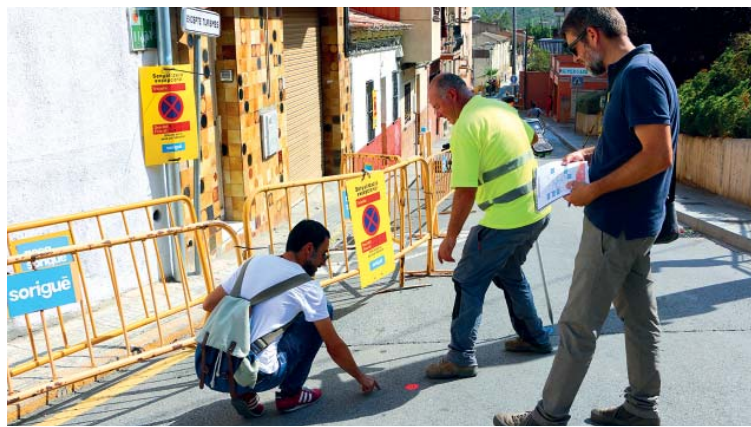
El president de l'Àrea Territorial, a la dreta, va visitar el c. Diagonal prèviament a l'inici de les obres