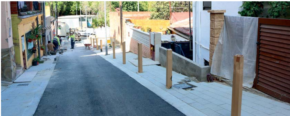
La remodelació del carrer Triangle –en la imatge, a final d'agost– ha inclòs el soterrament de les línies de serveis de llum i telèfon

L'actuació, que es farà per fases, està pressupostada en poc més de 475.000 euros