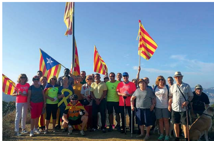
El PDeCAT continua amb la tradició d'hisar la senyera al turó de Moia iniciada per CDC

El CDR de Montcada, per la seva banda, va organitzar, després de l'acte institucional, la pintada d'un mural al riu Ripoll amb el lema 'Llibertat presos polítics' i un vermut popular.