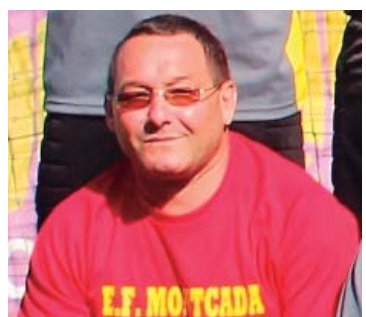
Mesa va estar vinculat a diferents clubs de futbol