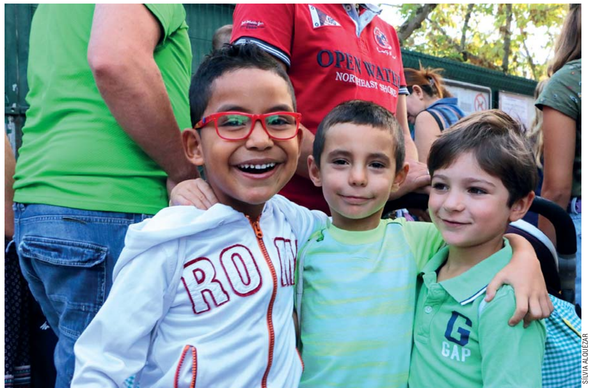
Tres infants de l'escola Reixac s'abracen somrients en el seu retrobament a la porta de l'escola el primer dia de classe