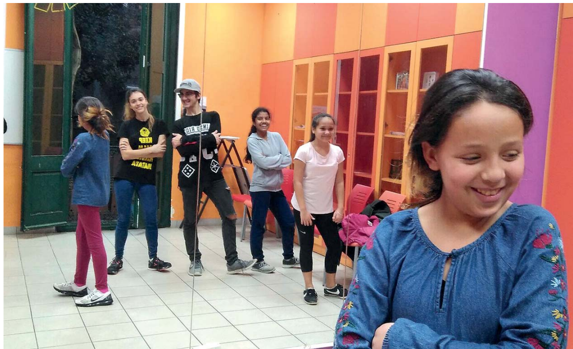
Les expressions artístiques com el hip-hop i el rap articularan la reflexió sobre els diferents tipus de violències a la vida quotidiana

L'Ajuntament ha posat en marxa aquest mes de setembre un nou projecte adreçat a joves de 14 a 21 anys amb l'objectiu de reflexionar sobre els diferents tipus de violències quotidianes a través de l'art urbà. 'Why violence?' és una iniciativa transversal de les regidories d'Educació, Infància i Joventut i Serveis Socials que es desenvoluparà durant l'últim trimestre de l'any i clourà amb un espectacle final dissenyat i protagonitzat pels participants que es presentarà al Kursaal al desembre.