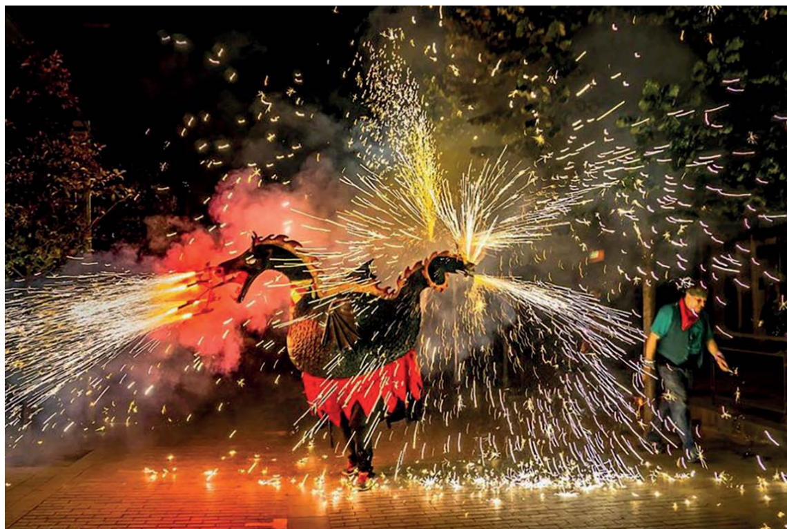
El drac Joan, construït per membres de la colla i de 45 quilos de pes, va ser presentat públicament el 23 de juny de 1988 a Can Sant Joan

Cercavila. A la tarda, les colles i les seves bèsties, juntament els músics, protagonitzaran una cercavila des de l'Espai Poblet fins al carrer Major i la plaça de l'Església, on es durà a terme la segona plantada de bestiari (18h), a més de l'actuació dels Castellers de Montcada i Reixac i una tabalada. La jornada acabarà amb un correfoc en què prendran part les 26 bèsties convidades, que faran el recorregut a la in-