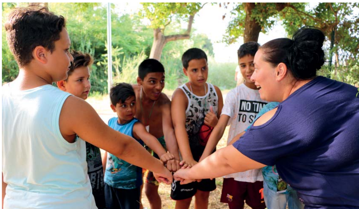
Una de les activitats que s'han fet aquest estiu ha estat una gimcana per conèixer la història del canal mil·lenari del Rec Comtal

El programa va cloure el dia 8 amb una festa a la plaça del Bosc de Can Sant Joan