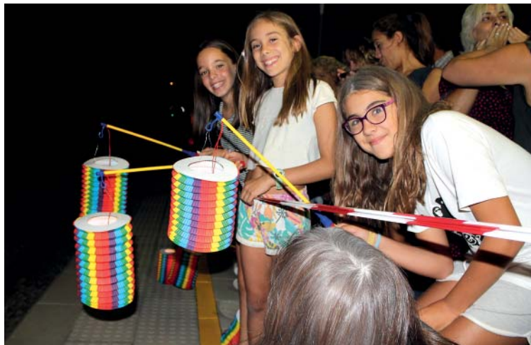
Un grup de noies, esperant l'arribada del tren a l'estació de Terra Nostra amb els fanalets de paper