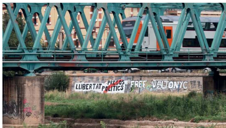
Mural pintat pel CDR a la llera del Ripoll amb el lema 'Llibertat presos polítics'