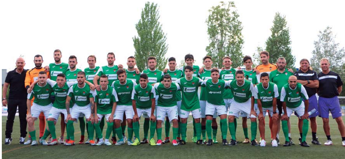
El CD Montcada s'ha renovat completament respecte la temporada passada i, de moment, ha començat la competició amb un bon nivell de joc i resultats