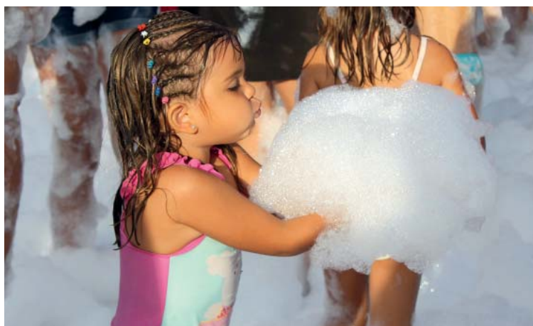
Una nena, gaudint de la festa de l'escuma que va tenir lloc a la plaça del Poble diumenge a la tarda