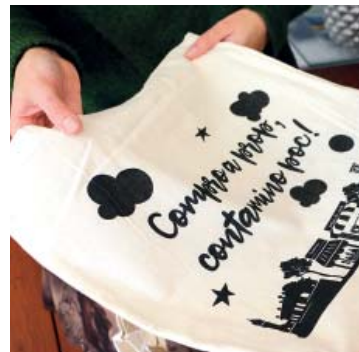
Les bosses de roba es repartiran als comerços

Objectius. La iniciativa va sorgir de les regidories de Comerç i Turisme i Medi Ambient, arran la nova llei catalana que prohibeix als establiments distribuir gratuïtament les bosses de plàstic, amb l'objectiu de fomentar la sostenibilitat. Les associacions de comerciants del municipi s'encarregaran de lliurar als establiments associats. Les botigues que no formin part de cap entitat, poden venir a buscar-les a l'Ajuntament.