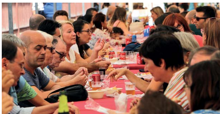
El carrer Guadiana es tornarà a convertir, durant dos dies, en un gran menjador a l'aire lliure

tos i un altre de cerveses artesanals. També hi haurà tapes i plats sense gluten i per a vegans i vegetarians. La novetat d'aquesta sisena edició serà que la fira s'obrirà amb un tast de vins a càrrec de Catavins que es farà el dissabte, a partir de les 12h, i que es repetirà, a les 19h, i l'endemà, a les 12h. Aquesta activitat es limitarà a un màxim de 20 persones per sessió i el preu serà de 10 euros. Les persones interessades que vulguin participar s'han d'inscriure prèviament al correu electrònic info@gastronomiareixac.es o enviant un missatge al Facebook de la Gastronòmica Reixac.