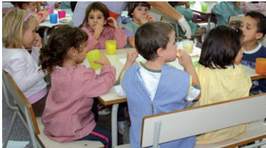
Els factors econòmics tindran més importància en la concessió de les beques de menjador

Les famílies que vulguin beneficiar-se d'un ajut escolar que atorga l'Ajuntament i/o d'una beca de menjador per al curs acadèmic 2015-2016, que dona el Consell Comarcal del Vallès Occidental, poden fer la petició fins al 15 de maig. Les famílies hauran de presentar dues sol·licituds diferents en el cas que vulguin optar als dos ajuts i registrar-les a l'Oficina d'Atenció Ciutadana (OAC), a l'Ajuntament.