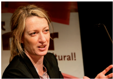
El llibre de Milena Busquets ja va per la quarta edició i es traduirà a més de vint idiomes