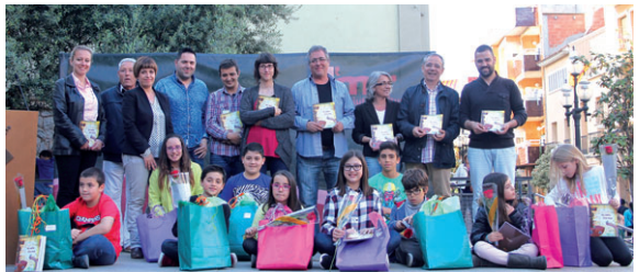
Els guanyadors del concurs 'Els Contes d'en Sergi', amb les autoritats municipals, al final de l'acte que es va fer a la plaça de l'Església el dia 22