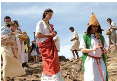
Un dels moments del rodatge del documental sobre el ritual d'abandonament del poblat ibèric

Recreació. L'aspecte més novèdós és un audiovisual que recrea aquests rituals d'abandonament i que va ser enregistrat al jaciment ibèric el passat 11 d'abril, amb l'assessorament de l'equip d'Ibercalafell. El treball compta amb la participació de col·laboradors habituals, voluntaris de l'Associació Amics del Museu i alumnes