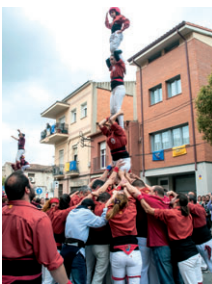
Actuació dels Castellers de Montcada i Reixac