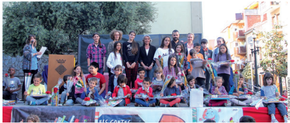
Els premiats del concurs 'Guanya't un punt' posen al final de l'acte, amb les autoritats i els lots de llibres i material de dibuix que van obtenir

Homenatge. El Centre Juvenil La Ballesta, organitzador del certamen, va recordar la figu-