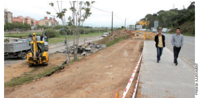
Les obres del vial per accedir a la Font del Tort van començar a final del mes d'abril

Per poder creuar la carretera, se senyalitzarà un pas de vianants regulat per un semàfor amb polsador. "Aquesta obra és molt necessària per garantir la seguretat de la ciutadania i propiciar un pas accessible a la Font del Tort i a la resta de la Serralada de Marina" , ha destacat el president de l'Àrea Territorial, Juan Parra (PSC). El preu total de l'actuació està al voltant dels 200.000 euros, dels quals l'Ajuntament n'aportarà uns 20.000, mentre que la resta els assumirà la Diputació.