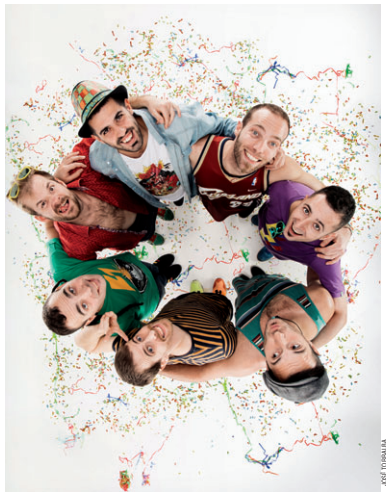
Es set membres del grup montcadenc La Pegatina, que té el seu local a Mas Rampinyó

Gira. La banda va començar al Festival Viña Rock (Albacete) una gira que els portarà durant per Catalunya i tot l'estat espanyol, a més d'Holanda, França i Mèxic. El grup té previst fer tres concerts exclusius per als compradors del disc a la Sala Joy Eslava de Madrid (14 de maig), la Salamandra de l'Espitalet (15 de maig) i la Stage Live de Bilbao (22 de maig).