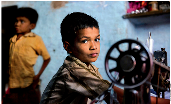
El comerç just no ven cap producte que estigui fet amb mà d'obra infantil, a diferència d'algunes empreses multinacionals que sí ho fan

La festa del comerç just i la banca ètica tindrà lloc el 17 de maig a la plaça de l'Església, de 10.30 a 14h. Hi haurà una mostra d'entitats de cooperació, venda de productes de comerç just, informació sobre la banca ètica, tast de cafè i altres productes, a més de tallers infantils i activitats com l'actuació del grup de batucada Batucamelà! (11h). D'altra banda, la cuinera Àngels Puntas farà un tast de batuts de xocolata i, a les 12.30h, començarà l'espectacle infantil 'Karibit! Cançons i danses per a un món més just', a càrrec de Carles Cuaberes.