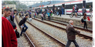
Els usuaris de Renfe creuant les vies per accedir al tren a l'estació de Bifurcació, el dia 5