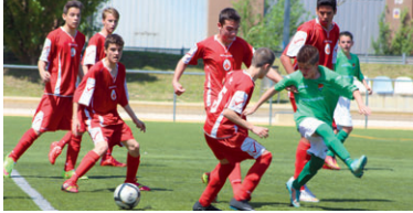
El cadet B del CD Montcada segueix segon, tot i que ja no pot ser campió i té complicat poder pujar

El cadet B del CD Montcada va guanyar el derbi contra l'EF Montcada B (1-3) que es va disputar el 2 de maig a l'estadi de la Ferreria corresponent a la 26a jornada del grup 30è de Segona Divisió. Abans d'aquest derbi, l'alevi D de l'EF Montcada va derrotar el C del CD Montcada per 4-9 a la 26a jornada del grup 38è de Tercera Divisió.