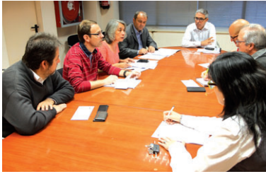
L'alcaldesa va informar de les novetats sobre el recurs als grups municipals i a la Plataforma

Plataforma. El col·lectiu Tracte Just Soterrament Total (PIJST) ha enviat una carta als caps de llista de tots els partits polítics