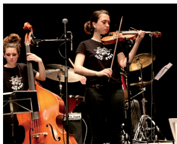
Un moment del concert de la Sant Andreu Jazz Band al Teatre Municipal de Montcada