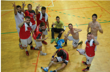
Un grup de jugadors del primer equip del CH La Salle assenyalen amb els dits la tercera posició final

El sènior masculí del CH La Salle ha finalitzat la lliga a la tercera posició del grup D de la Primera Estatal gràcies a la seva victòria a l'última jornada al pavelló Miquel Poblet contra l'OAR Gràcia (36-33). Aquest triomf, afegit a la derrota del Joventut Handbol Mataró a la pista de l'H. Gavà (34-30), permet que l'equip de Jaume Puig acabi la lliga invicte com a local i en una històrica tercera posició, amb 47 punts i un balanç de 21 victòries, 5 empats i 4 derrotes. El tècnic Jaume Puig, que encara no vol parlar de la seva continuïtat a la banqueta, no pot amagar la seva alegria per aquest gran èxit: "Més que a nivell personal,