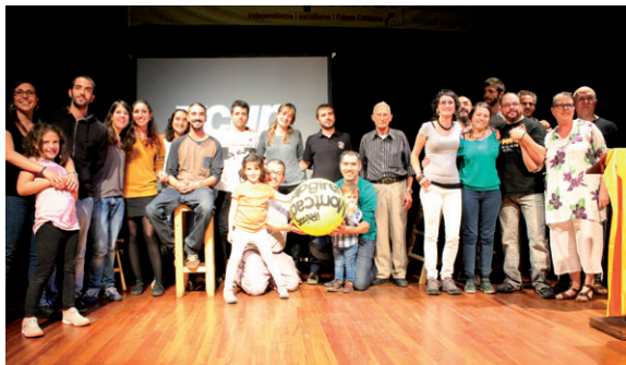
Els membres de la llista de la CUP, a dalt de l'escenari de l'Auditori Municipal a l'acte de la presentació de la candidatura