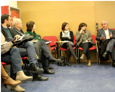
La Xarxa Antirumors va fer la primera reunió amb entitats el passat mes de març a l'Ajuntament

La Xarxa Antirumors ha convocat una reunió el 20 de maig, a les 18h, al Kursaal, oberta a la ciutadania i les entitats. L'acte comptarà amb una formació a càrrec de la Xixa Teatre. La Xarxa forma part del programa "Montcada Antirumors" i l'impulsa la Regidoria d'Integració en coordinació amb l'entitat D-CAS. En aquest marc, ja s'ha fet formació a una vuitantena de treballadors del consistori i representants polítics i a final de maig està previst que es faci una enquesta a peu de carrer a 400 persones, per valorar la seva sensació respecte la diversitat | LR