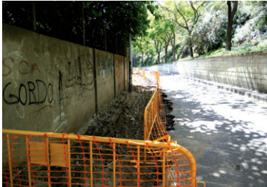
Les obres de millora de l'entorn del Rec Comtal han començat a principi del mes de maig

Les obres per adequar l'entorn del Rec Comtal entre Can Sant Joan i Vallbona van començar a principi de maig. Els treballs, valorats en més de 700.000 euros, estan finançats per l'Ajuntament de Barcelona, gràcies a un conveni urbanístic amb el consistori montcadenc. El projecte, que dona resposta a les reivindicacions dels veïns, inclou la reurbanització del passatge del Reixagó, on es renovaran les voreres, la calçada i la il·luminació.