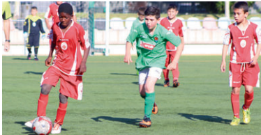
Al derbi d'alevis, que va acabar amb victòria del D vermell, es van poder veure un total de 13 gols

Instància. Un grup de pares i mares vinculats al CD Montcada va entrar per registre a l'Ajuntament un escrit amb 450 signaturs preguent al govern quina solució donarà al repartiment dels espais d'entrenaments. LIME va respondre recordant la vigència del decret d'octubre de 2014 que estableix el conveni existent amb el club i que recull l'assignació d'espais i horaris per entrenar. | RJ