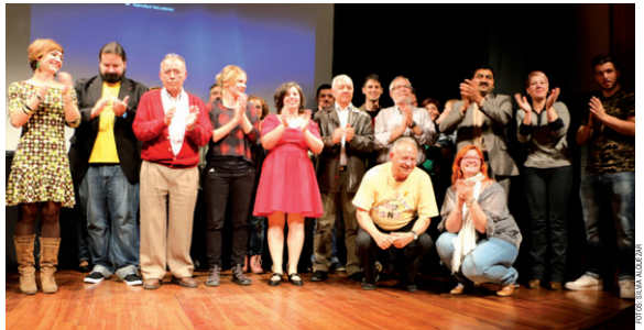
Les persones que formen part de la llista d'ICV-EUiA-E, a l'escenari de l'Auditori el dia de la presentació de la candidatura, el 29 d'abril