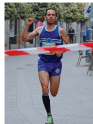
Cera, a punt de creuar la línia de meta