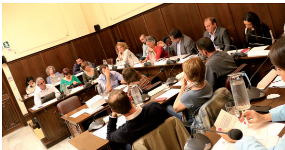
El Ple d'abril va ser l'última sessió ordinària del mandat, on novament les qüestions urbanístiques i econòmiques van centrar bona part del debat

Ampliació d'equipament. Un dels projectes aprovats al Ple va ser l'ampliació i millora del Centre Cívic de Can Cuiàs, per valor de 400.000, que seran finançats amb una subvenció de la Diputació de Barcelona. "L'ajut s'ha concedit ara i seria una irresponsabilitat no aprofitar-lo", va explicar Parra, qui va argumentar la necessitat d'ampliar l'equipament perquè té molts usuaris i activitats. La instal·lació passarà de 554 a 700 m 2 , s'articularà mitjançant una nova sala polivalent que funcionarà com a espai central i com a enllaç entre l'edifici i el nou espai, que acollirà el bar i els altres serveis. L'ampliació inclou també una zona de bar més apartada de les aules de cursos que en l'actualitat, amb dos nous lavabos per tal que pugui funcionar