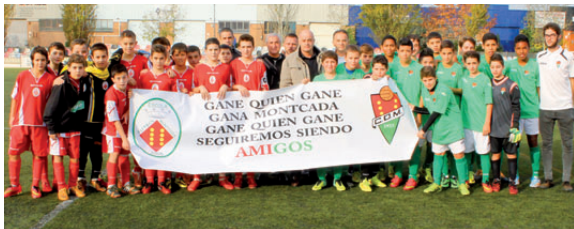
Jugadors, cos tècnic i els presidents d'ambdós clubs van voler oferir una imatge d'unitat i bona entesa abans d'un derbi disputat al novembre passat

Les sessions comencen abans i acaben més tard per poder encabir tots els equips