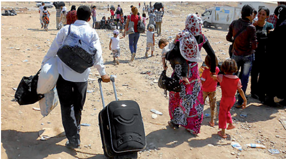
Montcada portarà al Ple de setembre una moció per adherir-se a la Xarxa de Ciutats Refugi, promoguda pel Fons Català de Cooperació