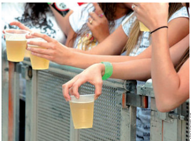
El PASSA és un servei d'informació i assessorament sobre drogues adreçat als joves i les famílies

El Punt d'Informació i Assessorament en Drogues (PASSA) de l'Ajuntament posarà en marxa a l'octubre el programa OM, una iniciativa adreçada a nois i noies de 12 a 14 anys que durà a terme conjuntament amb Can Tauler i els dos centres oberts de Font Puudenta i la Ribera. En el marc de l'educació no formal, el projecte pretén acompanyar els adolescents en la seva trajectòria vital i treballar factors de protecció davant les addiccions. Els participants, al voltant d'una trentena, tractaran temes com la percepció d'un mateix, el creixement personal i el pensament crític.