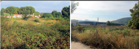
A l'esquerra, Can Llobet; a la dreta, La Granja

7/06/2002 L'empresa presenta full d'advertiment de presentació del procés expropiatori