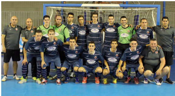
Foto per a la història de l'FS Montcada. Jugadors i cos tècnic es van fotografiar a la pista del pavelló Nou de Santa Coloma abans del partit contra el Barça

derava que, tot i l'eliminació, el club i la ciutat s'havien de sentir orgullosos de la imatge que havia ofert l'equip: "Hem jugat el millor partit de la pretemporada, amb molta intensitat. Hem donat la cara, especialment a la primera meitat, però ens ha passat factura jugar contra un dels millors equips del món".