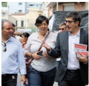
López, al mercat, amb membres del PSC

El secretari d'Acció Política, Ciudadana i Llibertats del PSOE i exllochendakari del País Basc, Patxi López, va comparar el dia 16 a Montcada la situació actual de Catalunya amb la que es viu a Euskadi "on es va acabar imposant el sentit comú perquè no és possible construir un país des de la confrontació" , va dir. López també va criticar el president de la Generalitat, Artur Mas, i la seva política de retallades, argumentant que "el PP i CiU són la mateixa cara d'una mateixa moneda" i SA