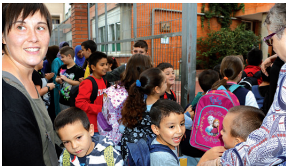
Famílies acompanyant els seus fills a l'entrada de l'escola El Turó en el primer dia de classe, el passat 14 de setembre

"El curs escolar ha començat amb normalitat i estem contents pels nous serveis que ens han atorgat a la ciutat" , ha manifestat la regidora d'Educació, Jessica Segovia (ICV-EUiA-E), qui també ha destacat l'increment en 24 propostes de la guia d'activitats educatives que edita el consistori cada curs, moltes d'elles sobre l'educació en valors, les competències emocionals i la transició escola-treball. Coincident amb l'inici del curs escolar, l'alcaldeessa, Laura Campos (ICV-EUiA-E), i la regidora d'Educació van visitar l'escola Font Freda, un centre on, com a novetat, aquest curs disposarà d'un nou hort. D'altra banda, 267 alumnes van començar les classes a la xarxa d'Escoles Bressol Municipal, formada per cinc centres: Font Freda, Miña Costa, Can Sant Joan, Can Casamada i Camí del Bosc.