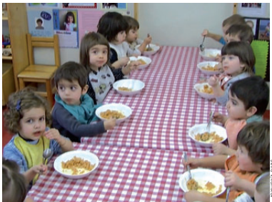
Infants d'una de les de P2 de l'EBM Can Casamada del curs passat durant l'hora de dinar

Un total de 34 famílies de Montcada i Reixac gaudeix de les beques per a l'escolarització i el servei de menjador a les Escoles Bressol Municipals (EBM) que ha atorgat l'Ajuntament aquest curs. Tenint en compte que hi ha un total de 273 alumnes inscrits als cinc centres públics, aquesta xifra suposa que els ajuts beneficien el 12% dels infants.