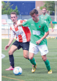
El CD Montcada B encara no ha puntat