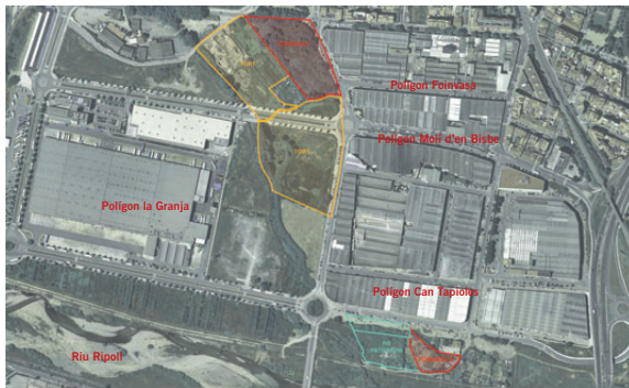
Imatge dels sectors on es troben els terrenys afectats per les expropiacions que l'Ajuntament ha d'assumir