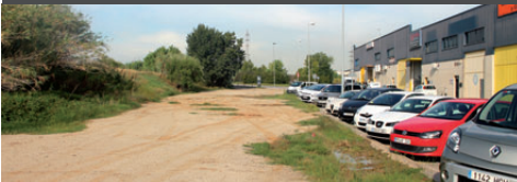
Zona verda de Can Tapioles, ubicada entre el polígon i la llera del riu Ripoll

7/01/2005 L'empresa presenta full d'advertiment de presentació del procés expropiatori