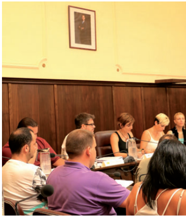
La sessió plenària de juliol serà l'última en què la Sala de Plens tindrà la imatge del Borbó