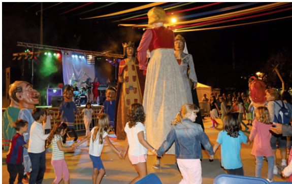
Els Gegants de Montcada van participar en l'acte d'obertura del ball amb orquestra que es va fer el dia 5 de setembre a la plaça del Poble

La major part de les activitats programades van tenir una elevada participació