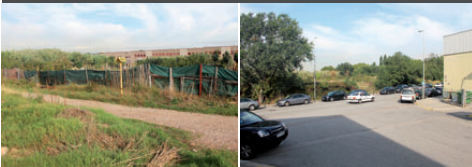
A l'esquerra, Can Tapioles; a la dreta, Can Llobet

16/06/2004 L'empresa presenta full d'advertiment de presentació del procés expropiatori