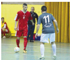
L'EF Montcada i l'AE Can Cuiàs s'enfrontaran el dia 25

La primera jornada al grup 1 es disputarà el 17 d'octubre. L'EF Montcada debutarà a casa contra l'FS Unió Mollet B (17.45h), mentre que l'AE Can Cuiàs A jugarà el seu primer partit a la pista del Futbol Mataró B. Ambdós s'enfrontaran el 25 d'octubre, a les 17h, a la pista de Can Cuiàs. RJ