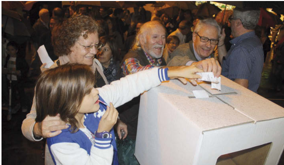
Els participants a la concentració feta davant de la Casa de la Vila van votar de forma simbòlica en una de les urnes que es va fer servir el 9N

La concentració es va fer, sota la pluja, davant de la Casa de la Vila el passat 13 d'octubre