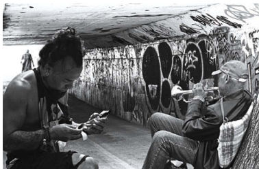
Una de les fotografies d'alumnes dels cursos de l'Afotmir que s'exposa a l'Espai Cultural Kursaal