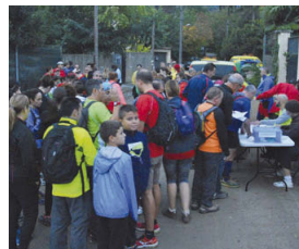
Alguns dels participants en dels punts de control de la caminada