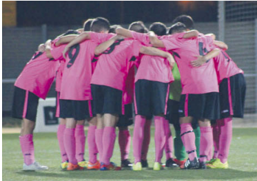
Els jugadors del juvenil A fan pinya, vestits de rosa, abans del seu partit contra el Sabadell Nord