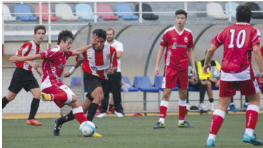
L'Unió Esportiva Castellar va aconseguir set gols a la porteria del juvenil de l'EF Montcada