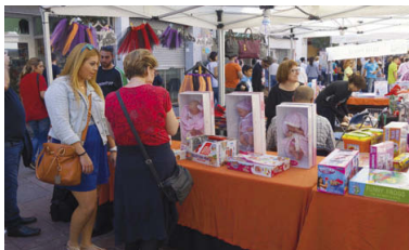
El carrer Major s'omple de parades de comerciants durant la celebració de la Fira de l'Aigua

gut arriscar-nos", ha expressat l'entitat en un comunicat. Les activitats programades diumenge com les exhibicions de ball a la plaça de l'Església i els inflables i tallers per als més petits també s'han suspès. Finalment, la fira ha estat traslladada, a proposta de l'MCC i amb el vistiplau de l'Ajuntament, per als dies 7 i 8 de novembre. Les persones que estiguin interessades a participar-hi es poden posar en contacte amb l'MCC a través del telèfon 935 751 766 o mitjançant el correu electrònic montcadacentre@telefonos.net .