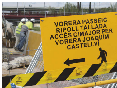
La zona afectada per les obres ha estat senyalitzada per indicar els itineraris alternatius