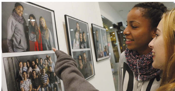
Dues joves miren el retrat que es van fer a Gran Plató, una activitat que organitza l'Afotmir per segona vegada donada la gran acceptació que té