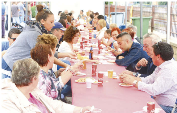
Unes 3.000 persones van passar en algun moment per la Jornada Gastronòmica per gaudir d'algunes de les tapes i plats que es van cuinar