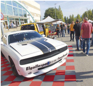
El motor acapararà tot el protagonisme a l'exterior del pavelló Miquel Pòblet durant el dia 18

La Regidoria de Promoció Econòmica, Empresa i Ocupació organitza el 18 d'octubre la tercera edició de la Fira de l'Automòbil i la Concentració de vehicles clàssics i esportius de Montcada i Reixac que es faran davant del pavelló Miquel Pòblet durant tot el dia, de 9 a 19h. Aquesta fira compta amb la inscripció d'una trentena de negocis i entitats relacionades amb el món del motor que instal·laran les seves parades per donar a conèixer a la ciutadania la seva activitat. Alhora, alguns concessionaris permetran veure in situ alguns models de vehicles novetats en el mercat automobilístic. Durant tota la celebració de la fira, també hi haurà un servei de bar, així com altres activitats i tallers destinats als més petits.