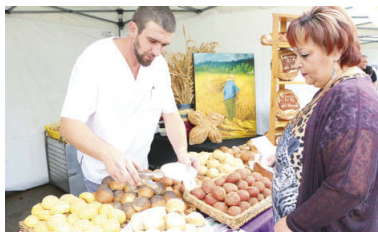
El Forn Oliveras va participar a la mostra gastronòmica amb una selecció de pans de diferents sabors

Valeo, present. Els treballadors d'aquesta empresa, en vaga indefinida des del passat mes de juliol per evitar la deslocalització de la planta de Martorelles a Saragossa, també van ser presents durant els dos dies de celebració de la Jornada Gastronòmica amb una carpa per recollir fons per a la seva caixa de resistència.