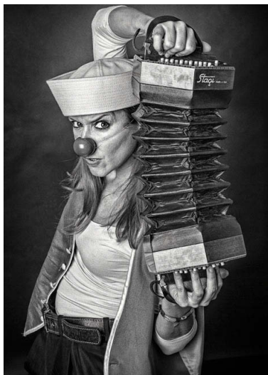
Una de les imatges de la col·lecció en blanc i negre que li ha meregut el reconeixement de la CEF

Sessió pallassa. Lacunza ha resultat premiat amb una sèrie de 10 fotografies en blanc i negre de pallassos fetes a l'estudi de fotografia de l'Afotmir -al Centre Cívic Antiques Escoles de Mas Rampinyo-, en una sessió que va organitzar el mateix. "Tenia ganes de fotografar models que no fossin estàtics i amb els quals poder interactuar i, la veritat, és que va ser una sessió molt divertida i profitosa", ha explicat l'autor, que imparteix