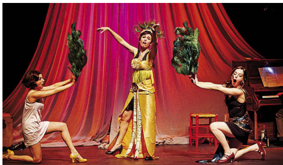
El grup Divinas serà l'encarregat de conduir l'acte de presentació de la novena edició de la mostra de teatre local, que es farà el 18 al Teatre Municipal

musical 'Radio La Tita, los 40 Frikitaun' el 25 d'octubre al Kursaal; Teatrac presenta el vodevil 'Taxi' l'1 de novembre al Kursaal; el grup La Salle Montcada estrena 'Get Back el musical' al teatre de l'escola el 14; Teatroia't presenta el drama 'Doña Ramona' el 20 al Kursaal; Dèria, 'Mujeres habitadas' el 27 a l'Auditori i Sayuc, 'Familia & Cia' el 12 de desembre al Kursaal. El cicle clourà el 19 al Teatre Municipal amb l'obra de 'Aula de Teatre basada en el 'Poema de Nadal', de Josep M. de Sagarra. Com a prèmbul el Taller de Teatre representarà el 16 d'octubre a la Casa de les Aigües l'obra 'Pleni-luni de cera' (22h).