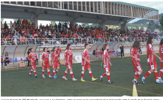
L'equip femení de l'EF Montcada, que juga a La Catalana, entra al camp en la presentació de la temporada amb la grada de la Ferreria plena