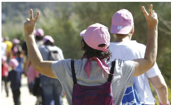
'Sin teta hay paraíso' va organitzar el dia 10 una caminada per la llera del Ripoll en el marc dels actes del Dia Mundial contra el Càncer de Mama

El dia 24 hi ha prevista una exhibició de tai-txi a càrrec de l'Espai Taichí, a les 12h, a la plaça de l'Església. El cap de setmana del 24 i 25 d'octubre, 'Sin teta' instal·larà una carpa a l'estadi de