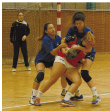
El CH La Salle va superar el Garbí de Palafrugell al Pobleat