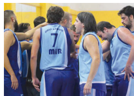
Els jugadors del sènior blau, en una rotllana durant un temps mort