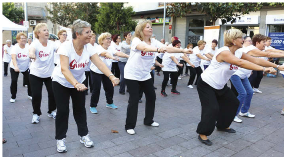
La plaça de l'Església va acollir el 2 d'octubre una exhibició de gimnàstica a càrrec d'usuaris dels dos casals de gent gran del municipi

Al migdia hi haurà una botifarrada popular per als assistents. El tiquet es poden comprar fins al 22 d'octubre a les associacions de gent gran. El programa continuarà a les 17.30h amb un espectacle de varietats amb les actuacions del showman Víctor Guerrero, el cantant Toni Torres, el mag còmic César Vinussa i la vedette Merche Lois. Les entrades, que costen 1 euro, es poden comprar a l'Auditori abans del 23 d'octubre i el mateix dia a taquilla, una hora abans de l'inici de l'espectacle. Pel que fa a diumenge, al matí hi ha prevista una caminada intergeneracional i, a la tarda, una mostra de balls en