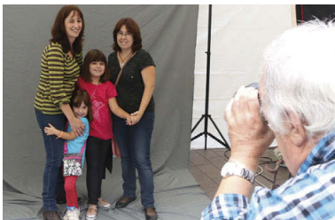
Un dels socis de l'Afotmir, fent un retrat a l'estudi de fotografia 'Gran Plató' del dia 3 d'octubre