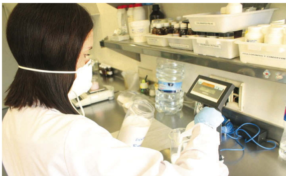
A l'empresa Productos Aditivos s'elabora l'ingredient que serveix per edulcorar la Coca-Cola, una de les begudes més venudes al món