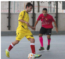
L'Escola va guanyar el derbi disputat a la segona jornada

Encara que els equips locals coincideixen al grup 1r de Segona Catalana, els resultats marquen distàncies. L'EF Montcada ocupa la 7a posició amb 10 punts i suma tres victòries, dues derrotes i un empat. D'altra banda, l'equip del Can Cuiàs és l'últim després d'haver perdut els sis partits que ha disputat i no haver sumat encara cap punt | JA