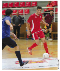
El senior A, en l'últim partit a casa

El Broncesval Montcada és últim al grup 3r de Segona B i acumula deu jornades sense guanyar. L'equip de Javi Ruiz ha perdut els seus quatre darrers partits com a local -l'últim va ser a la 10a jornada contra l'Ol. Floresta (4-5) per culpa d'un gol del porter visitant a dos minuts del final- i ha encadenat cinc empats seguits com a visitant. A la darrera jornada, el Broncesval va empatar sense gols a la pista de l'Esparreguera (0-0), en un resultat poc habitual en el món del futbol sala. LFS Montcada suma 8 punts en 11 jornades i és últim, empatat amb l'Ol. Floresta. JA