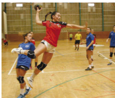
El CH La Salle femení porta una bona línia de resultats