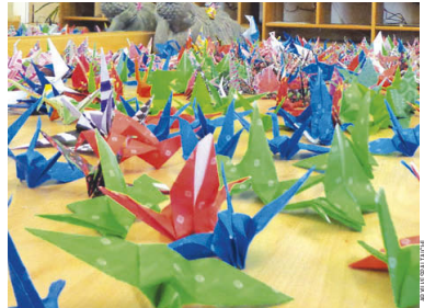
L'Espai Taichí va recollir l'any passat 556 grues de paper per col·laborar amb la Marató de TV3

Altres propostes. L'Espai Taichí, al número 44 del carrer Clavell, repetirà el 29 de novembre, de 10.30 a 13h, l'experiència de l'any passat que va consistir a fer grues d'origami, un art japonès tradicional. El projecte compta amb el suport de