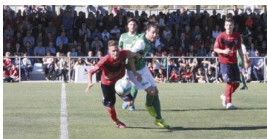
El partit va ser intens, però amb molta esportivitat, tant a la gespa com entre els aficionats