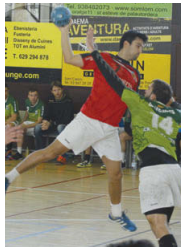
El CH La Salle, a la pista de l'H. Palautordera