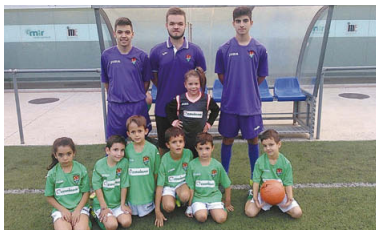
El prebenjamí D del CD Montcada, en una foto de pretemporada, va guanyar el derbi local