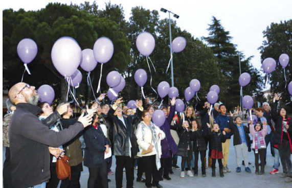
El programa del 25N va començar el 20 de novembre amb una enlairada de globus en record de les víctimes a la plaça del Poble de Terra Nostra

El dia 24 els arbres del carrer Major i de la plaça de l'Església es van vestir amb fragments de llana teixi-