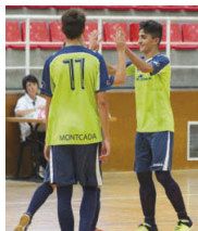
Els jugadors del juvenil A, celebrant un gol