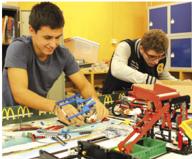
Alumnes de 4t d'ESO de l'escola La Salle durant una de les classes de robòtica