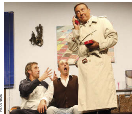
Teatraca va estrenar l'1 de novembre el vodevil 'Taxi' al Kursaal