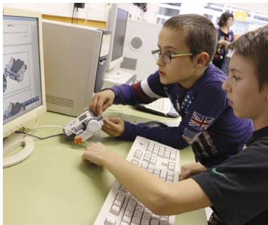
L'Ampa de l'escola Reixac ha introduït aquest curs a la robòtica en les activitats extraescolars