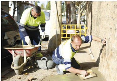
Dos treballadors de manteniment urbà contractats gràcies al pla d'ocupació del SOC

Peons. Provenint també del SOC, el consistori ha rebut 71.897 euros que serviran per contractar 9 persones per a tasques de peons de neteja de zones verdes, rústiques i àrees de joc. El contracte serà de sis mesos, a jornada completa i inclourà un mòdul de 30 hores de formació sobre cines de recerca de feina. Els plans s'adrezen a persones beneficiàries de la renda mínima d'inserció (RMI) i hi tindran preferència dones soles amb càrregues familiars, joves entre 18 i 30 anys, persones de més de 40 anys i aquelles que estiguin a punt d'esgotar el termini màxim de percepció de l'RMI. Els interessats han d'estar inscrits al SOC. Es pot demanar informació al telèfon 935 648 505 o a promocioeconomica@montcada.org .