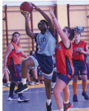
Entrada a cistella contra el CE Sant Gervasi