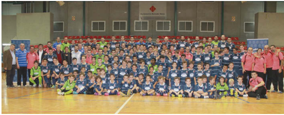
Després de la desfilada de tots els equips, els jugadors, tècnics i directius del CFS Montcada es van fer una foto de família amb les autoritats