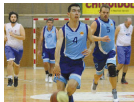
En el seu últim partit a casa, l'UB MIR va perdre contra el Sant Jordi B

El sènior vermell de l'UB MIR ocupa la 6a posició al grup 4t del Campionat Territorial de Barcelona amb 13 punts. L'equip, que havia començat la temporada amb una ratxa de cinc victòries seguides, ha perdut els seus darrers tres partits contra B. Pia Sabadell B (70-50), CEB Sant Jordi B (43-74) i UB Sentmenat B (62-39). "Les ganes de disfrutar jugant a bàsquet tracten de suplir les mancances físiques, ja que som un equip veterà i estem en desavantatge amb la majoria de rivals", diu el tècnic Félix Bosquet | JA