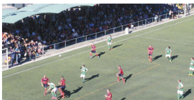
Imatge aèria del derbi que es va disputar el 15 de novembre amb les grades totalment plenes