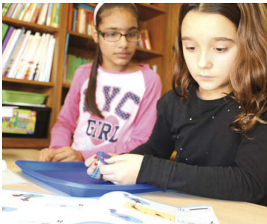
Dues alumnes de 6è de l'escola Fedac muntant una màquina per mesurar distàncies

No és el mateix aprendre en una pissarra com es calcula el perímetre d'un espai que haver de pensar i construir una màquina per mesurar distàncies i després sortir al pati i comprovar que l'aparell dissenyat funciona. En aquesta filosofia d'aprendre fent es basa la robòtica educativa, una eina multidisciplinària que potencia el pensament crític, el raonament, la creativitat i la curiositat científica. Les escoles La Salle i Fedac Montcada –abans Sagrat Cor– són pioneres en la incorporació de la matèria en el currículum escolar. A La Salle és una assignatura optativa a 4t d'ESO en la branca de Tecnologia, mentre que Fedac ha apostat enguany per incloure-la a tots els cursos en l'àrea de matemàtiques.