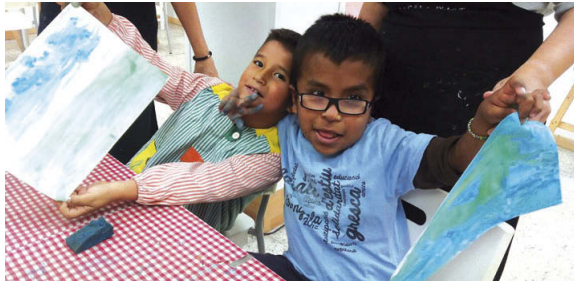
Una de les activitats del programa INTEGRARTE d'Admir és el taller de pintura que es fa l'Escola d'Art La Taca els divendres a la tarda