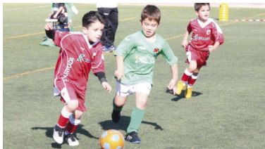
El derbi de debutants que es va disputar el 14 de novembre va finalitzar amb victòria vermella (18-0)