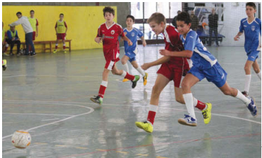
La primera victòria de l'infantil de l'EF Montcada va arribar el 8 de novembre contra el CN Caldes D

L'equip vermell va vèncer per 5 a 1 contra un rival que encara no ha pogut puntuar