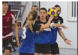
El OK Montcada B va guanyar l'últim partit a casa contra el Vallparadis