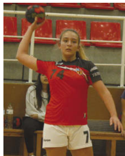
Imatge de l'infantil femení B, al Miquel Pòblet