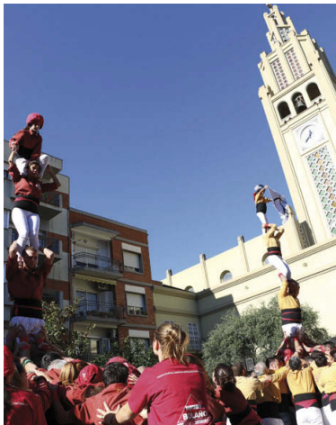
Dos pilars de dol dels atemptats de París van obrir l'actuació de les dues collas a la plaça

Correfoc. Com a actes previs a la Diada, dissabte a la tarda, els més petits van participar en