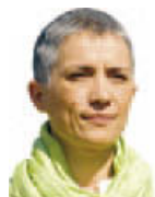
M. Carmen Porro , portaveu del PSC

D'acord amb el Reglament d'ús de Mitjans d'Informació per als portaveus municipals, cada grup disposa d'aquest espai mensual per referir-se a la seva activitat en la corporació i en el municipi i a assumptes d'interès públic municipal. Correspon als edils elaborar l'escrit i assumir la responsabilitat del seu contingut, amb total indemnitat de l'Ajuntament i de la gerència i la direcció del mitjà. Les intervencions hauran de basar-se en el respecte mutu, s'evitarà la confrontació personal i caldrà mantenir unes normes bàsiques de conducta i de cortesia pública. En cap cas es podran destinar els espais reservats a propaganda electoral o a la petició del vot.