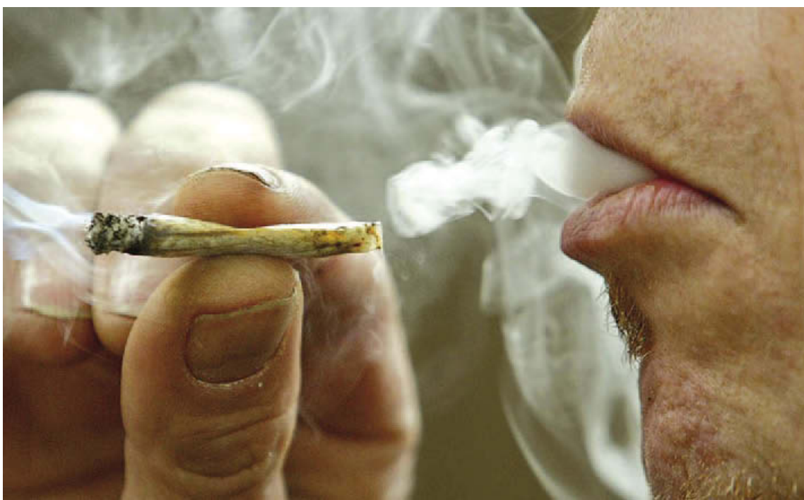
Els agents socials han detectat que l'addicció al cànnabis s'ha normalitzat entre els joves des de fa cinc anys

Pel que fa a primària, Infància i Joventut ha organitzat uns tallers sobre com prevenir les addiccions adreçats al professorat, els alumnes i els pares de 6è, que es duran a terme fins a final de curs. La formació, sota el títol 'Actua sentint, actua amb sentit', anirà a càrrec de la Fundació SEER i té per objectiu facilitar eines perquè els infants millorin la seva capacitat d'elecció a través del control de les emocions per donar les respostes més beneficioses per a ells mateixos. "Volem donar eines als infants perquè no es deixin arrossegar per les conductes de grup i tinguin els seus propis valors", ha explicat Rivas.