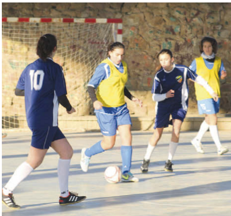
El juvenil femení del Miró està fent una gran primera fase a la lliga del Consell de Sabadell