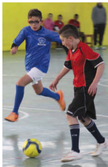
L'infantil de La Ribera, en acció contra el Banús