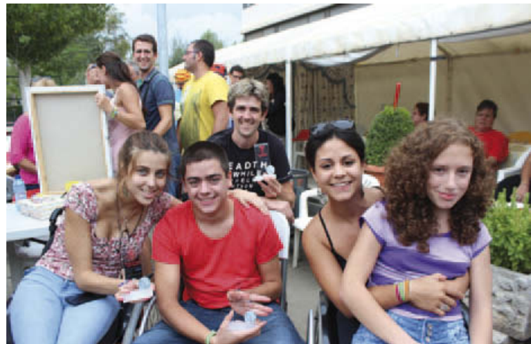
Afectats de la malaltia Atàxia de Freidreich en una festa organitzada per la Plataforma Genefa