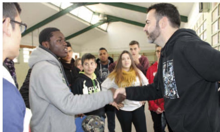
Taller d'eradicació d'estereotips en el marc d'un altre projecte de la Regidoria d'Integració

ment' i formació dels agents que acabaran configurant la Xarxa Antirumors, que rebran una capacitat prèvia per abordar les diferents situacions que poden sortir en un diàleg sobre diversitat i convivència.