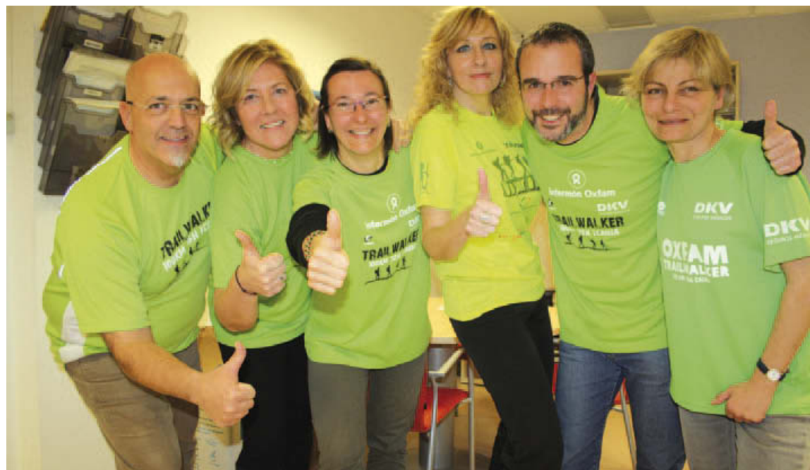
L'equip 'Va per a tu' destinarà una part de la recaptació excident per a la inscripció a la Trailwalker a l'entitat Càritas Montcada

L'equip presentarà el dia 2 les propostes per recollir els diners per a la inscripció