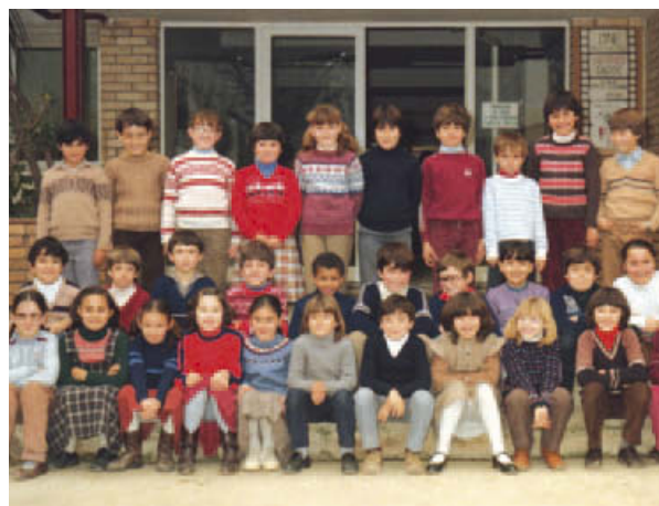
ESCOLA FONT FREDA

L'escola Font Freda farà una exposició amb fotografies, treballs, objectes, notes i tot tipus de documentació i material relacionat amb el centre per commemorar els seus 40 anys de vida. Les persones interessades a col·laborar poden adreçar-se a l'email aliciamartinbcn@hotmail.com o bé al telèfon 618 206 997 | SA