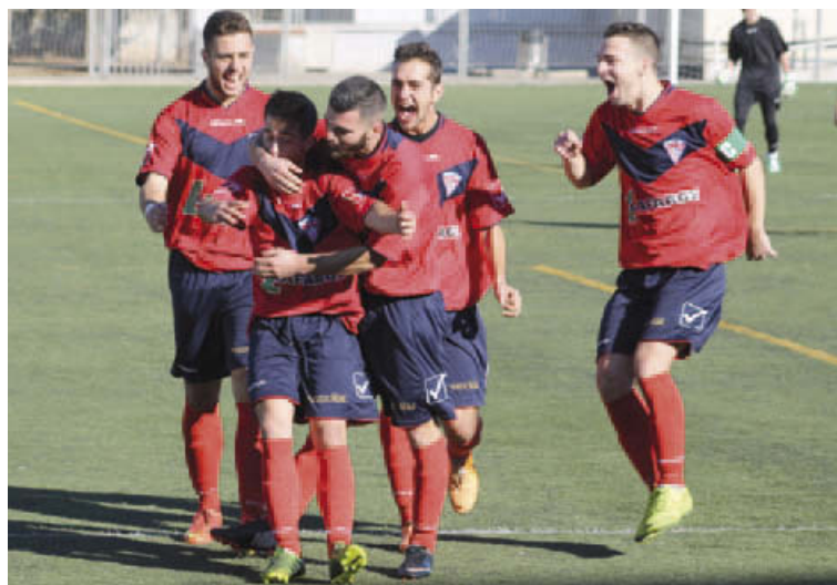
Els jugadors de la Unió celebren un gol durant el partit de la 15a jornada contra l'At. Sant Pol