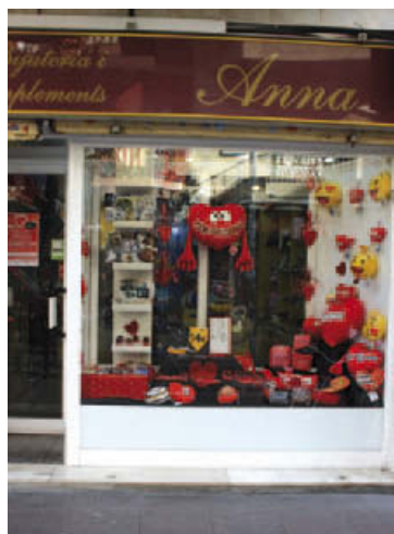
Un dels comerços del carrer Major

Valoració. Els conceptes pels quals l'Ajuntament atorgarà les subvencions són la millora de la imatge, tant exterior com interior, i de la gestió del negoci. Tindran major puntuació les millores in-