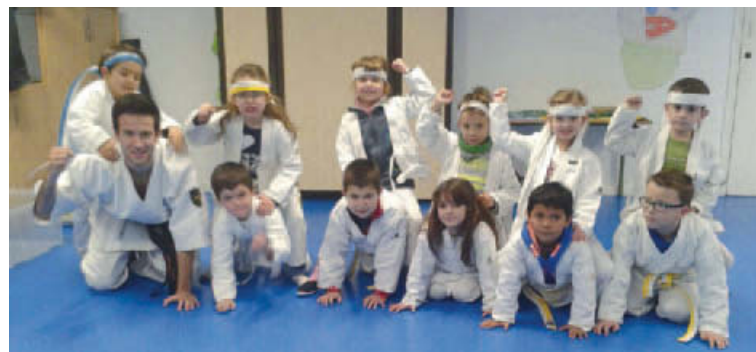
Alumnes del col·legi Sagrat Cor (FEDAC Montcada) que fan l'activitat extraescolar de karate

(11), patinatge (23), anglès (44) i teatre (11). Aquesta última és la única novetat d'aquest curs i ha tingut una molt bona acceptació segons els seus responsables. Pel que fa a l'equip de monitors, continuen la majoria dels que ja estaven el curs passat i s'han incorporat tres nous | RJ