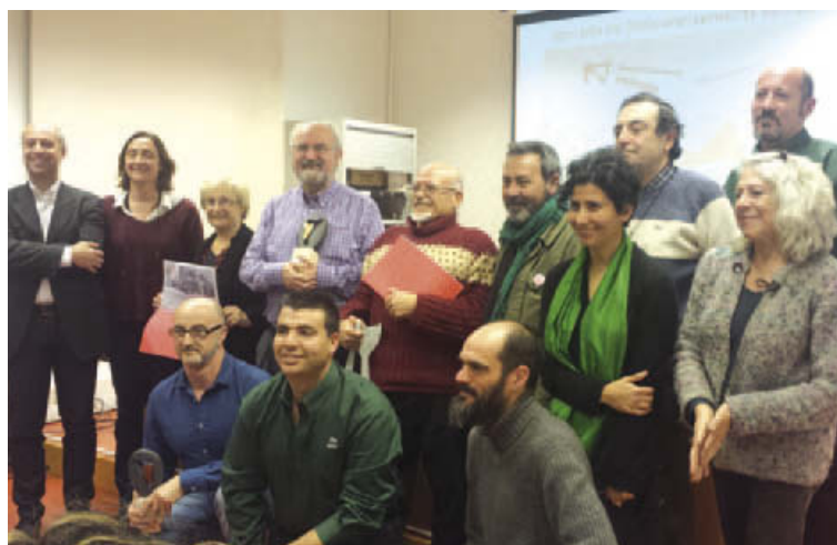
Els representants de l'AV de Ca Sant Joan, al centre de la imatge, amb els altres guardonats

L'AV de Can Sant Joan ha estat guardonada amb el premi del jurat i amb el de votació popular que concedeix la Confederació de Associacions de Veïns de Catalunya per distingir les lluites veïnals. Els guardons han consistit en sengles trofeus i una dotació de 300 euros. L'entitat local optava als premis per la lluita contra la incineració de residus a la cimentera Lafarge competint amb altres 17 moviments veïnals d'arreu de Catalunya entre els quals hi havia diferents col-