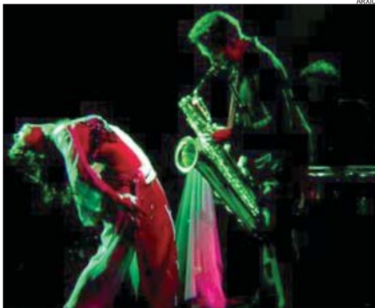
&gt;&gt; Una imatge de l'actuació que es veurà a Montcada