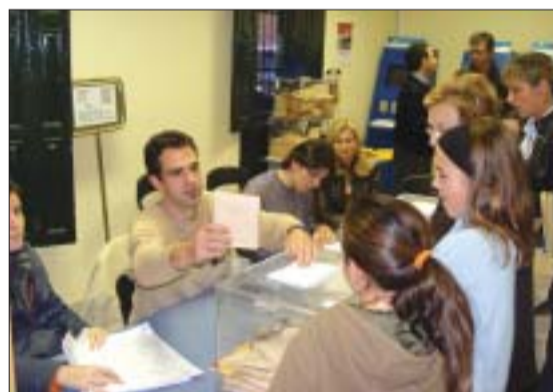
>> Als comicis també es votava el Senat