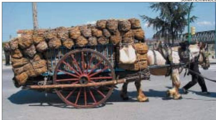
>> Imatge d'un dels traginiers que van desfilat al 2003

Ja està tot a punt per a l'edició 2004 dels Tres Tombs a Montcada, que se celebrarà durant els dies 27 i 28 de març. Dissabte, a les 19.30h, es durà a terme a l'Església de Santa Engràcia la presentació i benedicció de la bandera i la imatge de Sant Antoni, de l'Agrupació Tres Tombs de Montcada. I diumenge: la desfilada dels animals. Una seixantena de cavalls muntats i els mateixos carros hi prendran part en la cavalcada, que es començarà a preparar a les 9h a La Ferreria. A les 11.30h, començarà la cavalcada, que rebrà la benedicció al migdia en passar per la plaça de l'Església; i que passarà pels carrers de la Ferreria, riera de Sant Cugat, Mossén Joaquim Castellví, Major,