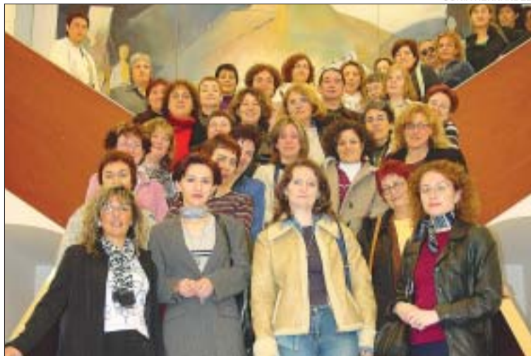
&gt;&gt; Les dues professores, al centre, amb les regidores i el professorat