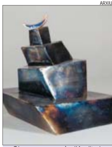
>> Obra que es veurà a l'Auditori

L'Ajuntament estudia la possibilitat d'instal·lar una obra escultòrica d'Oriol Rius en algun espai de Montcada. Aquesta iniciativa, s'afegeix al projecte — ja més avançat — de col·locació d'una obra del també escultor Marzo Marz. Com ha explicat l'alcalde en diverses ocasions, aquestes decisions responen a la voluntat de fer de Montcada un municipi ple d'art, amb grans escultures a l'aire lliure en diferents espais, que enriqueixin la ciutat i, alhora, facin de nexes d'unió entre els diferents barris. LR