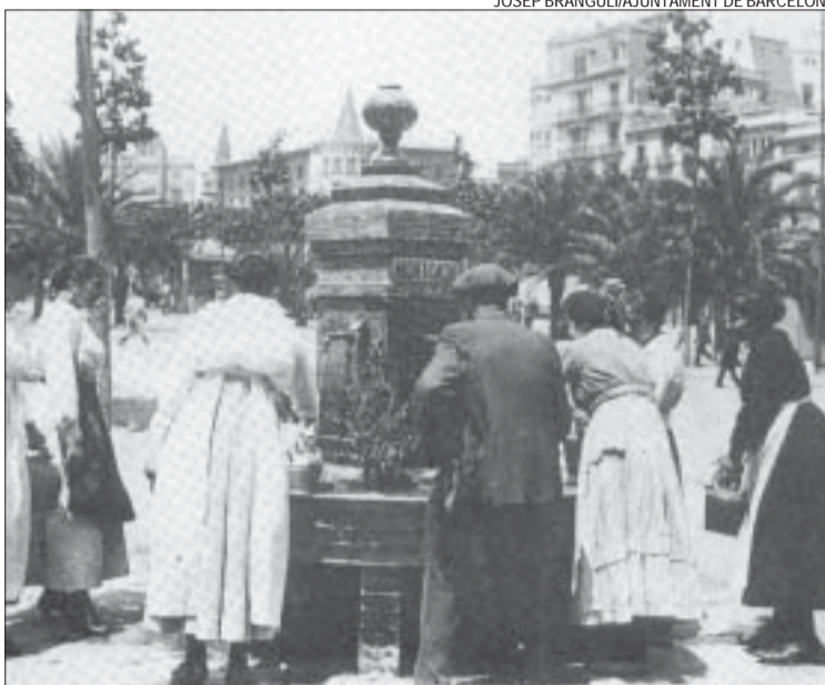
&gt;&gt; Font de la plaça de Catalunya d'on rajava aigua de Montcada (1912)