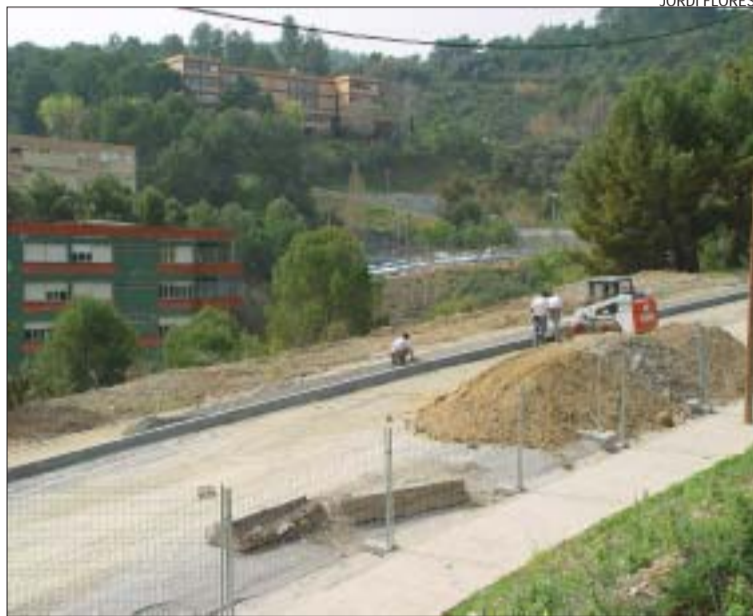
>> Les obres han començat a la zona del barranc de Ciutat Meridiana