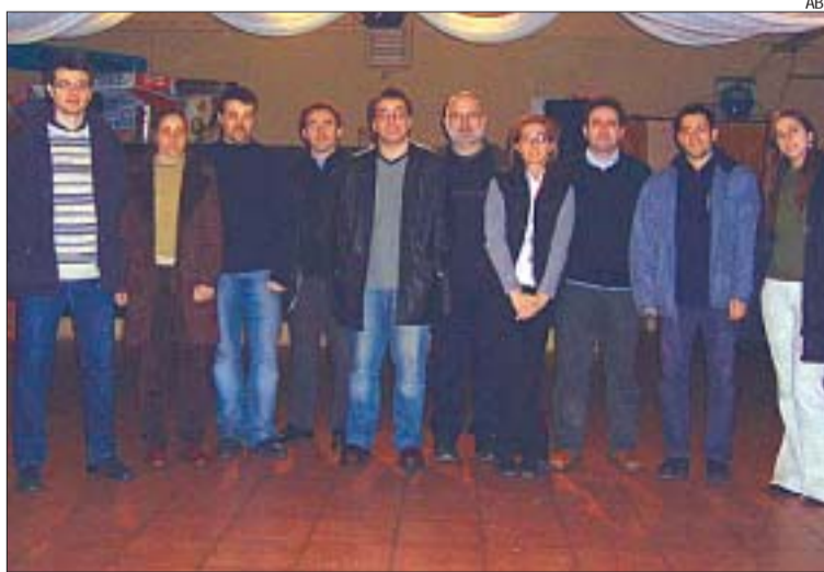
&gt;&gt; La nova junta directiva de l'ABI

altres que la dinamitzin i atraguin més públic; a modernitzar l'entitat i reforçar el seu pes a la localitat i la comarca. Algunes iniciatives promeses pel nou president de l'ABI són prou ambicioses, com impulsar la candidatura de Montcada a Capital Cultural Catalana coincidint amb el centenari de l'Ateneu l'any 2009 —un repte important— o impulsar la candidatura per aconseguir ser la seu del lliurament dels premis literaris de la nit de Santa Llúcia.