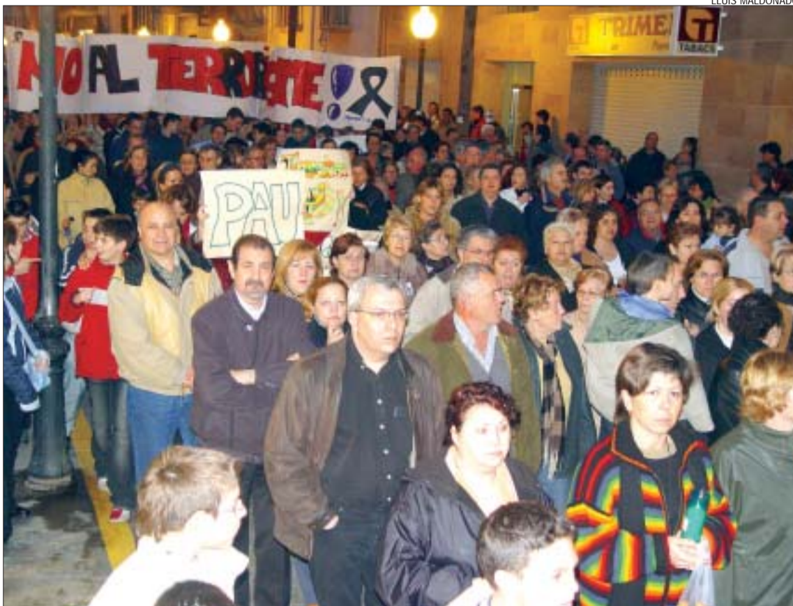
>> Manifestació multitudinària pel carrer Major, on es llegeix al final una pancarta en contra del terrorisme

'No a la guerra'. La Plataforma contra la guerra de Montcada fa una crida perquè la gent participi el dissabte 20 de març a la manifestació convocada a Barcelona coincidint amb el primer aniversari de la invasió de l'Iraq. El punt de concentració serà la confluència del passeig de Gràcia amb la Ronda de Sant Pere, a les 17h.