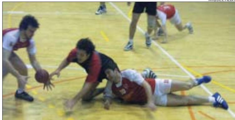
>> La Salle lluita per quedar al tercer lloc de Primera Catalana