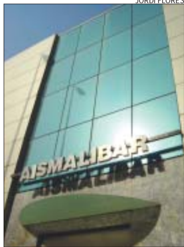
>> Vista exterior de l'empresa

Cada dimarts i cada dijous des de l'última setmana del mes de febrer, els treballadors d'Aismalibar fan dues hores de vaga per torn, en protesta per l'aturada de la negociació del conveni col·lectiu amb la direcció. Segons fonts del Comitè d'empresa, el principal escull rau en l'augment salarial. Mentre la proposta de la plantilla és una pujada global del 4%, l'empresa ofereix un increment variable i no consolidable. Fruit d'aquest desacord els treballadors van decidir iniciar un cicle d'aturades intermitents que estan disposats a mantenir fins que es desbloquegi la negociació. "Hem demanat permís per fer les vagues durant el març, però si convé, les repetirem també a