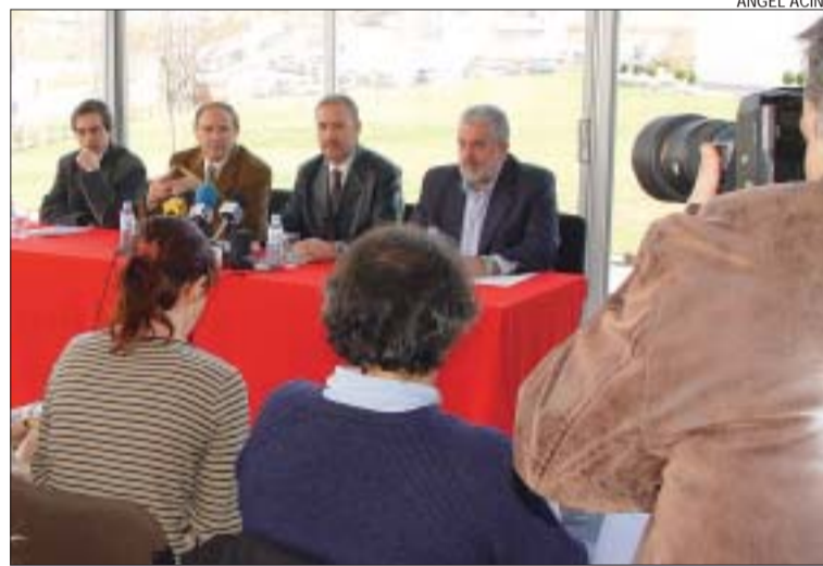
>> Roda de premsa dels alcaldes a l'edifici de Nodus Barberà

Resposta ràpida. Els quatre alcaldes esperen que al llarg del mes de març els ajuntaments de la comarca manifestin el seu posicionament que, posteriorment, serà transmès al govern de la Generalitat. En opinió dels edils, en el sí de la comarca hi ha diferents àrees d'influència, una la de Terrassa, altra la de Sabadell i la tercera, la que representen els seus municipis, l'anomenat Vallès Sud, però acceptar aquesta realitat no vol dir plan-tejar una possible disgregació.