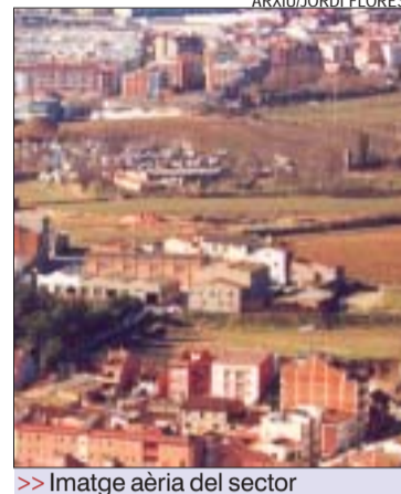
>> Imatge aèria del sector

Pisos de lloguer. Aquesta promoció pública d'habitatges s'emmarca en el Pla Parcial MC5, que preveu la construcció de 1.786 pisos i la urbanització de tot el sector. Una altra part