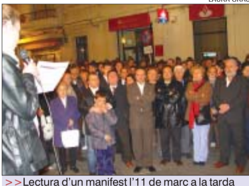
>> Lectura d'un manifest l'11 de març a la tarda