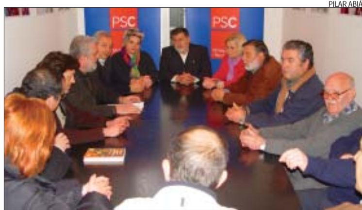
>> Imatges de la trobada entre les direccions locals del PSC, ICV i EUiA

rència política dels ecosocialistes. La formació també ha criticat les declaracions que va fer l'alcalde quan es va formalitzar el pacte dient que no es donaven