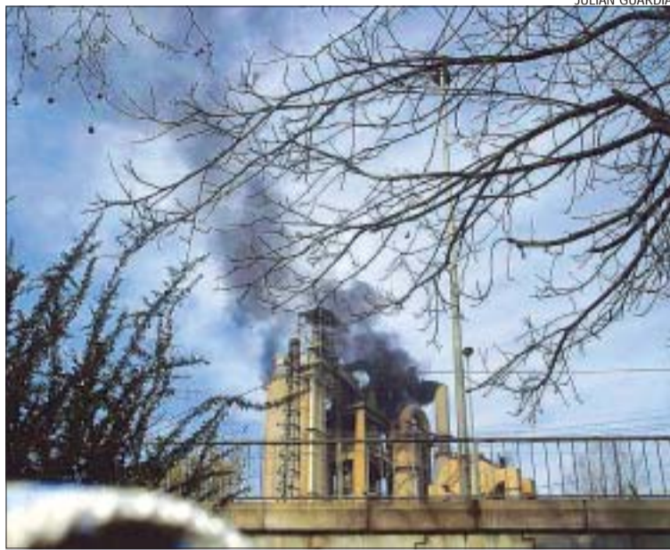
>> Aquesta imatge va ser presa el 9 de març des del Casal de la Mina

Forn fred. Fonts d'Asland han assenyalat que el fum va ser produït per l'arrencada del forn i el procés d'escalfament després