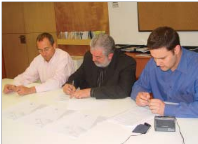
>> Els secretari comarcal d'UGT amb l'alcalde i Hierro, a la dreta

Hierro va justificar la continuació de la col·laboració amb UGT pel bon funcionament dels dos serveis, "amb uns resultats que han superat amb escreix les expectatives creades en un principi". El regidor va desta-