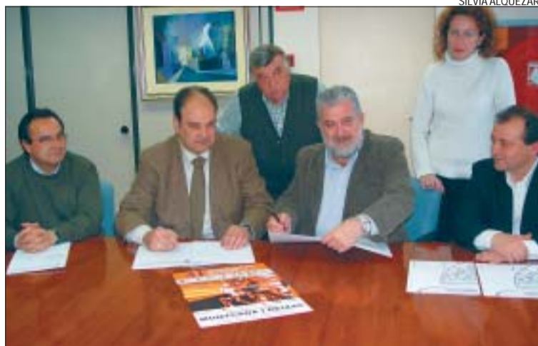
>> Sabaté i l'alcalde amb Poblet i altres autoritats signant el conveni

Etapa plana. Els corredors hauran de recórrer 159 quilòmetres d'un traçat pla amb l'Alt de Sant Bertomeu, a 410 metres d'alçada, com a punt més elevat. "És una oportunitat excepcio-