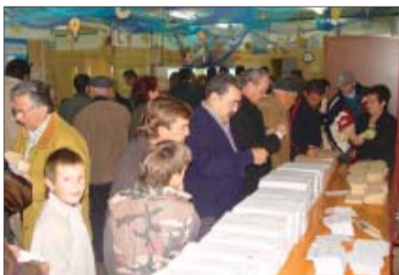
>> La normalitat va presidir tota la jornada