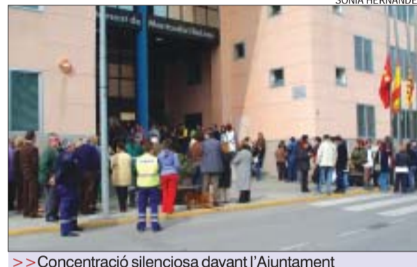
>> Concentració silenciosa davant l'Ajuntament