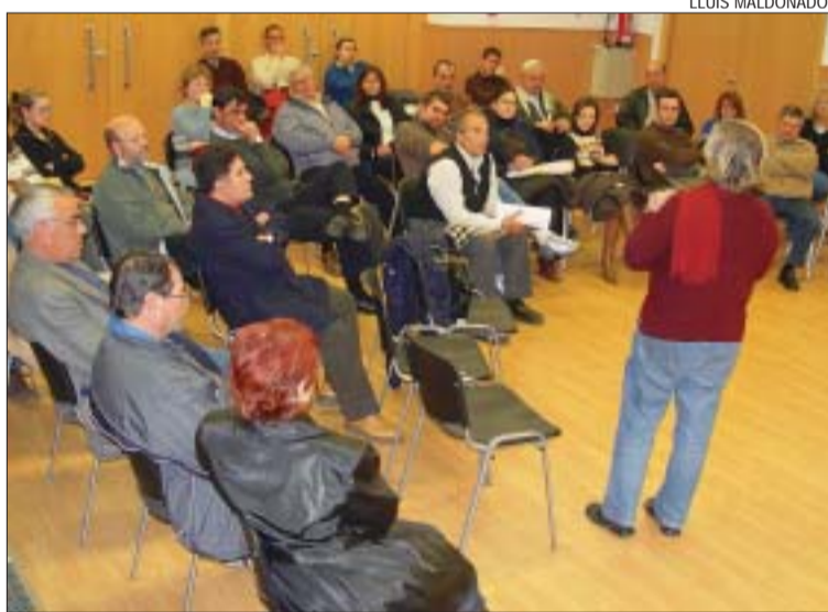
>> Més d'una trentena de veïns va assistir a la xerrada de Can Cuiàs

Fins a final de març es continuaran fent setmanalment les xerrades sobre fiscalitat i residus programades pel departament de Medi Ambient del consistori per informar els veïns sobre la implementació de la taxa de recollida d'escombraries. El cicle es va iniciar el 3 de març al centre cívic de Can Cuiàs, davant d'una trentena d'assistents. Aquesta ha estat fins ara la trobada amb més participació, ja que a les celebrades a Can Sant Joan i Mas Rampinyo n'ha estat molt minsa. Els tècnics municipals i els membres de l'Equip Verd volen conscienciar la població sobre la importància del control de les deixalles i el cost que això suposa des d'un punt