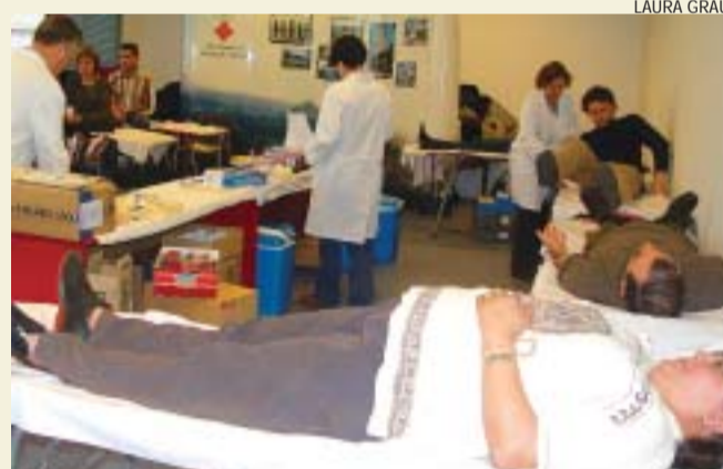
>> La sala institucional de la Casa de la Vila semblava un hospital

La solidaritat dels montcadencs cap a les víctimes de l'atemptat de Madrid es va veure reflectida el passat 11 de març en la gran quantitat de persones que van acudir a la Casa de la Vila per donar sang durant la jornada especial que va fer el Banc de Sang de l'Hospital de Sant Pau i l'Hospital Dos de maig, amb el suport de l'Ajuntament. En total es van rebre 303 donacions. Més de la meitat dels donants, 200, van donar sang per primer cop. La màxima afluència es va produir a la tarda, quan es van formar llargues cues d'espera. LG