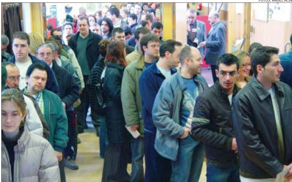
>> La participació a Montcada va ser molt activa durant tota la jornada. Cues a Can Cuiàs