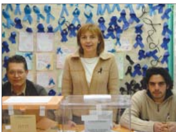
>> Llaços de dol a una de les taules del CEIP Reixac