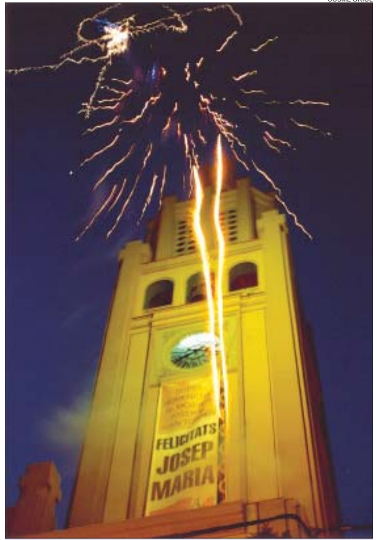
>> En sortir del Ple, focs artificials van il·luminar una gran pancarta

xement i afecte. Un dels moments més emotius va ser la descoberta d'un retrat del mossèn fet pel pintor montcadenc, Joan Capella.