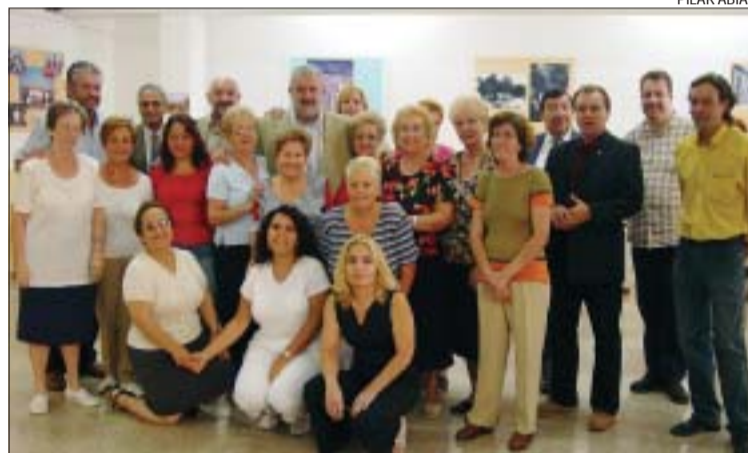
>> Part de la junta i les autoritats després del tall de la cinta inaugural

va convidar als veïns a visitar la seu i a prendre part en les activitats que a partir d'ara s'hi faran. L'AV disposa d'una àmplia sala, una altra de reunions i un despatx. La voluntat de l'entitat i de l'Ajuntament és dinamitzar l'espai oferint cursos culturals. L'alcalde va aprofitar la inauguració per anunciar la intenció del consistori de potenciar la plaça Roja: "L'any que ve volem condicionar l'espai per a un major aprofitament", va dir. També va agrair la col·laboració de l'empresa Vernissos Valentine que va sufragar la pintura del local veïnal.