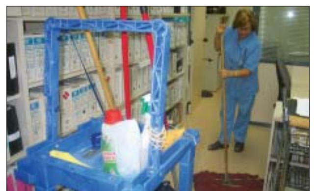
>> Nou persones netegen les dependències municipals