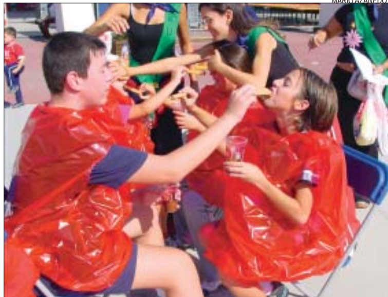
&gt;&gt; Les activitats infantils, imprescindibles en les celebracions veïnals