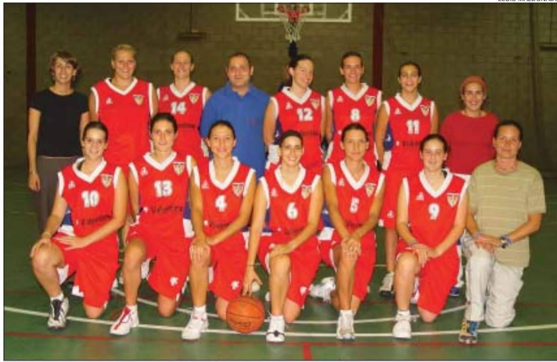
&gt;&gt; La nova plantilla només manté un bloc de sis jugadores de la temporada anterior