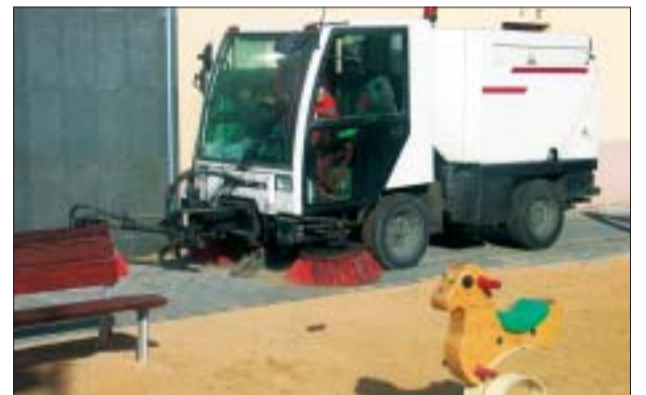
>> Serveis Municipals controla els 28 parcs infantils