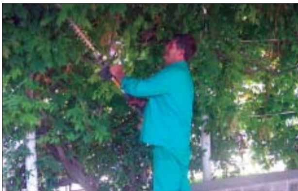
>> La poda d'arbrat no alt és una de les tasques del servei