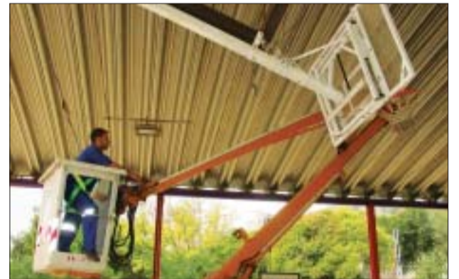
>> El camió grua ajuda al manteniment de les instal·lacions