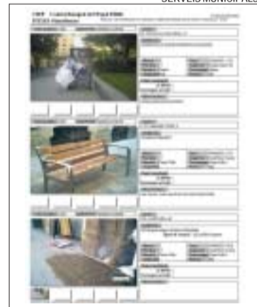
>> Informe emès des d'un PDA