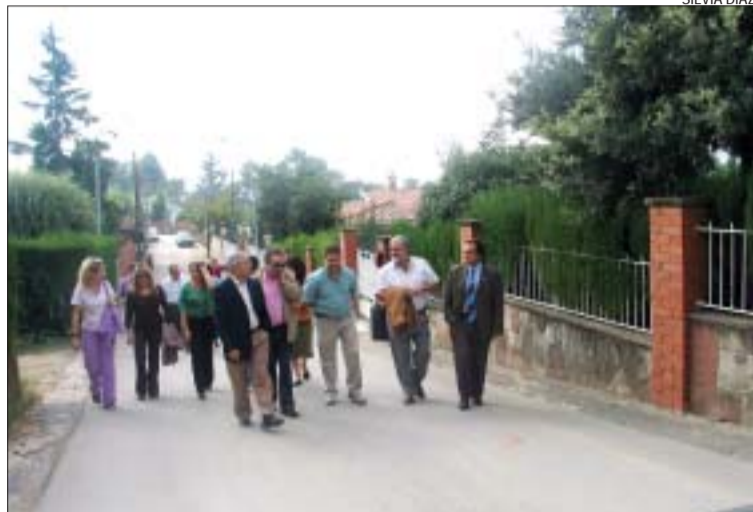
>> La delegació va ser rebuda pels representants de la comunitat

A la urbanització hi ha 60 parcel·les de les quals 40 estan edificades. Les famílies que hi resideixen, més d'una trentena, paguen els seus impostos a Montcada però, per qüestió de proximitat, aprofiten els serveis