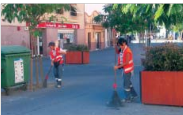
>> En el personal, hi ha tres netejadors de carrers