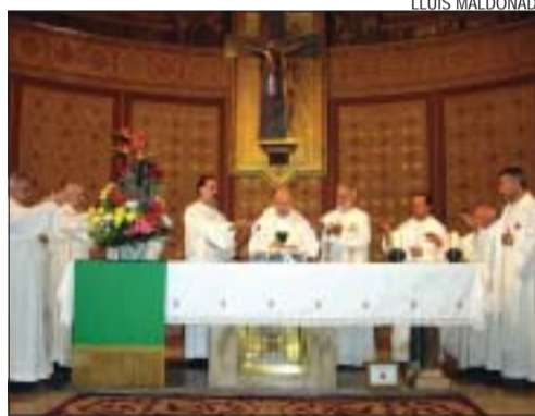
>> El mossèn fent l'Eucaristia de diumenge