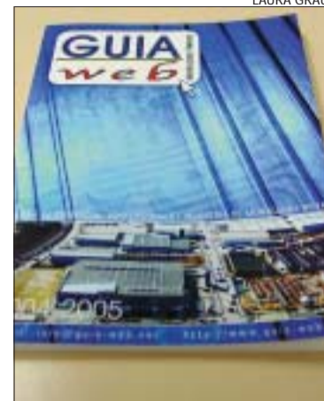
>> Portada de la Guia web 2004-5