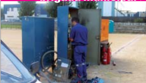
>> La brigada de tarda resol emergències