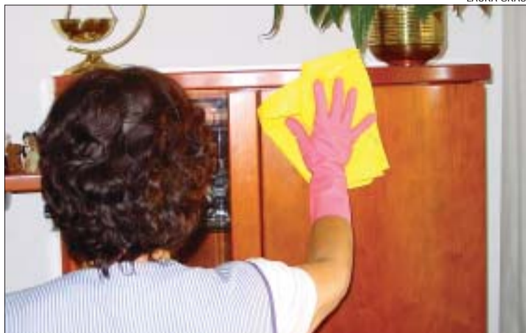
>> Els serveis de neteja de la llar i suport familiar són els més sol·licitats

Bona acceptació. Durant els primers 10 mesos de funcionament de la iniciativa, la major part de la demanda dels usuaris s'ha centrat en els àmbits d'assistència familiar per atendre persones grans i infants i fer tasques