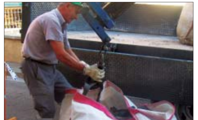
>> 12 persones treballen en les obres a la via pública