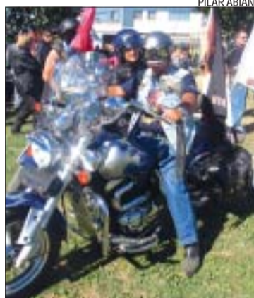
>> Autèntica estètica de biker