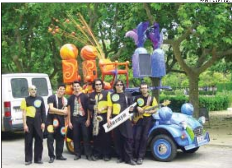
>> La formació montcadenc amb el cotxe protagonista de l'espectacle 'S'

La companyia també explicarà la història de la música a escoles de Barcelona