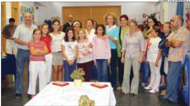
&gt;&gt; Les protagonistes de l'exposició amb representants municipals