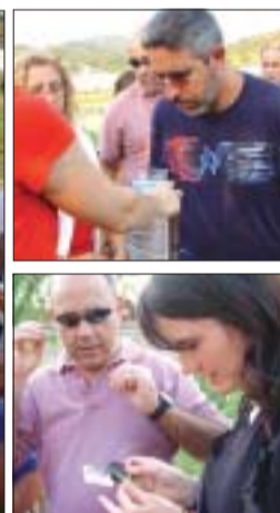
>> Anàlisi de l'aigua i de la vegetació de la llera