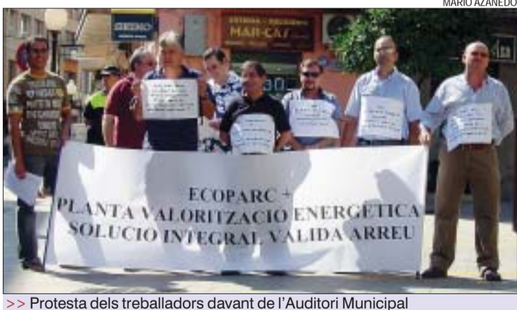
>> Protesta dels treballadors davant de l'Auditori Municipal

juntament amb el plantejament d'alternatives proposades per l'administració, com la construcció de l'Ecoparc, la recollida selectiva i l'educació ambiental, han fet possible la clausura definitiva del forn. Arrizabalaga va recordar que el municipi és "pioner en l'aplicació de polítiques mediambientals" en al·lusió a la recollida de brossa orgànica, pedagogia, divulgació i conscienciació, i va demanar el "compromís social per pensar propostes de futur" i que "tots els ajuntaments facin els deures en matèria de la recollida selectiva". Els portaveus dels col·lectius ecologistes Greenpeace, Depana i CEPA van coincidir a assenyalar que el tancament del forn és una batalla més guanyada en la lluita contra la incineració, tot i que van puntualitzar que aquesta no s'ha acabat. L'acte va cloure amb una performance teatral del grup montcadenc, Dèria Teatre.