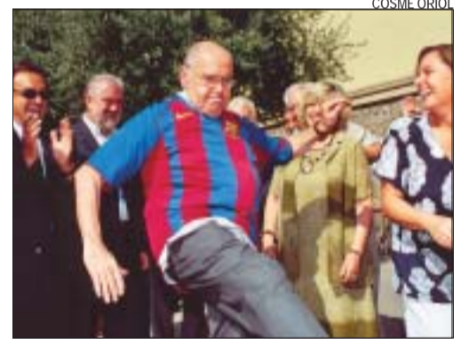
>> Xut de pilota amb la samarreta del Barça