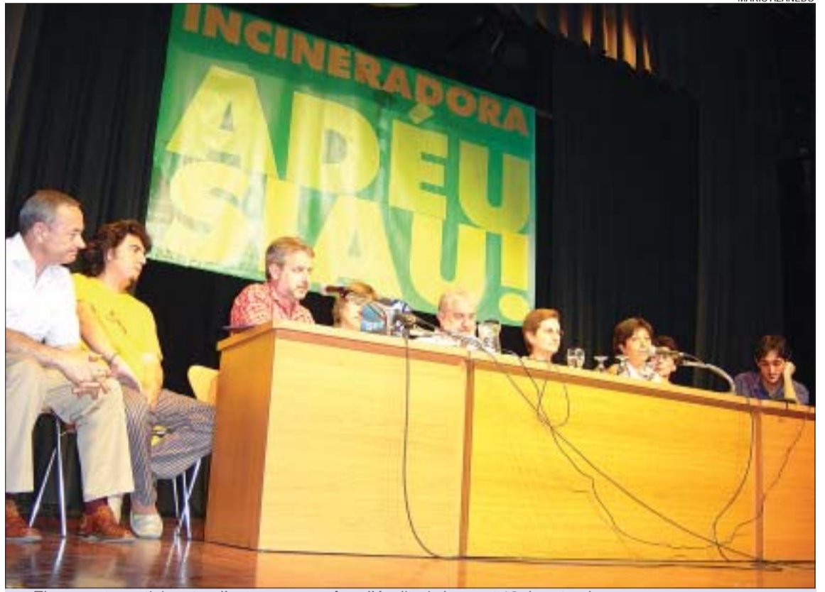
>> Els ponents participants a l'acte que es va fer a l'Auditori el passat 18 de setembre

fet a l'Auditori el passat 18 de setembre. Segons els empleats, la planta no està obsoleta i sempre ha funcionat correctament i ha complert amb les normatives mediambientals. Els treballadors asseguren que la mesura ha afectat negativament la plantilla amb prejubilacions, recollidors en altres llocs de treball de l'empresa TERSA i el comiat de 7 persones. El portaveu dels empleats, Alessandro Leota, defensa la incineració com un sistema eficaç i eficient per a l'eliminació dels residus i creu que s'ha manipulat l'opinió pública amb informacions falses amb l'objectiu de clausurar el forn. Leota considera que el tancament respon a un "interés polític i no pas social" i demana a la població que no vagi a la festa. Malgrat l'oposició dels treballadors, l'Ajuntament no renuncia a celebrar la clausura. L'alcalde, el socialista César Arrizabalaga, assegura que "el tancament no és fruit d'un caprici, sinó d'una planificació basada en la construcció de l'Ecoparc 2 com a alternativa al tractament dels residus". Arrizabalaga ha afegit que TERSA es va comprometre a recol·locar els treballadors de la planta i, segons les informacions de què disposa l'Ajuntament, s'ha negociat particularment amb cadascú d'ells el seu futur laboral. L'edil també ha demanat respecte per al poble de Montcada i Reixac que, en la seva opinió, "es mereix poder celebrar una festa que respon a molts anys de lluita".