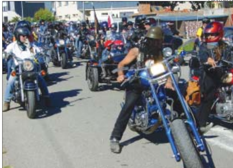
>> Desfilada de motoristes per la Ferreria a l'alçada del camp de futbol

Objecte de passió. La passió del biker per la seva màquina es percep de seguida. Només cal veure la transformació a què cadascú la sotmet per tal de donar-li la seva pròpia personalitat, de manera que es pot dir que al món no hi ha dues Harley Davidson iguals. També els motards cultiven la seva prò-