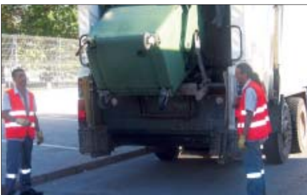
>> A l'octubre canvia l'empresa que recull les escombraries