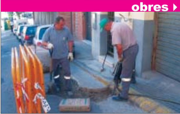
>> El treball de condicionament de carrers és diari