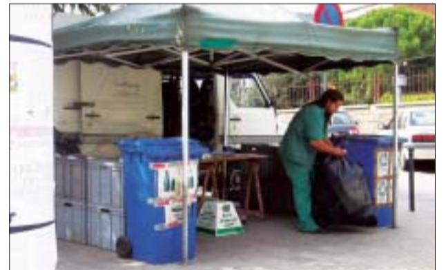
>> La minideixalleria circula per tots els barris