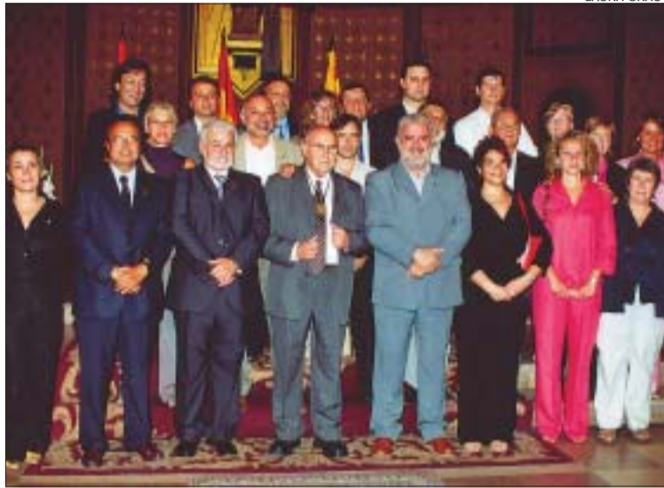
>> Els regidors i l'alcalde van posar al final del Ple amb l'homenatjat

Sopar de germanor. A la sortida de l'església, una sorpresa esperava al mossèn. La Colla de Diablers de Can Sant Joan va fer un castell de focs artificials mentre es desplegava una gran pancarta de felicitació a la torre de l'Església. Els assistents es