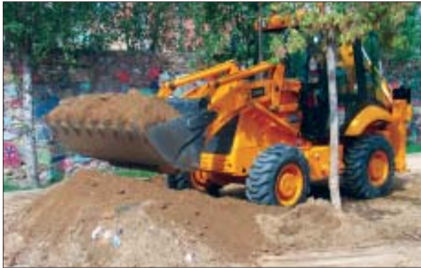
>> Montcada disposa d'una retroexcavadora