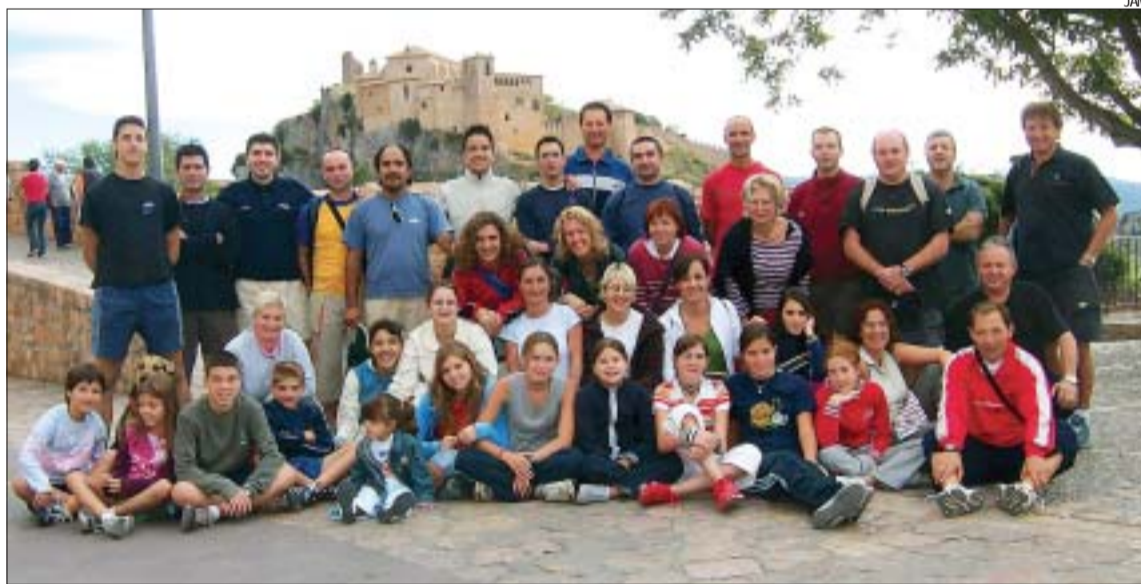
&gt;&gt; La delegació de la JAM que va viatjar a Alquézar, Osca, per participar a la Mitja Marató del Somontano