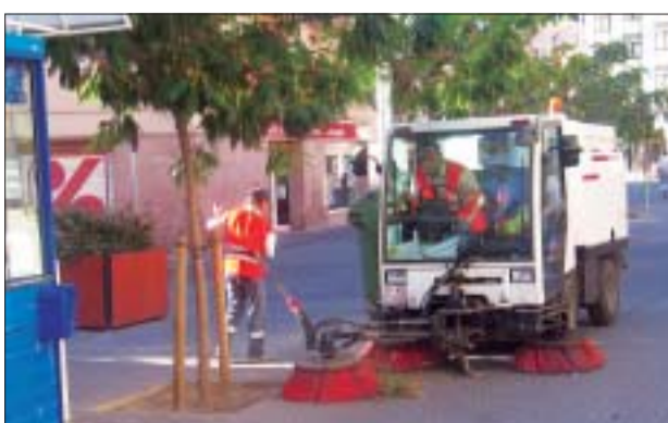
>> Montcada disposa d'una màquina escombradora