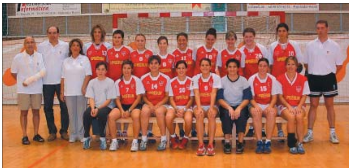
>> El sènior femení s'estrena a Primera Catalana amb un equip força equilibrat que intentarà estar a dalt