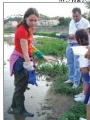
>> A la recerca d'invertebrats