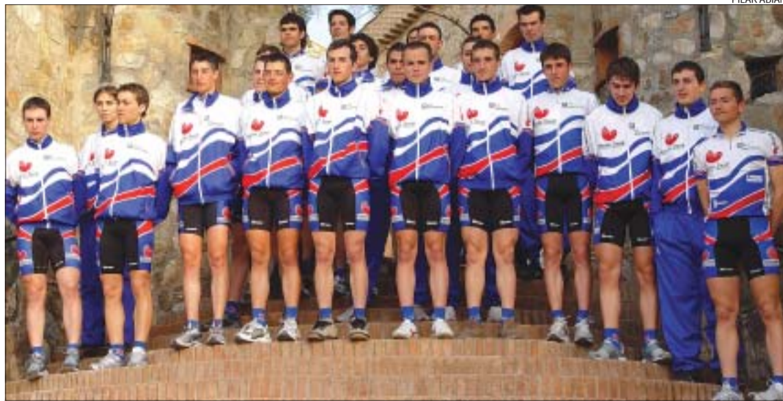
&gt;&gt; El Club Ciclista Montcada Saunier Duval està fent una bona temporada