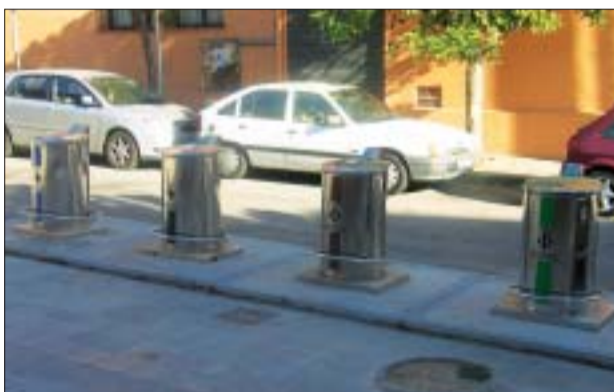
>> Els contenidors soterrats són una aposta de futur