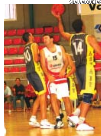
&gt;&gt; Pons lluita per una posició

El Valentine masculí transmet bones vibracions en l'inici de temporada. S'ha col·locat líder del Grup C després d'haver guanyat els dos partits que s'han disputat fins ara de la Lliga EBA, a la pista del Granollers (69-77) i a casa davant del Sant Josep de Badalona (90-61). El tècnic, César Saura, reconeix que la plantilla està fent una evolució ascendent: "Si som constants en defensa, podem assolir l'objectiu de la temporada -pujar a LEB 2- perquè tenim qualitat en atac" . Respecte a l'ascens, el president de l'entitat, Pere Oliva, veu factible pujar de categoria perquè "ja no suposa tanta despesa econòmica" . El pròxim rival del Valentine és S'Arenal de Mallorca, un equip amb un pressupost elevat, amb jugadors gairebé professionals, que és complicat de superar a casa seva. "Crec que perdrà pocs partits a la seva pista" , indica Saura. SA