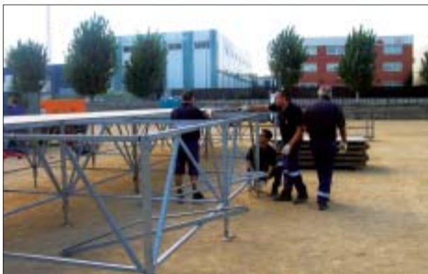
>> La brigada s'encarrega de la logística dels actes públics