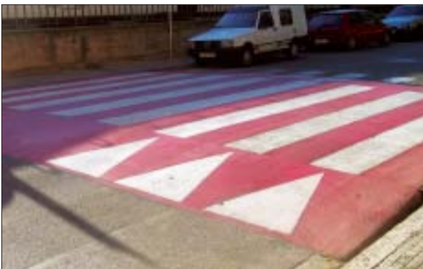
>> La construcció de passos elevats millora la mobilitat