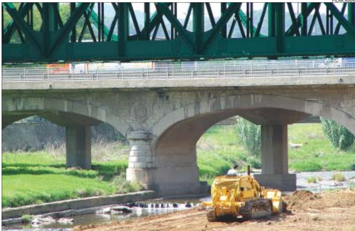
>> Neteja de la llera a l'alçada del pont de la C-17, a pocs metres de la riera de Sant Cugat