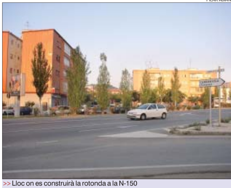
>> Lloc on es construirà la rotonda a la N-150