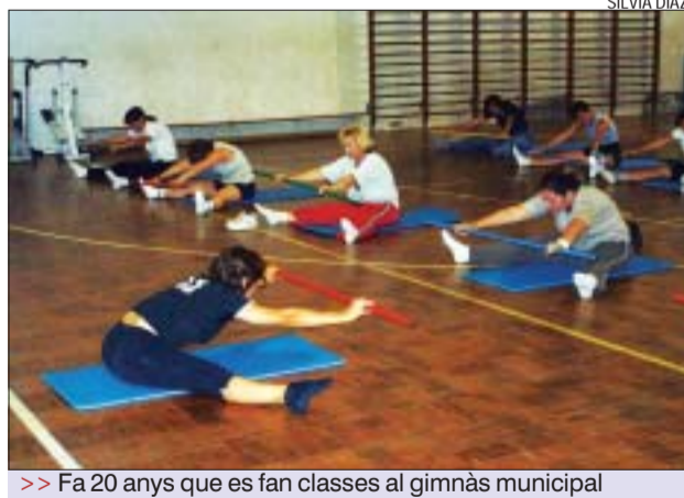
>> Fa 20 anys que es fan classes al gimnàs municipal

Gimnàstica. Les inscripcions als cursos de gimnàstica i aeròbic ja estan en marxa. Fa més de 20