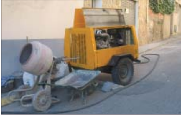
>> Serveis Municipals és responsable del manteniment viari