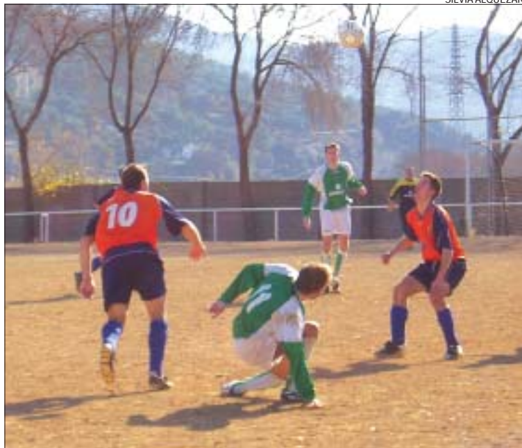
&gt;&gt; El CD Montcada va trencar la defensa del Roses a la segona part