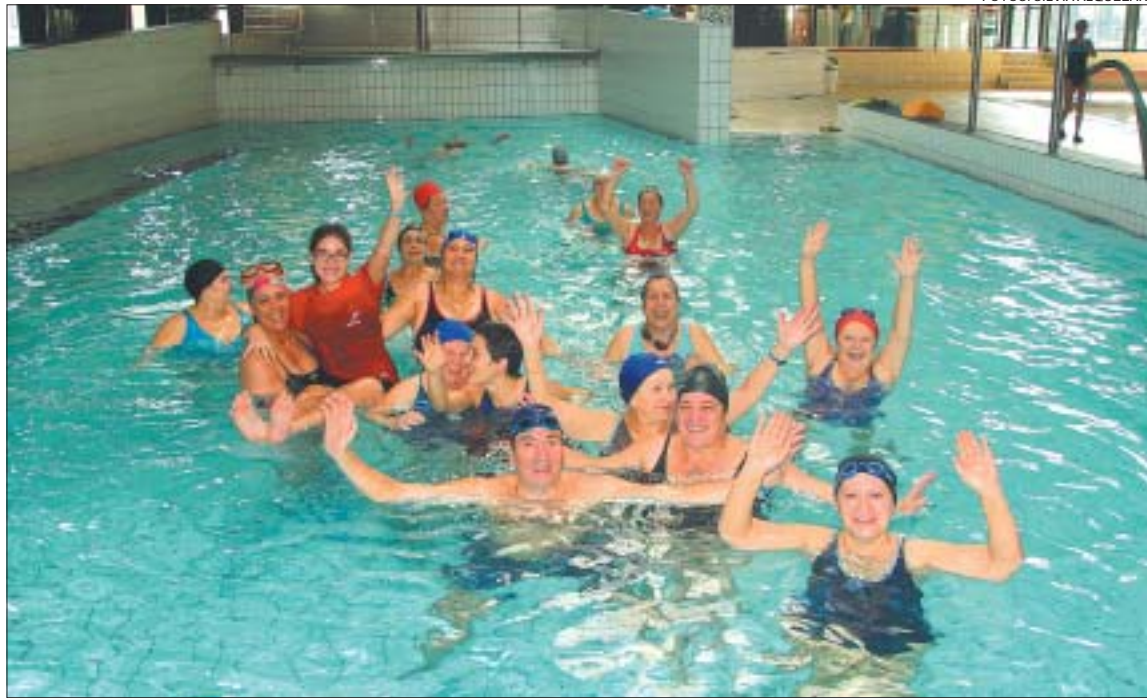
>> Els participants als cursos d'aquagim van celebrar el Nadal llençant les monitores a l'aigua

Millores. La instal·lació esportiva roman tancada del 20 al 27 de desembre a causa d'una aturada tècnica que permetrà fer diverses millores i solucionar algunes mancances d'obra. Les actuacions previstes consisteixen, entre d'altres, a eliminar les goteres, instal·lar un sistema per regular la temperatura de l'aigua de les dutxes, netejar a fons el terra dels vestidors i millorar els imbornals de les dutxes perquè no es formin bassals. També es revisarà el funcionament de la