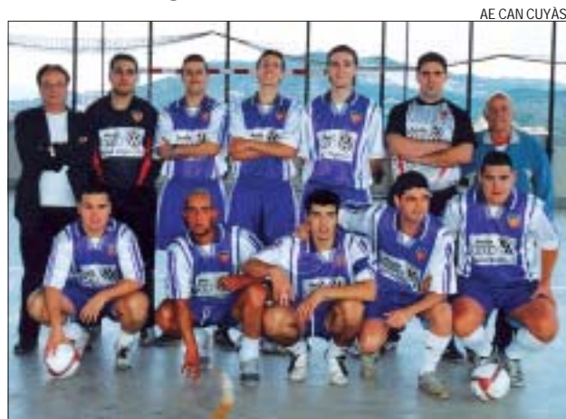
AE CAN CUYÀS

L'Associació Esportiva de Can Cuiàs ha iniciat una trajectòria imparabile a les últimes jornades que l'han portat fins a la segona posició del Grup Tercer de Segona A amb 25 punts. L'equip ha guanyat els tres darrers partits: davant l'Iniciativa de la Llagosta per 8-5, a la pista del Casp per 3-5 i a casa contra el Polinyà per 8-6. El Can Cuiàs inicia el 2005 amb moltes esperances d'aconseguir l'ascens. SA