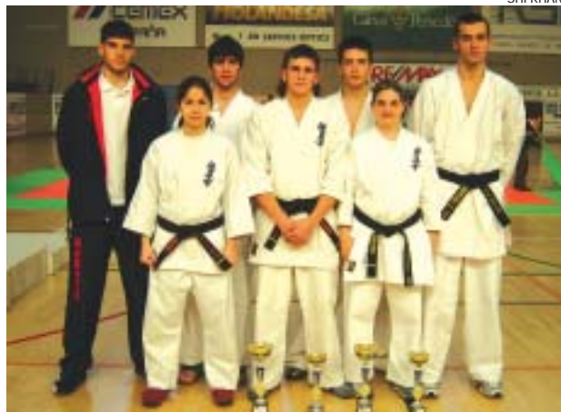
>> Els participants al Campionat de Catalunya de Vilanova