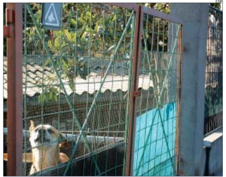
&gt;&gt;Els pipi-can compleixen totes les mesures sanitàries