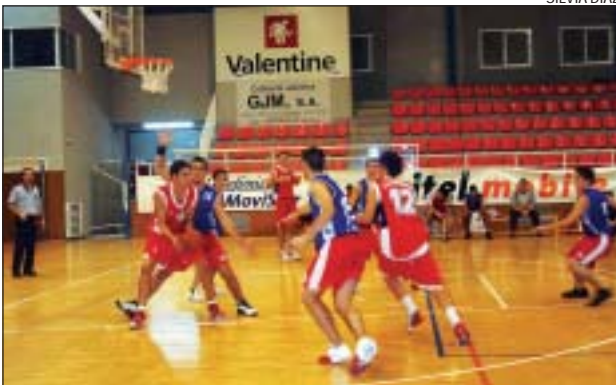
>> El júnior A del CB Montcada jugarà a preferent B