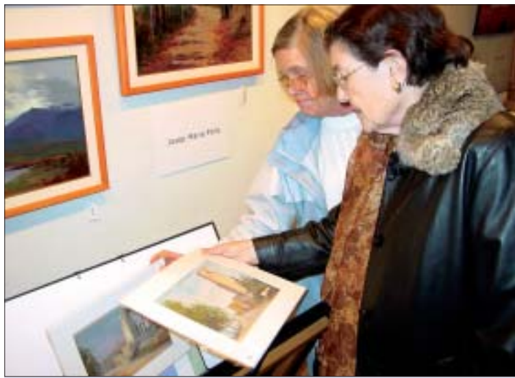
>> Visitants del mercat d'art "remenant" entre les carpetes de pintures.

creu que el calendari "és un clàssic, i el del 2005 està fet amb imatges de Montcada de pintors locals". La regidora de Cultura, Amèlia Morral (CiU), va destacar la rellevància del