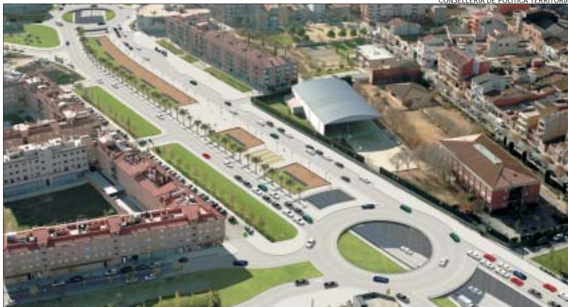
>> La Generalitat està estudiant tècnicament la petició de soterrar més metres feta pel consistori

El conseller de Política Territorial i Obres Públiques també ha recomanat a l'Ajuntament montcadenc que torni a presentar el projecte de recuperació de la Ribera a la segona convocatòria dels plans de reforma de barris de la Generalitat.