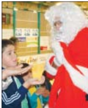
>> Visita del Pare Noèl