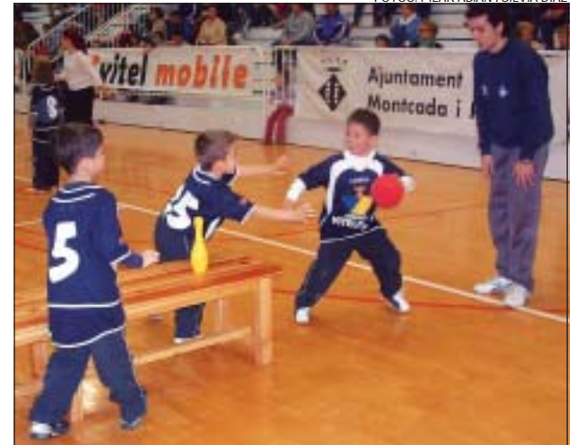
>> Els jocs van servir per introduir nocions d'handbol