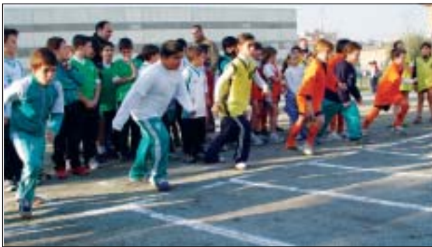
>> La JAM va organitzar proves atlètiques