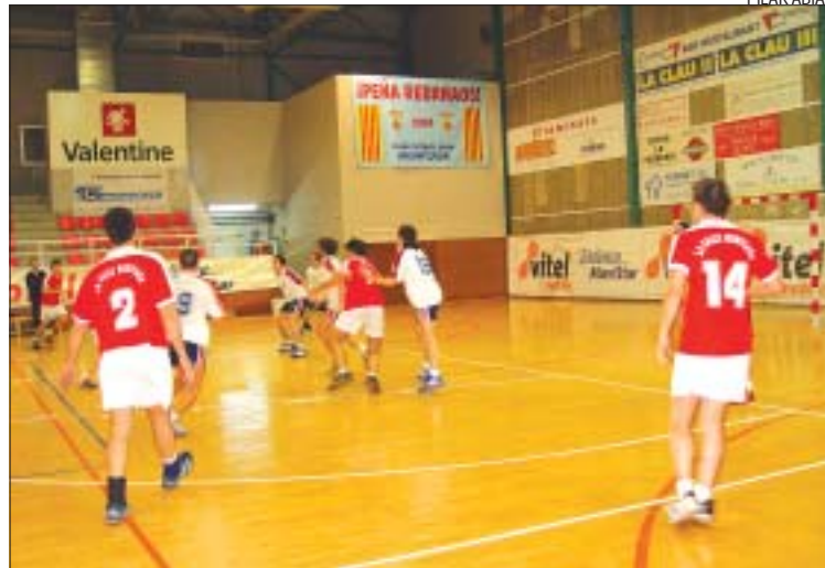
&gt;&gt; La Salle va fer un joc molt irregular contra el Sant Esteve Sesrovires