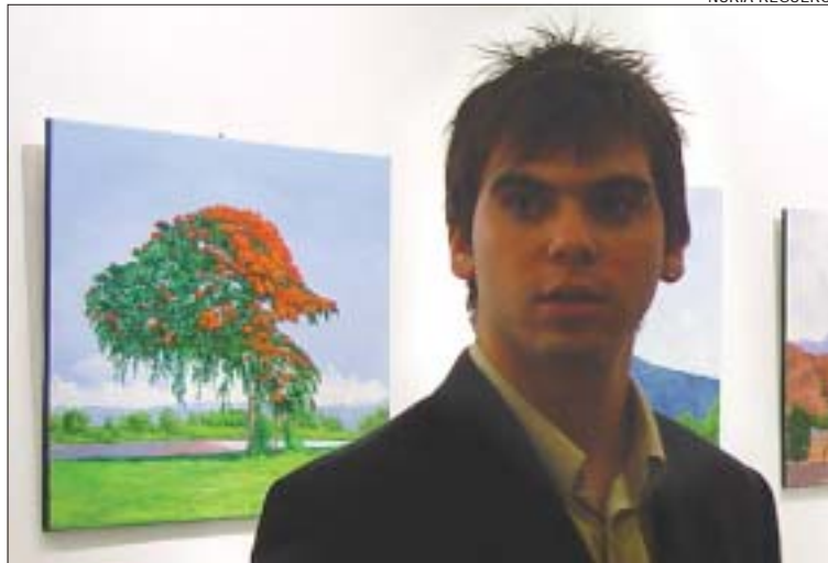
>> L'artista amb les seves obres, a la mostra