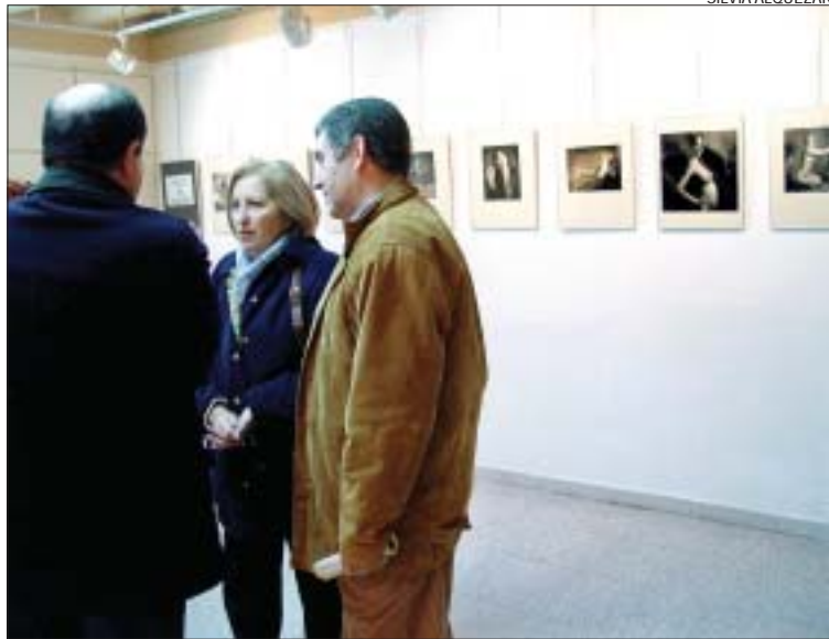
>> Un moment de la inauguració de la mostra a l'ABI