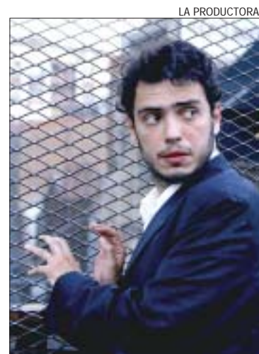
&gt;&gt; Un fotograma de la pel·lícula