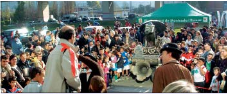
>> La companyia La Tal va recordar la manera antiga de fer fotografies