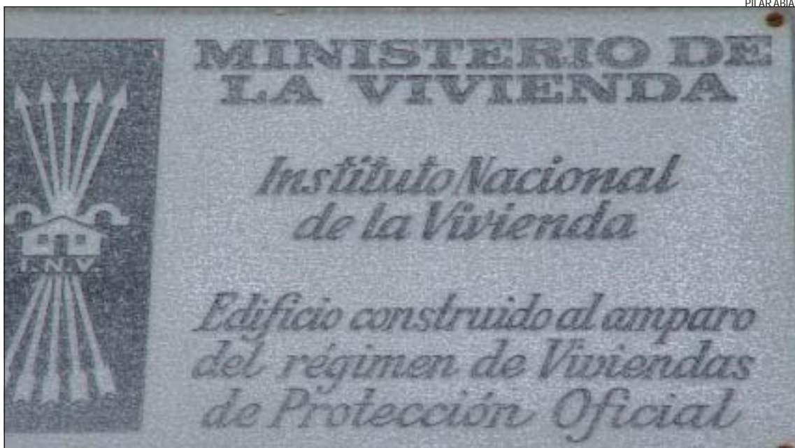
>> Un primer pla d'una de les plaques instal·lades encara a les façanes, que daten del franquisme

Les persones interessades a obtenir més informació es poden adreçar al Departament d'Habitatge de la Generalitat.