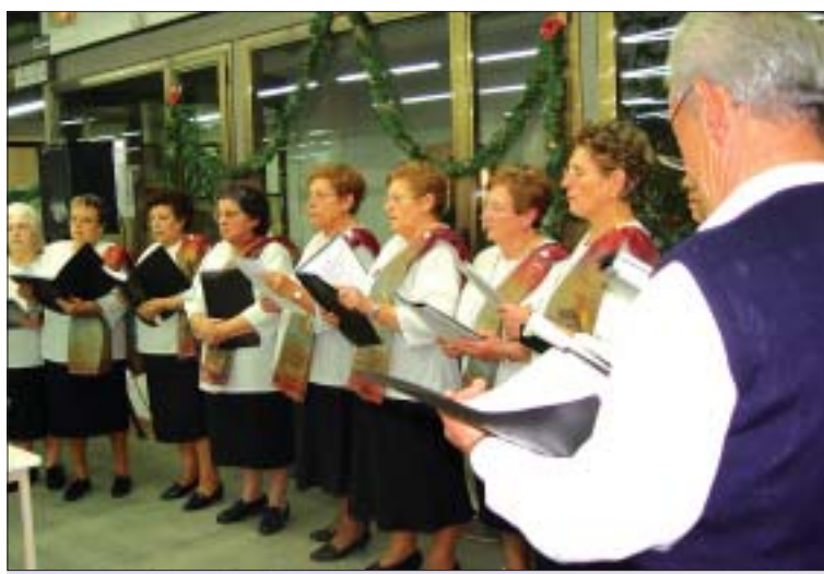
&gt;&gt; Actuació de la Coral del Casal d'Avis de la Mina