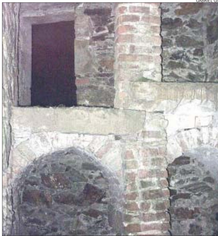
&gt;&gt; Un detall de l'equipament on es produïa el gel

Gel per als granissats. Els diferents pisos de gel se separaven amb una barreja de glaç picat, rama i palla. Després es tancava hermèticament el pou i s'esperaven les comandes. Per a la descàrrega de comandes es baixava al pou, i quan els trossos de gel ja eren nets es