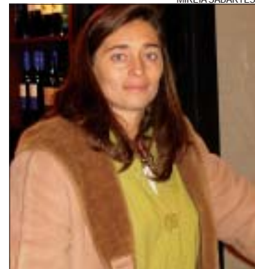
>> L'alpinista, a la porta de l'ABI

Sí, va ser al Shisha Pagma, entre el Nepal i la Xina, al 2001. Tota l'expedició érem dones, l'equip alpi i de suport al camp base. Això sí que era una novetat perquè els xerpes solen ser homes, normalment perquè és una feina molt buscada i cotitzada i les dones no hi ha accedeixen. En aquella expedició vam decidir que, ja que les alpinistes érem dones, totes ho podíem ser. Malauradament, vam tenir problemes amb els xerpes perquè eren molt joves i no tenien experiència. Per això a l'Everest vam agafar homes xerpes.