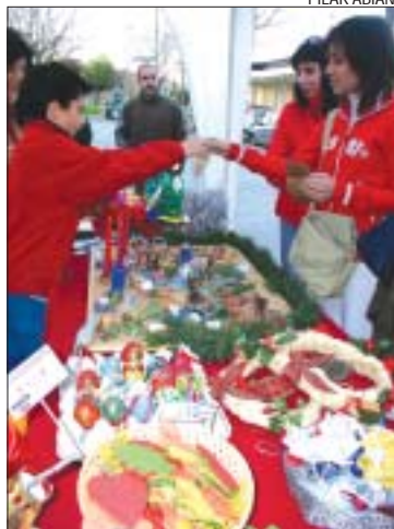
&gt;&gt; Parada del CEIP Mitja Costa

A banda dels comerciants, algunes entitats van muntar la parada, com el Centro Aguileño, l'Associació de Gent Gran, Adimir, els alumnes de quart curs d'ESO de l'IES Montserrat