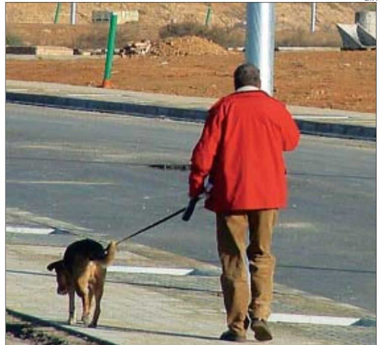
&gt;&gt;Tothom té dret a tenir un animal de companyia