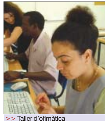
>> Taller d'ofimàtica

Els objectius proposats en un començament s'han complert amb escreix, ja que 52 persones han rebut informació i formació en noves tecnologies de la informació, idiomes, tècniques de recerca de feina, tastets d'oficis, etc, per inserir-se al mercat de treball de forma més qualitativa. Una altra de les accions realitzades al llarg del programa Equal ha estat l'assessorament i suport individualitzat als usuaris per facilitar l'acompanyament adaptat a les seves necessitats i l'acció conjunta entre diferents àrees municipals per atendre els