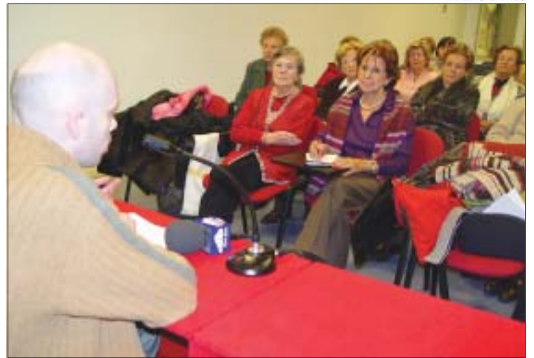
&gt;&gt; La conferència va ser a la Casa de la Vila el 24 de gener