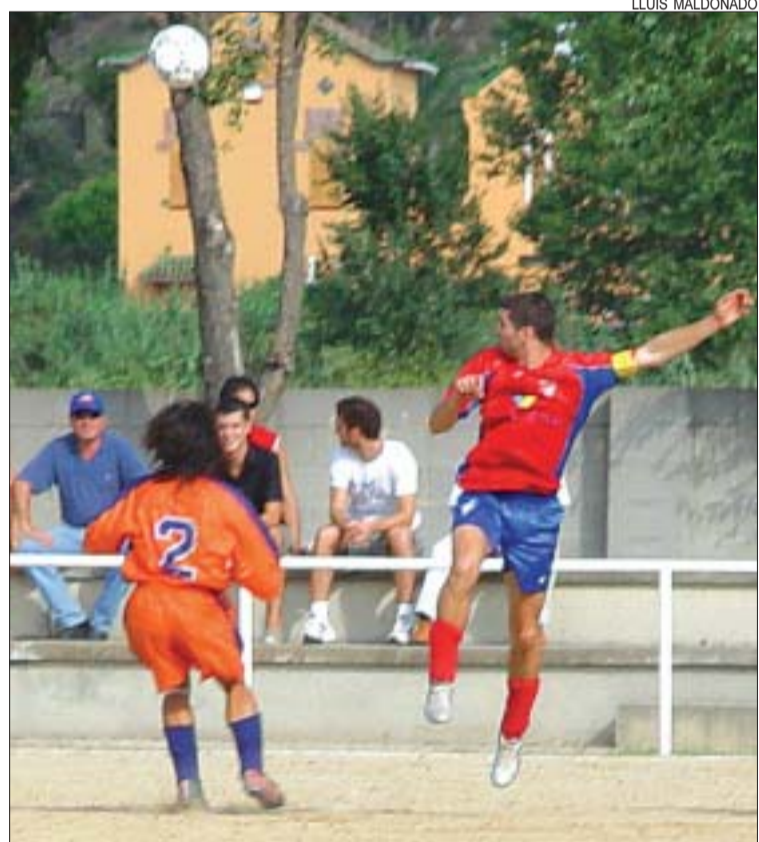
>> El Sant Joan va guanyar contra la Roca el primer matx del 2005