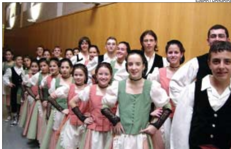
>> L'Esbart va estar a Cantonigrós l'estiu passat

Inici de la temporada. Durant la temporada, que comença