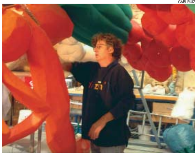
>> Mariscal amb elements del decorat

va tenir tant d'èxit que fa esperar la mateixa resposta per part dels veïns.