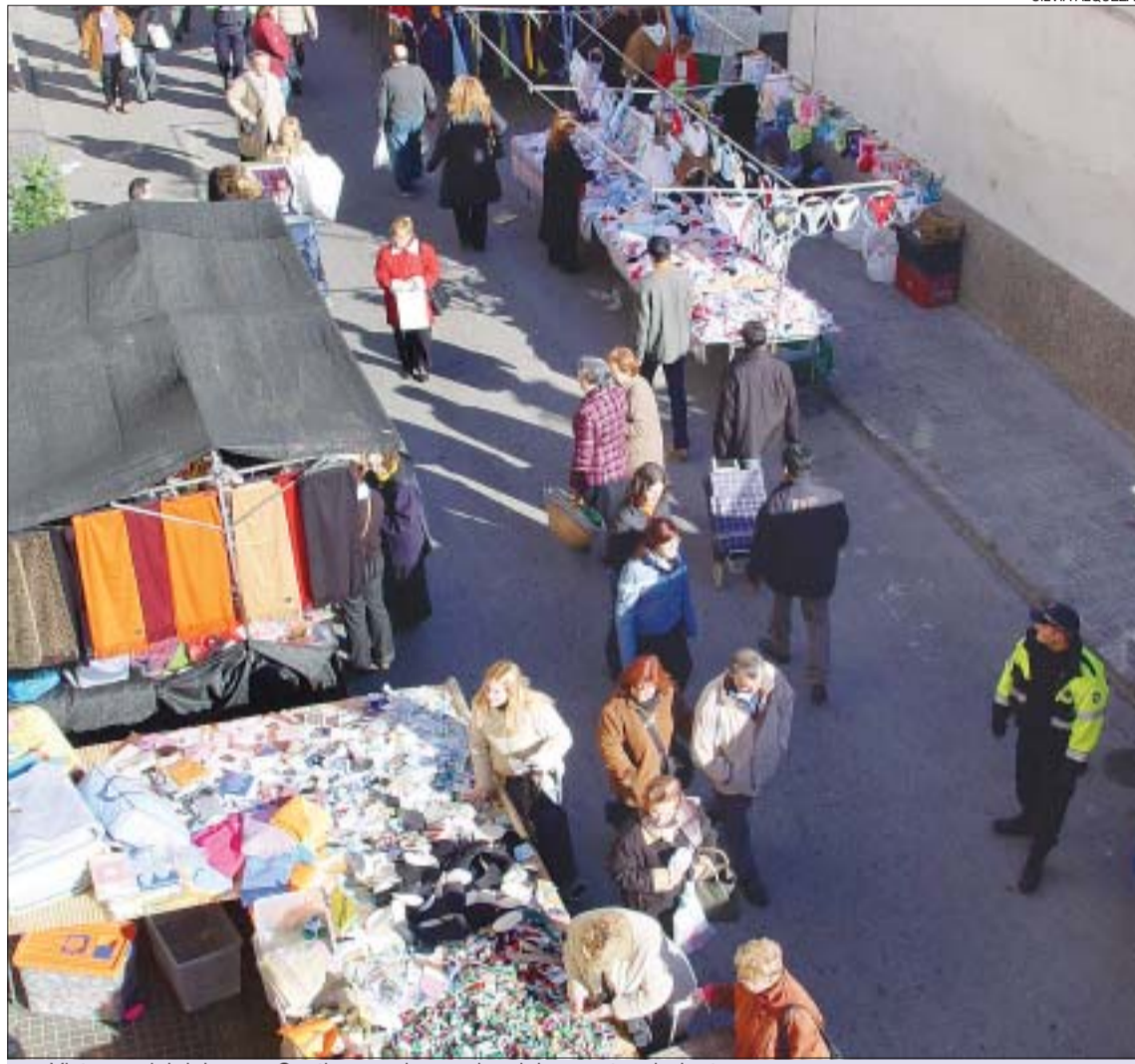
&gt;&gt; Vista parcial del carrer Santiago amb parades del mercat ambulant

Propostes. Segons ha dit l'alcalde, el consistori és conscient de la situació estratègica del mercat ambulant i de la importància econòmica que té per als comerços que l'envolten i, per això, intentarà que aquest es mantingui proper a la zona on actualment s'ubica. No obstant això, Arrizabalaga reconeix que el principal handicap són les dificultats tècniques existents per trobar un espai adequat en el centre del nucli urbà. "Actualment tenim seriosos problemes de seguretat i d'evacuació en cas d'emergència" , ha dit l'edil, que s'ha mostrat disposat a escoltar les propostes alternatives que facin els comerciants. De moment, el govern no vol avançar si el trasllat de les parades —en total, prop de 160— serà provisional o definitiu, i prefereix pronunciar-se un cop hagi debatut la qüestió amb tots els col·lectius afectats ja que les converses que ha mantingut fins al moment han estat amb l'associació de comerciants Montcada Centre Llevant, però no amb els paradistes del Mercat Municipal ni amb els botiguers