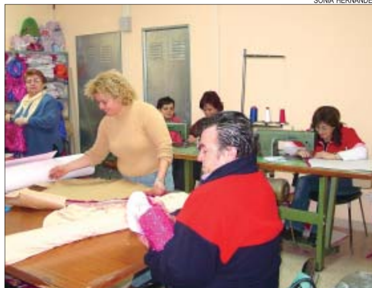
>> L'AV de la Ribera prepara els seus vestits des del mes de novembre

Carnaval a Can Cuiàs. D'altra banda, el 4 de febrer, a partir de les 18h, Can Cuiàs també farà la seva Rua de Carnaval pel barri. Després de la desfilada, serà el torn de la música i la disbauxa amb un espectacle d'animació, després del qual es durà a terme el lliurament de