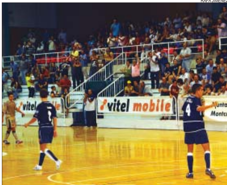
&gt;&gt; El Vitel és l'únic equip que ha guanyat aquesta temporada el Barça

Matx a casa. El primer partit del 2005 que el Vitel jugarà al pavelló municipal Miquel Poblet serà el pròxim 3 de febrer a les 21.15h. El matx s'ha avançat al dijous perquè el dia 5 l'equipament del Pla d'en Coll no estarà disponible amb motiu de la celebració del Carnaval a la ciutat. El partit serà transmès per Montcada Ràdio.