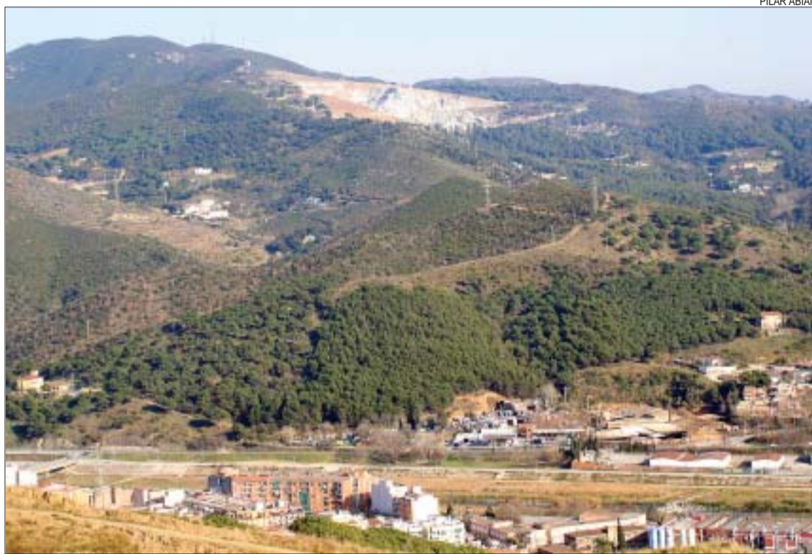
>> En aquesta imatge s'aprecia l'impacte que té la pedrera vista des de Montcada i Reixac

Procés iniciat. L'activitat de la pedrera es va iniciar l'any 1949 i fins a l'actualitat s'hi han extret més de 4,5 milions de metres cúbics de terra, pedres i sorra. Tot i que l'exploració va finalitzar el 31 de desembre, fa temps que l'empresa i l'Ajuntament de Badalona van començar a negociar quan acabaria l'extracció i com es recuperaria el sector. Fruit d'aquestes converses, l'any 1998 ambdues parts van signar un acord amb Gestora Metropolitana de Runes SA (GMR) perquè l'espai esdevingués un dipòsit controlat de runes. Segons fonts de GMR, al 2001 es va iniciar la primera fase de la restauració al vessant oest de la pedrera, justament el que correspon a Montcada, actuació que va acabar un any més tard. Durant el 2003 els treballs van continuar amb l'abocament de 360.000 m 3 de terres i runes de construcció en el perímetre de la pedrera on no es feia directament l'exploració. Els treballs