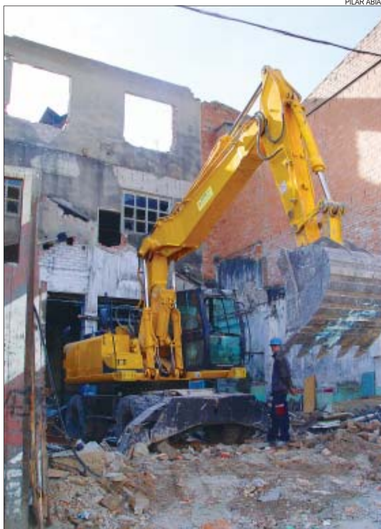
>> Les obres d'enderroc han durat una setmana

El procés de construcció s'iniciarà en breu, tot i que el calendari està marcat pel procediment legal a seguir: "Les passes s'han de fer d'acord amb la tramitació" , explica el president de l'Àrea Territorial, Alfonso Romo (PSC), "un cop adjudicades les obres, la constructora tindrà entre 14 i 18 mesos per fer l'edificació" . Aquesta és la primera promoció d'habitatges protegits que projecta l'MSM. Els pisos es vendran amb plaça d'aparcament i al preu que marca el Pla d'Habitatge de la Generalitat i que