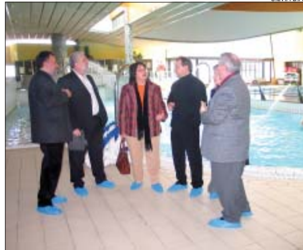
&gt;&gt; Visita a la zona de banys de Montcada Aqua