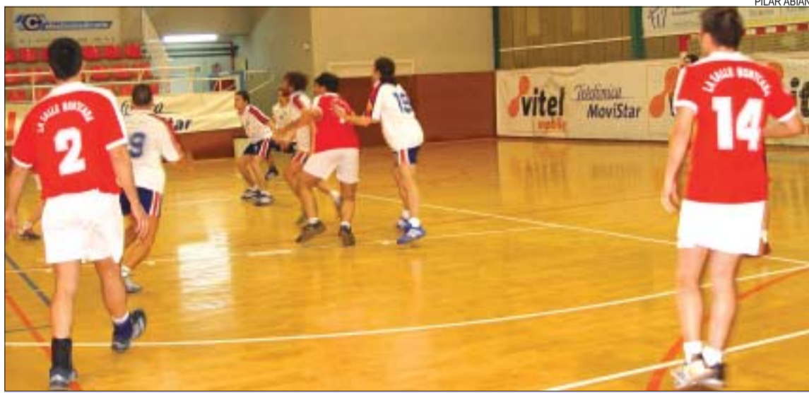
&gt;&gt; La Salle ha acabat la primera volta a la setena posició de Primera Catalana