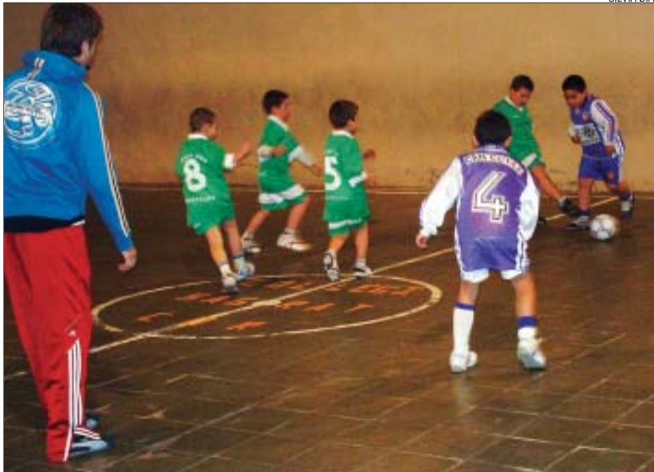
&gt;&gt; L'AE Can Cuiàs, guanyador del grup 1, va jugar l'última jornada al camp del Sagrat Cor

Per a molts infants, el multiesport és el primer contacte que tenen amb un esport. De fet, la majoria dels nens són de primer any. Una de les fites més importants d'aquesta lliga ha estat que tots els centres escolars han pogut formar,