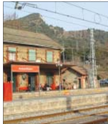
>> Estació de Bifurcació