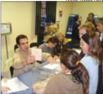
>> La votació es farà el dia 20