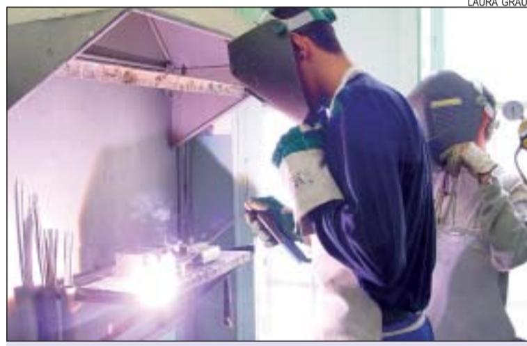
>> El curs de soldadura és un dels que es fa anualment

Aquests cursos estan subvencionats pel Servei d'Ocupació de Catalunya i el Fons Social Europeu, amb quasi 75.000 euros. L'SPE va presentar una oferta formativa incrementada respecte a l'any 2003. L'acte d'entrega dels diplomes a un total de 27 alumnes dels cursos de formació professional ocupacional de soldador d'estructures metàl·liques lleugeres i de monitors socioculturals es farà el 28 de gener a la Casa de la Vila (19h). Està previst que l'alcalde i el regidor de Promoció Econòmica assisteixin al lliurament de diplomes.