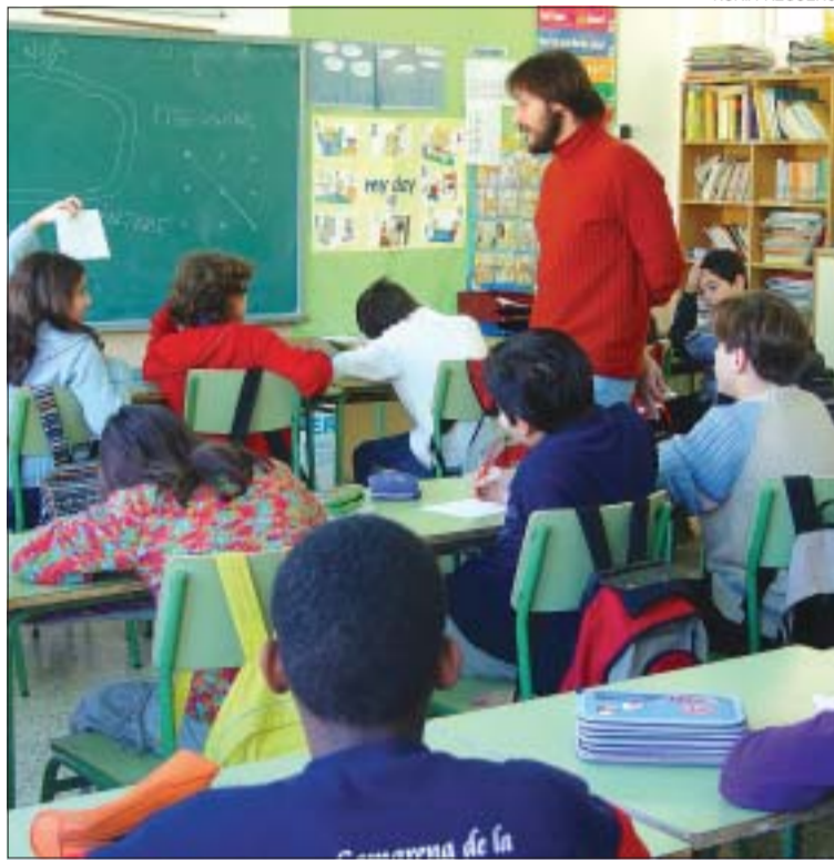
>> Els infants del Turó, durant el taller de mediació

Entendre a l'altre. A la segona sessió, els alumnes es familiaritzen amb les eines per comprendre les emocions i sentiments dels altres per poder identificar-s'hi i arribar a una entesa. Veure en un cas pràctic com canvien les notícies al passar de boca a orelles, o com és de fàcil caure en l'error dels prejudicis són alguns dels mètodes emprats per entendre qualsevol malentès i relativitzar els problemes i les tensions de la vida diària de qualsevol persona, fins i tot d'un infant. Els tallers van començar al novembre i han finalitzat al gener i hi han participat alumnes de La Salle, El Viver i El Turó. Aquests darrers els van concloure el 19 de gener i van