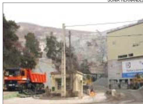
>> Entrada a la instal·lació de la pedrera

L'Ajuntament de Montcada i Reixac, tot i no participar directament en el projecte de restauració, ha valorat positivament l'actuació prevista a la pedrera de Vallençana per les implicacions que té en el municipi. "A més de recuperar el paisatge i acabar amb l'impacte visual que té l'exploració, també ens beneficiem des d'un punt de vista circulatori, ja que disminuirà el trànsit de vehicles pesants per la carretera de Vallençana", ha dit el president de l'Àrea Territorial, Alfonso Romo (PSC). El projecte, pressupostat en 1,8 milions d'euros, se sufragarà mitjançant els