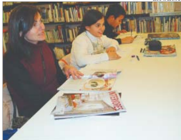
>> La biblioteca del carrer Montiu va rebre més de 24.000 visites al 2004

Al 2004 les biblioteques també han estat notícia en saber-se el compromís municipal a mantenir oberts aquests equipaments una vegada s'inauguri la biblioteca projectada al complex lúdico-esportiu del Pla d'en Coll.