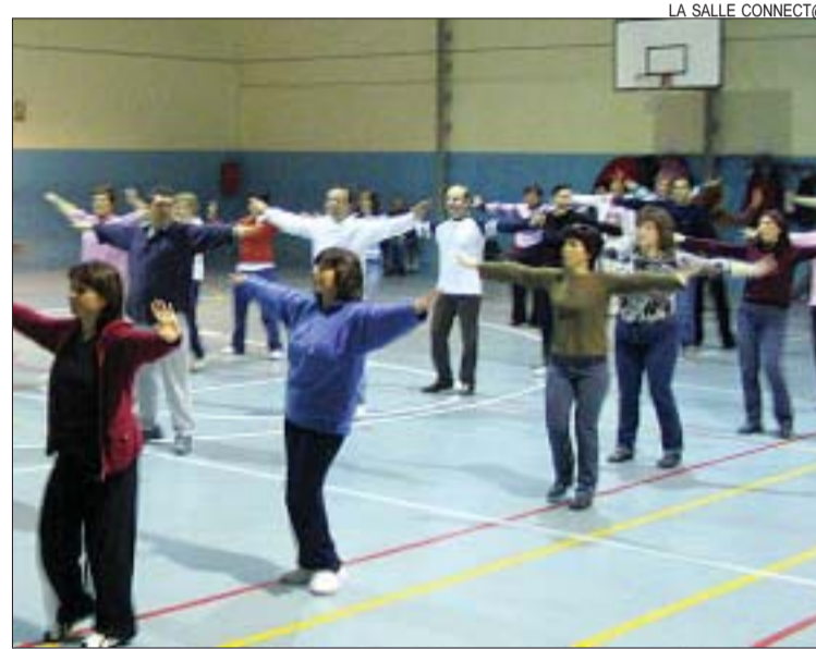
>> El col·lectiu La Salle Connect@ assaja els diumenges la coreografia

premis del concurs de disfresses i dels obsequis per als participants. El concurs de l'any passat