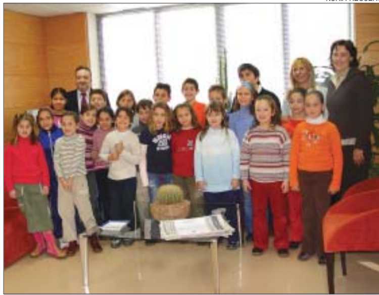
>> Nens del Sagrat Cor de visita al consistori