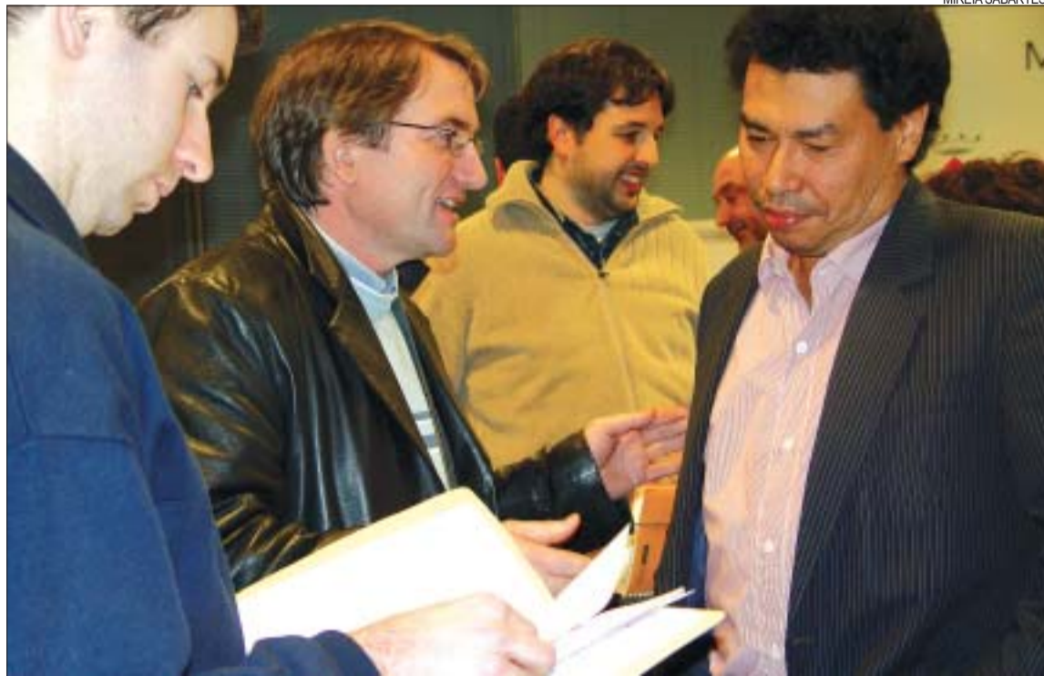
>> Després de la reunió, els representants d'entitats van seguir parlant sobre la campanya solidària

Entitats solidàries. Van participar en la trobada: persones a títol individual i representants de les entitats Tazumal Catalunya-El Salvador, Creu Roja Montcada-Cerdanyola-Ripollet, Càrites, les seccions locals de l'Associació Catalana d'Amics al Poble Sahrauí (ACAPS) i de Setem, Taarof bi Salam, el Comitè de Solidaritat de Montcada, La Unió de Mas Rampinyo i Andròmines. Aquest front comú ja va donar fruits amb els desastres provo-