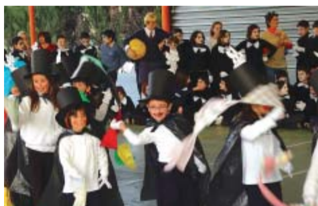
☺ CEIP Elvira Cuyàs