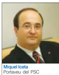
Miquel Iceta Portaveu del PSC

Votarem sí a la Constitució europea perquè som Europa. En el segle XXI, Europa és la millor garantia de pau, progrés i justícia social. El 90% de la inversió estrangera que rebem prové de països de la Unió Europea, que són el destí del 74% de les nostres exportacions, i dels que prové el 87% dels turistes que ens visiten. Europa ens ha anat bé. Ara hem de fer un pas endavant, votant sí a la Constitució, per garantir el benestar de tothom en l'economia