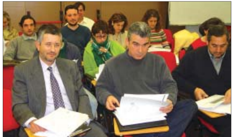
>> El curs compta amb una vintena de participants