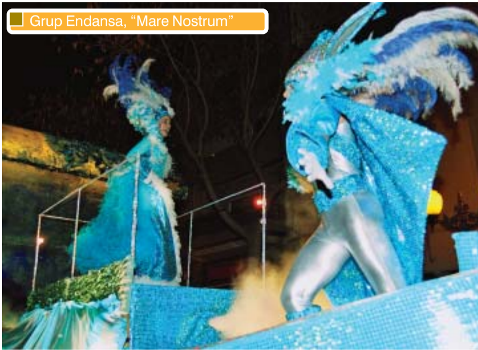
Grup Endansa, "Mare Nostrum"

satisfet en una Rua màgica, i a més, sense premis. Els que van sumar premis als Carnavals importants van ser el grup Endansa, que va guanyar a la gran la Rua de Barcelona, i el gimnàs Jym's, que ho va fer a la de Sabadell.