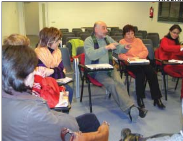
>> La darrera reunió d'entitats i Ajuntament va tenir lloc el 28 de gener

Tot i que encara queden algunes qüestions per perfilar, l'Ajuntament demanarà donacions als comerciants. Qualsevol obsequi serà benvingut. I també es farà un mosaic, un tapís que seria semblant al que des de fa 2 anys s'organitza al municipi en me-