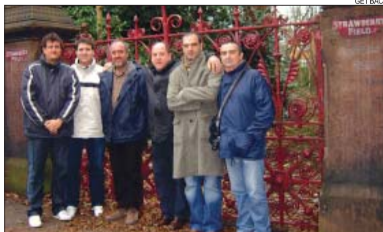
&gt;&gt; L'equip de Get Back en un dels llocs mítics del Beatles

no, el museu dedicat a la banda, ubicat a l'Albert Dock. Després també va haver-hi temps per fer una pinta de cervesa com a comiat a The Jacaranda. Gràcies a la col·laboració de Montcada Radio, l'equip va poder accedir a racons importants a la història dels Beatles, fora de l'abast del turista habitual d'aquesta ciutat, com són el soterranis del pub The Jacaranda, on van tocar per primera vegada, un lloc amb una atmosfera ideal per gaudir de la bona música; als interiors de la casa d'en Ringo Starr on els va atendre la seva propietària actual, una dona de 80 anys que els va acollir amb una amabilitat inusual segons els visitants; i al museu dels Beatles on varen poder registrar, excepcionalment, la seva visita. El resultat d'aquest viatge serà un extens audiovisual, que podrà ser vist properament a Montcada. El proper 12 de març, l'equip del programa organitza a Colon la segona festa Get Back.