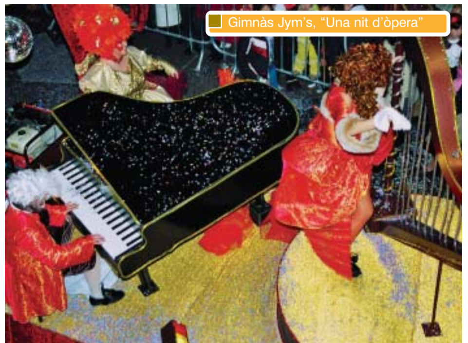
Gimnàs Jym's, "Una nit d'òpera"