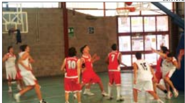
>> El Júnior B a casa davant la Unió Manresana