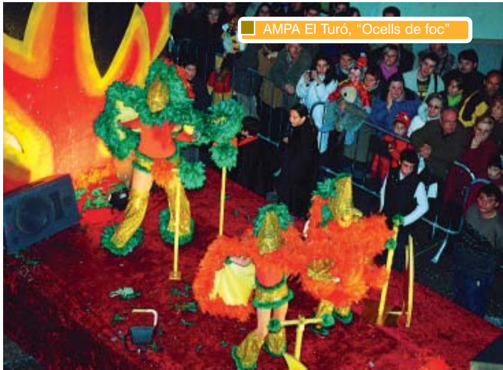
AMPA El Turó, "Ocells de foc"