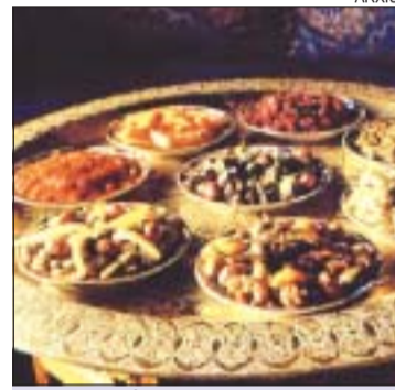
&gt;&gt; Plats típics marroquins