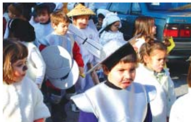
☺ CEIP Mitja Costa

P ersonatges de ficció, animats, del circ, i del Quixot de la Manxa; simpàtics hippies, cuiners de barret, indis cridaners, pollets esvalotats, terrorífics monstres entre prop d'un centenar de disfresses és el repertori sempre creatiu de les escoles per donar la benvinguda als dies de disbauxa que imposa el rei Carnestoltes. Alguns CEIP van aprofitar l'ocasió, com és tradició, per desfilant pels carrers i les places properes als centres, per al goig de mares i pares. Una autèntica mostra d'enginy.