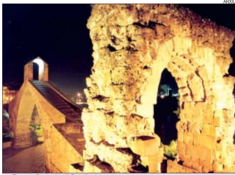
>> Fotografia de Jordi Contijoch

Montcada quan només tenia 2 anys, raó per la qual té un profund sentiment d'arrelament al municipi. Una altra de les especificitats d'aquesta mostra és que cada dibuix anirà acompanyat d'un text poètic del montcadenc