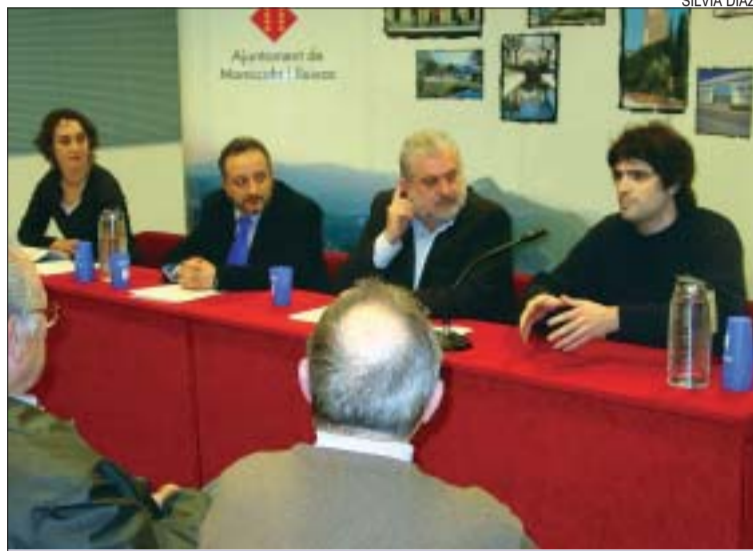
>> La presentació es va fer a la Casa de la Vila

Demostració pràctica. Els tècnics de l'Equip Verd van explicar la campanya el 8 de febrer a la Casa de la Vila davant gairebé un centenar de persones. La presentació va comptar amb una demostració, als lavabos, de com es fan servir els elements. El kit consta de tres aparells airejadors que es col·lo-