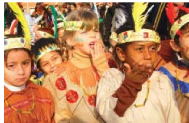
☺ CEIP El Viver