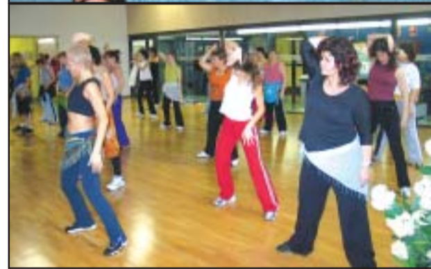
>> Participants a aquarelax (a dalt) i a la dansa del ventre