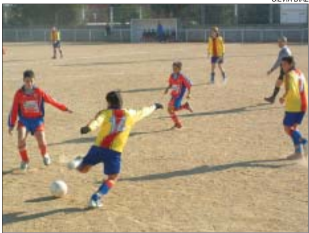
>> L'infantil va guanyar a casa al Lourdes de Mollet