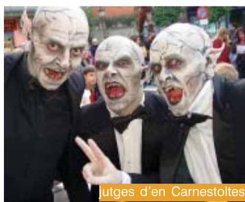
judges d'en Carnestoltes