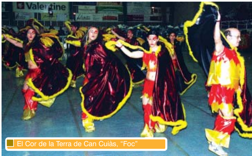
El Cor de la Terra de Can Cuiàs, "Foc"