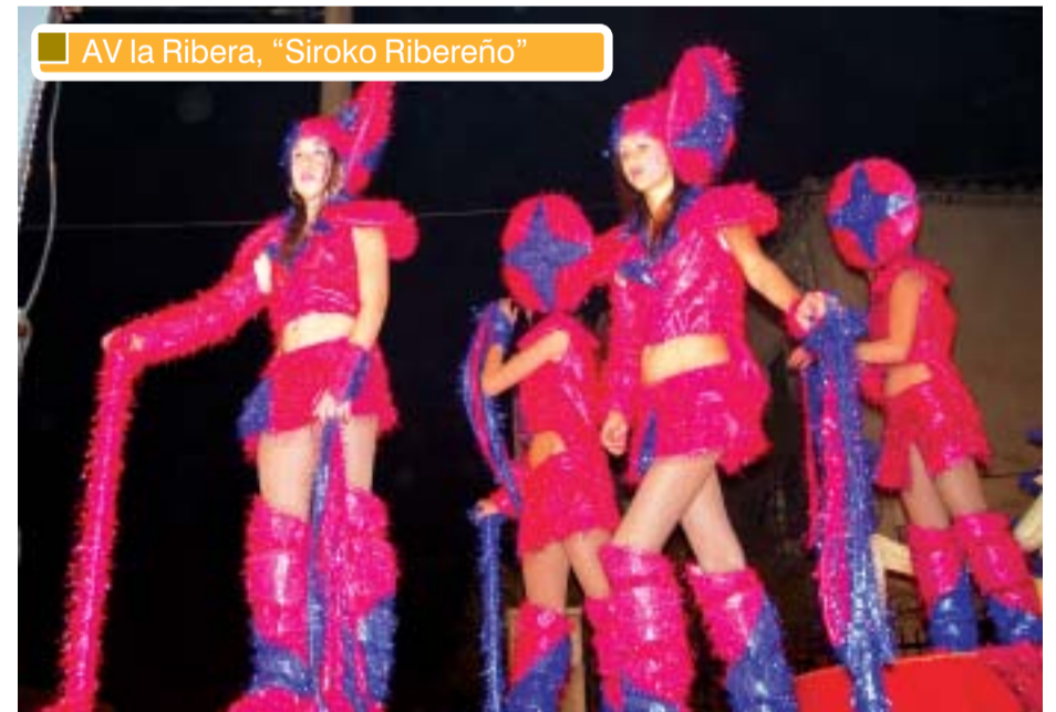
AV la Ribera, "Siroko Ribereño"