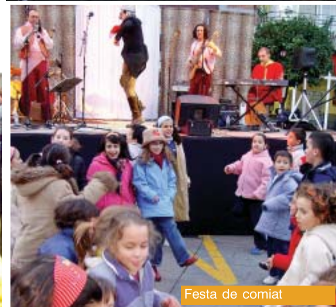
Festa de comiat