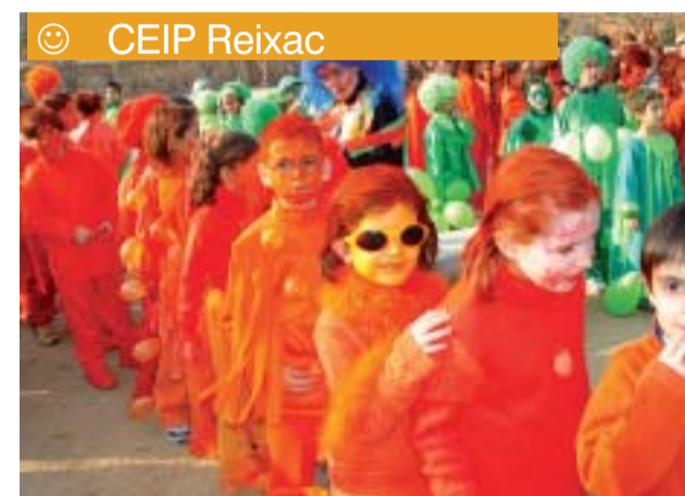
☺ CEIP Reixac