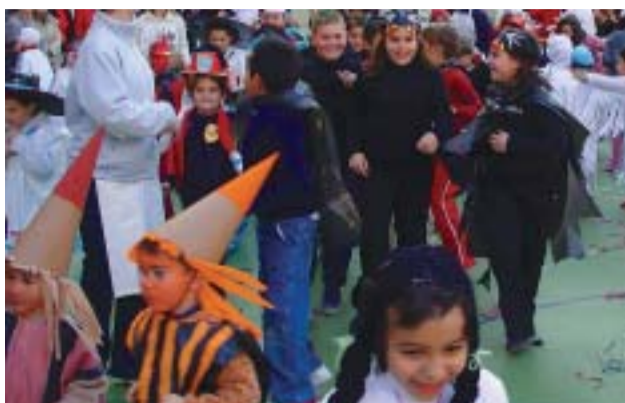
☺ CEIP El Turó