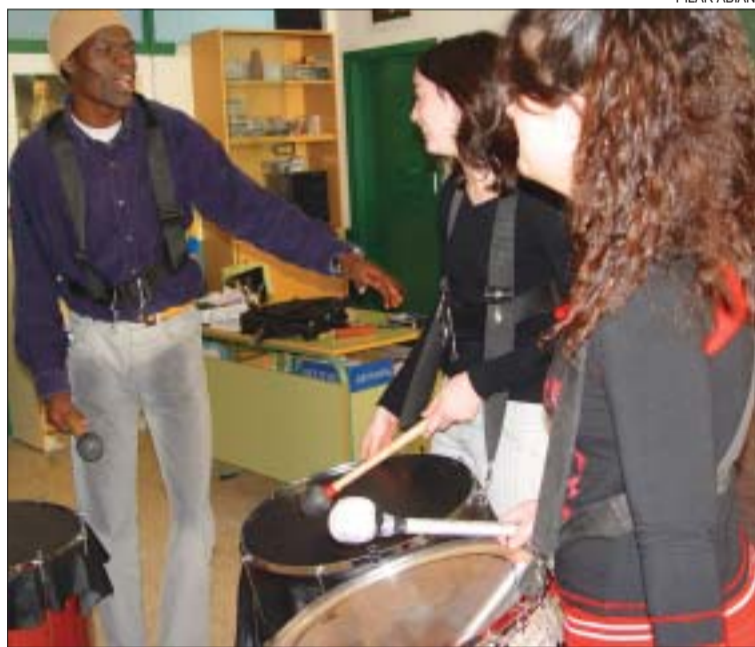
>> Alumnes atenent les explicacions musicals durant el taller de percussió

Els alumnes d'ESO de l'IES la Ribera van participar els dies 3 i 4 de febrer en diferents tallers sobre diversitat cultural i el tercer món que es van fer amb el suport econòmic del Departament de Solidaritat de l'Ajuntament i la Diputació de Barcelona i amb la col·laboració de l'ONG Món 3. Els estudiants van assistir a xerrades sobre mediació de conflictes, immigració i també a tallers de percussió i dibuixos fets amb sorra. PA