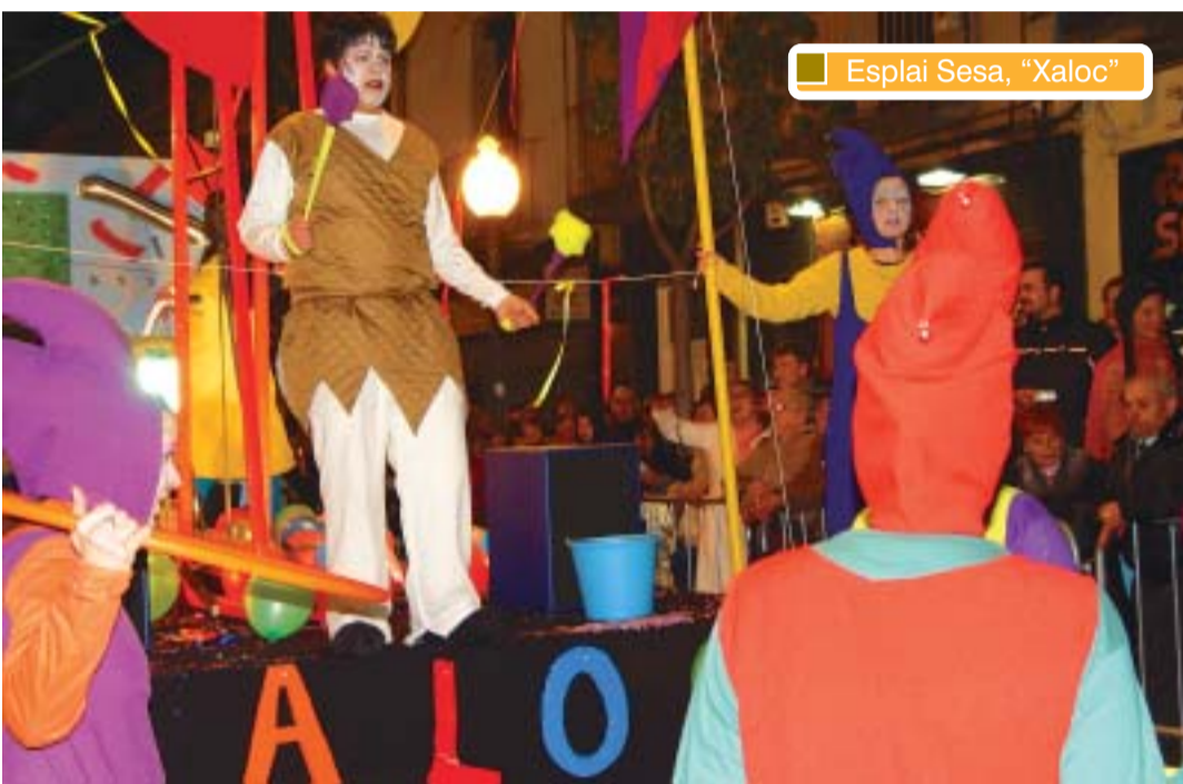
Esplai Sesa, "Xaloc"

Les comparses de Montcada triomfen fora del municipi. El grup Endansa, amb la disfressa Mare Nostrum (abaix), va quedar en segon lloc a la Rua de Barcelona, a més de guanyar el premi popular Miquel Pallès i la menció especial a la millor coreografia. El grup participa els dies 12 i 13 de febrer al Carnaval d'Àguilas (Múrcia). Per la seva banda, el Gimnàs Jym's (a dalt amb l'alcalde també disfressat), amb la comparsa "Una nit d'òpera", va quedar en segon lloc en l'apartat de carrosses i tercer en comparses a la Rua de Sabadell.