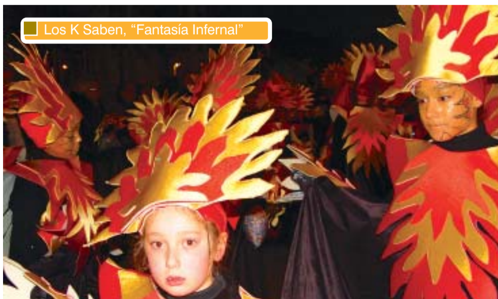
Los K Saben, "Fantasía Infernal"