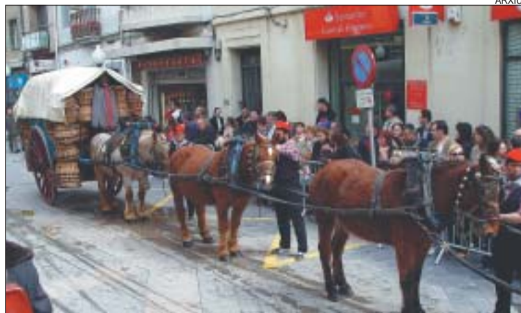
>> Un dels carros que va participar l'any passat a la festa