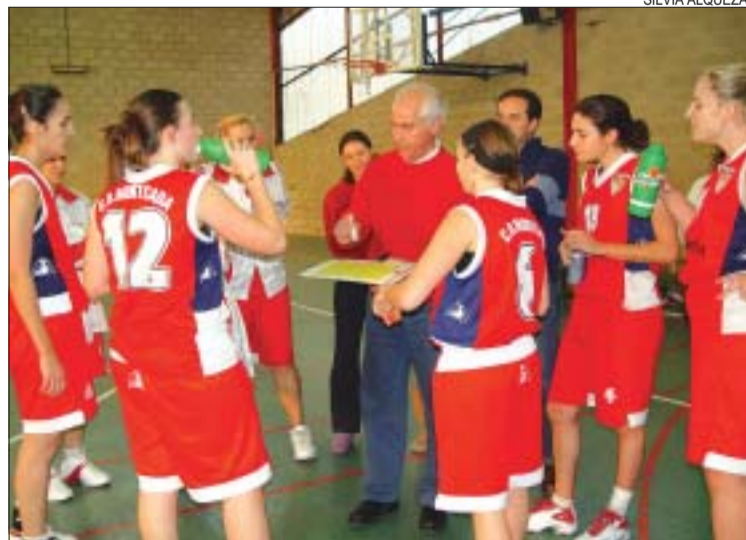
&gt;&gt; Forner dona ordres les seves jugadores en un temps mort