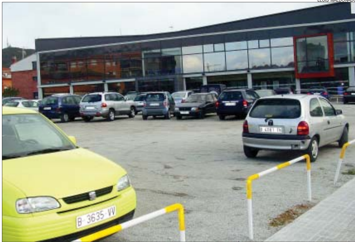
>> Terrenys de Montcada Aqua i la futura Biblioteca que seran hipotecats

Operacions previstes. Les finances municipals van ser l'eix de la sessió plenària que es va iniciar, un cop més, amb un minut de silenci per les víctimes de la violència de gènere que hi ha hagut durant el mes de gener. En l'apartat de l'Àrea Econòmica es van aprovar modificacions de crèdit, amb el vot en contra d'ERC, així com la nova ordenança de subvencions per a persones físiques i entitats, ajustada a la nova llei del govern central. També es van aprovar els Estatuts de la nova societat pública que es dirà Mercantil Montcada Òptima i neix amb el primer encàrrec de construir l'estadi de futbol de la Ferreria. Els punts més importants van ser, però, l'autorització per dur a terme operacions de crèdit destinades a inversions. D'una banda, es farà un crèdit per valor d'1.400.000 euros per a actuacions a carrers, polígons i equipaments, entre d'altres. Un segon crèdit, de 416.000, servirà per a les pistes de petanca projectades per l'Institut Municipal d'Esports i Lleure (IME), al Pla