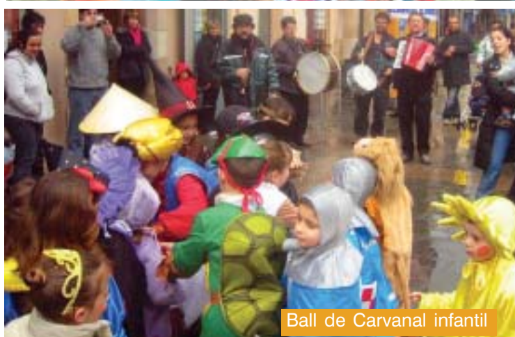
Ball de Carnaval infantil