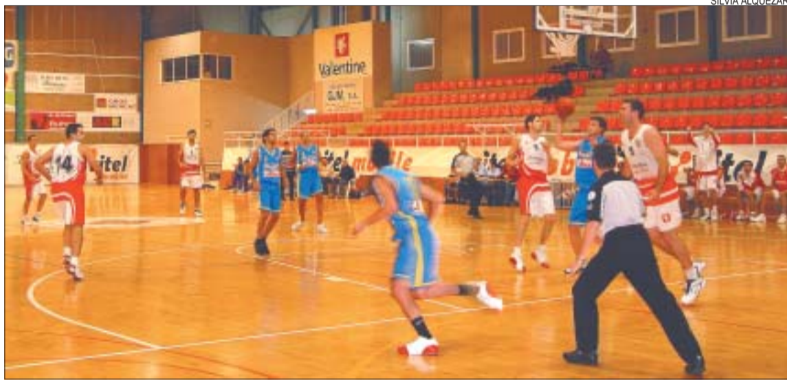
&gt;&gt; El Valentine masculí ha encadenat una excel·lent trajectòria que l'han portat fins al lideratge