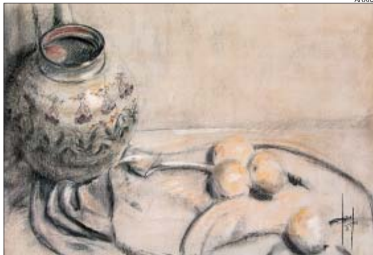
>> Una de les obres de Josep Quintero

Pintures i dibuixos. Prope-rament, a l'Auditori Municipal, es podrà visitar —entre el 23 de febrer i el 27 de març— la mostra dels dibuixos de grans dimensions de Josep Quintero. Les obres, que temàticament se centren en bodegons “perquè no es pot sortir a pintar al carrer amb papers tan grans”, explica Quintero, estan fetes sobre paper i estan sotmeses a procediments d'envelliment per dotar les imatges d'una innegable malenconia que reflecteix el pas del temps. L'artista va arribar a