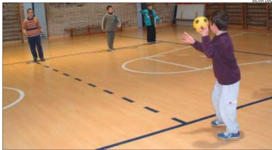
>> Jugadors del Mitja Costa durant els primers entrenaments d'handbol

Els monitors de la lliga d'handbol seran els mateixos amb els que els infants han fet futbol sala. El segon trimestre del curs és el més curt. La lliga d'handbol tindrà 5 jornades i finalitzarà el 12 de març. S'han creat dos grups. El primer està format pel Sagrat Cor A, el Reixac, el Turó i el Font Freda. El grup 2 està integrat pel Mitja Costa, el Viver, el