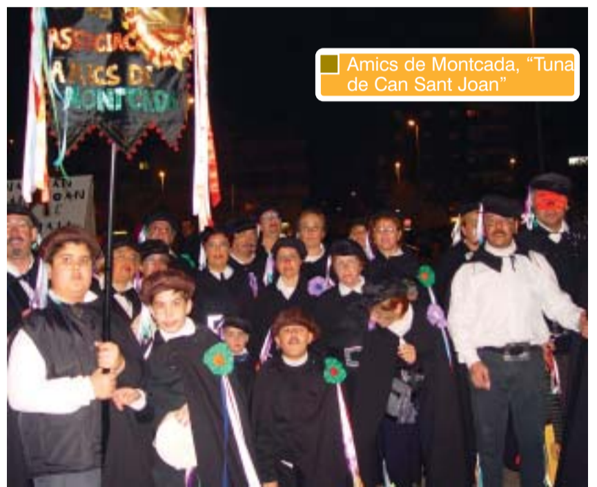
Amics de Montcada, "Tuna de Can Sant Joan"