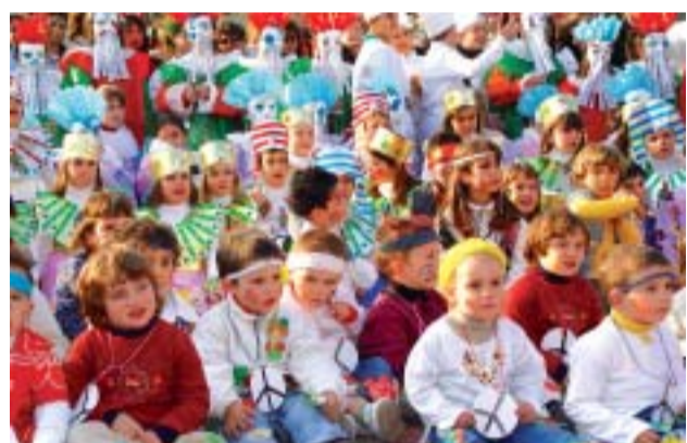
☺ La Salle