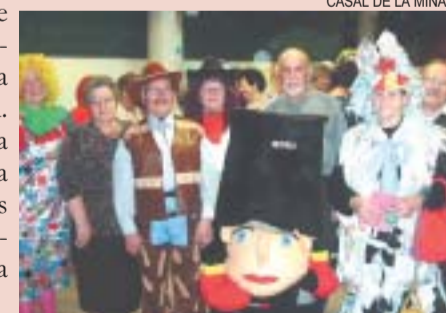
CASAL DE LA MINA

Els usuaris del Casal de la Mina també han viscut en aquestes dates la celebració del Carnaval. La fotografia de la dreta mostra una instantània de la festa de disfresses que va organitzar el centre i que va ser força participativa. LR