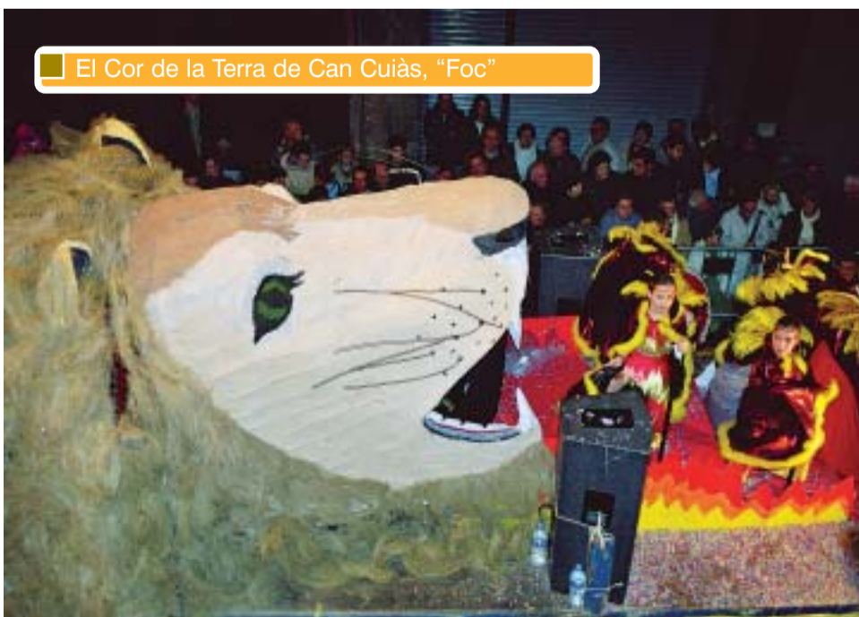
El Cor de la Terra de Can Cuiàs, "Foc"