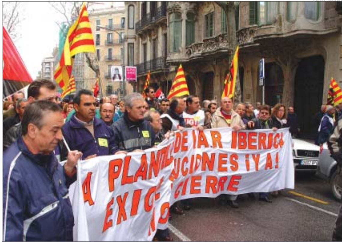
>> Manifestació dels treballadors pels carrers de Barcelona després de fer una assemblea a la plaça de Catalunya

Negociacions. En la primera reunió sobre l'expedient -el dia 8 a la delegació de Treball- va ser impossible aproximar posicionaments entre la direcció i el comitè d'empresa. Els treballadors exigien la continuïtat de la factoria mentre la multinacional només va parlar d'indemnitzacions. Els representants sindicals -UGT, CCOO i CGT- van posar en dubte les dades econòmiques aportades per l'empresa en un primer moment i van negar-se a que fos el fins ara representant d'IAR el sr. Echevarri, l'assessor dels creditors, en considerar-lo "imparcial". Segons els sindicats, el jutge va acceptar l'alegació manifestant que cercaria un altre expert i convocant una altra reunió