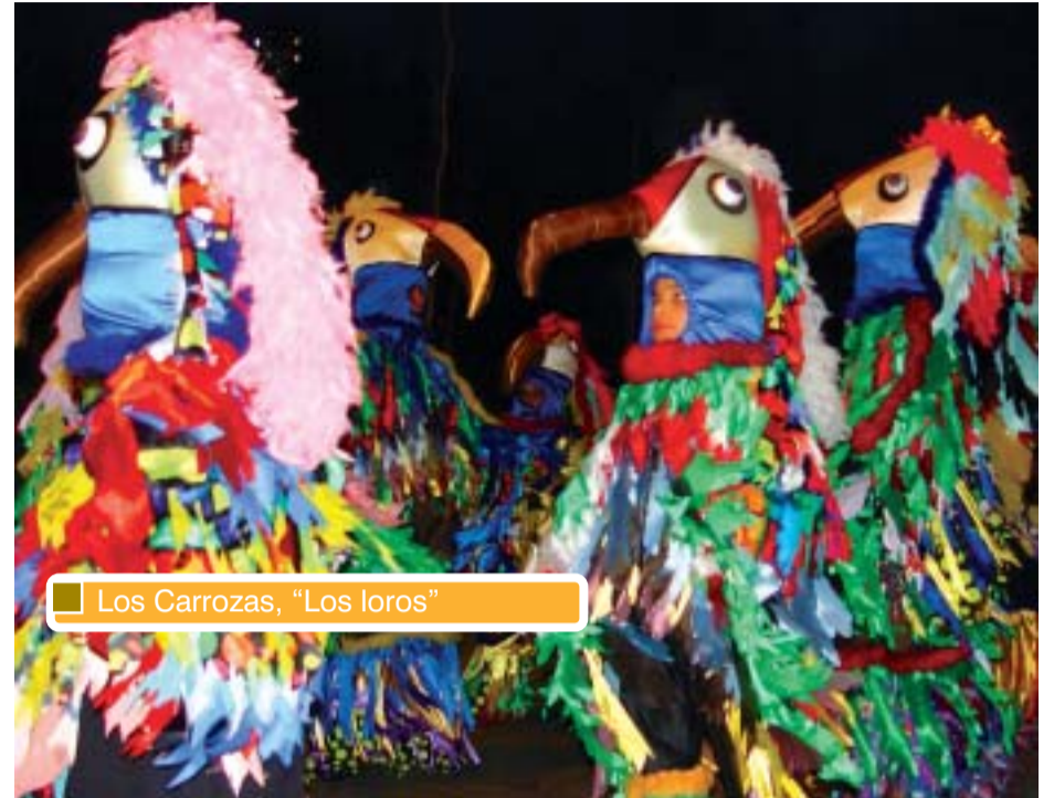
Los Carrozas, "Los loros"