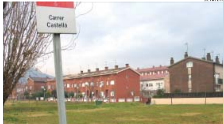
>> Terrenys on s'edificara el nou equipament