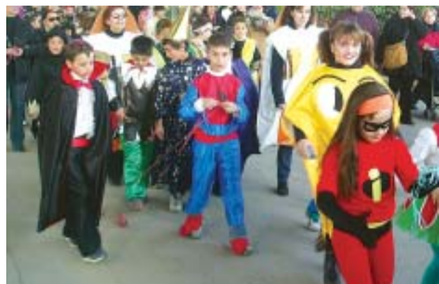
☺ CEIP Font Freda