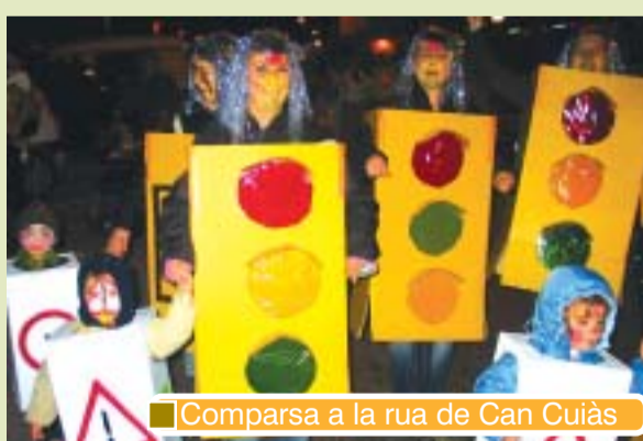
Comparsa a la rua de Can Cuiàs