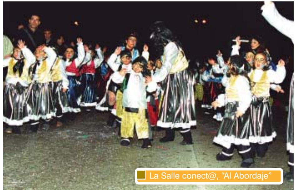
La Salle conect@, "Al Abordaje"