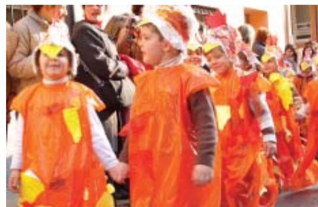
☺ Sagrat Cor