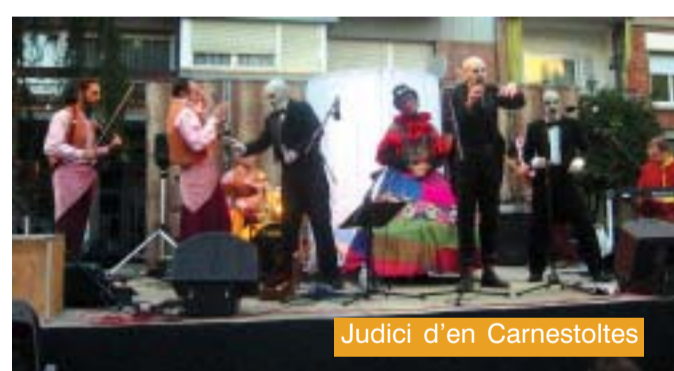
Judici d'en Carnestoltes