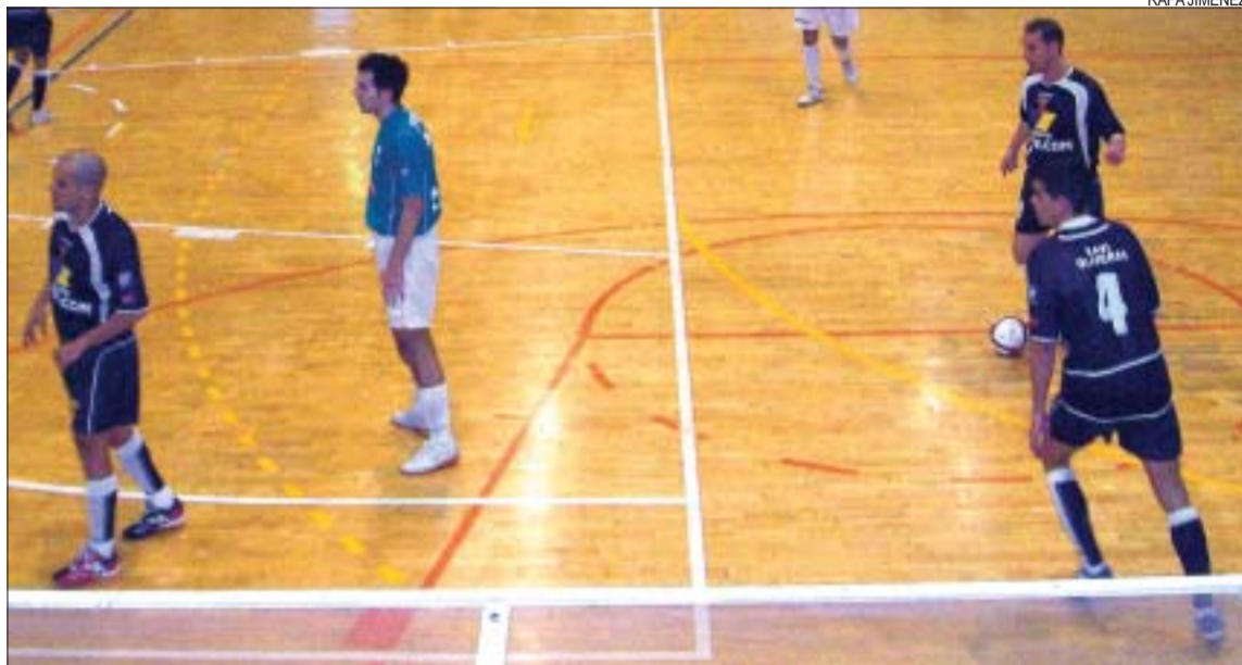
&gt;&gt; El Vitel va jugar contra el Canet el primer partit del 2005 al pavelló Miquel Poblet