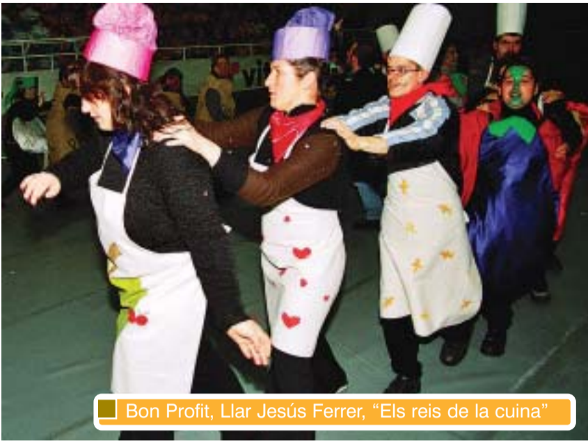
Bon Profit, Llar Jesús Ferrer, "Els reis de la cuina"