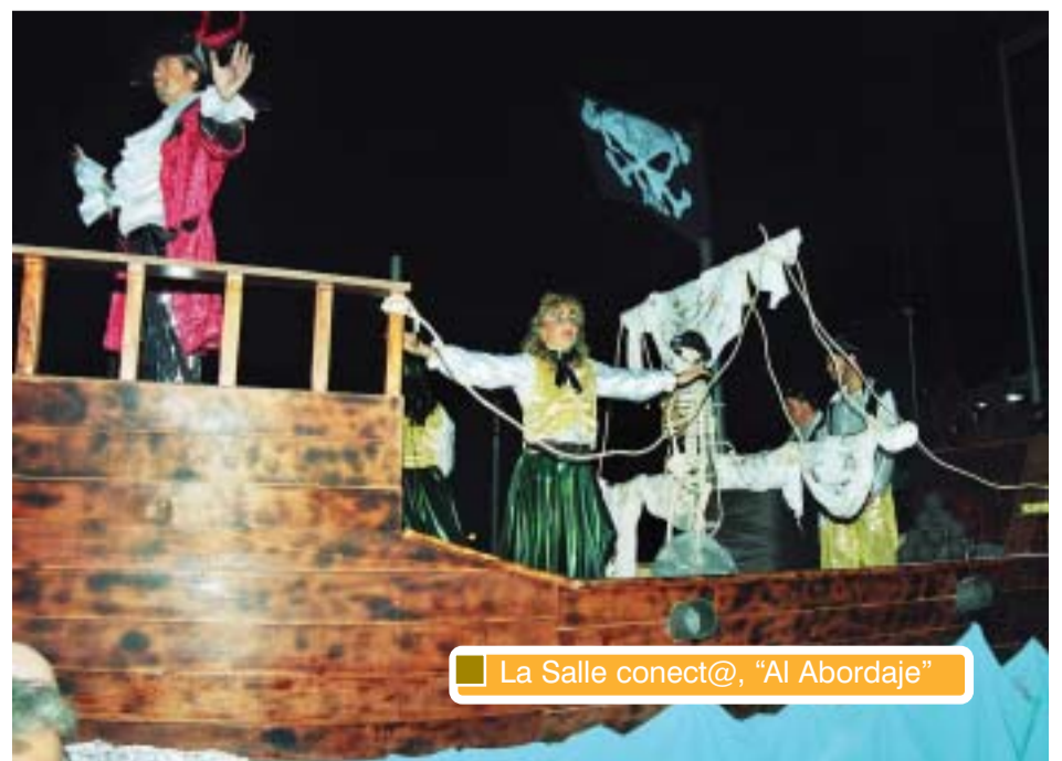
La Salle conect@, "Al Abordaje"