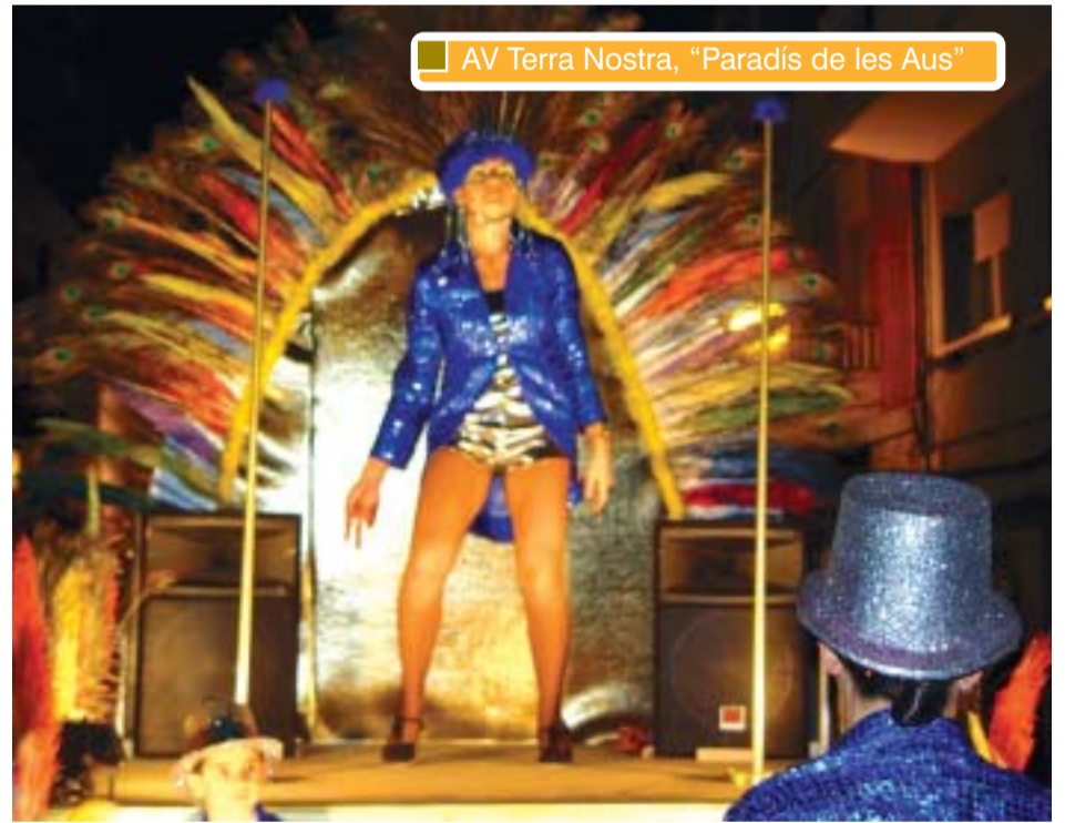
AV Terra Nostra, "Paradis de les Aus"