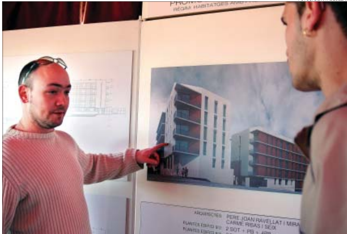
>> Els afortunats dels 188 pisos van poder veure in situ els plànols i les imatges virtuals dels habitatges

Qualitat. L'Impsòl construirà 188 pisos repartits en tres edificis. La promoció Mas Rampinyo I consta de 87 habitatges amb una superfície útil d'entre 64 i 90 m 2 , 102 aparcaments i 39 trasters. El bloc Mas Rampinyo II està format per 62 llars entre 66 i 90 m 2 , a més de 62 places de pàrquing i 59 trasters. Finalment, el sector Mas Rampinyo III està integrat per 39 pisos, amb una superfície de 62 a 82 m 2 i 39 aparcaments. En el torn de parlaments, els representants polítics i l'Institut Metropolità del Sòl van coincidir a destacar la qualitat dels habitatges i de la urbanització de la zona. "Els pisos tindran uns bons acabats i, a més, es troben en un indret privilegiat al costat de 400 hectàrees de zona verda que preservarem" , va indicar l'alcalde de Montcada, César Arrizabalaga (PSC), qui va afegir que la nova urbanització de Mas Rampinyo disposarà d'una escola ja pro-