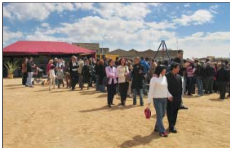
>> L'acte va despertar força expectació amb centenars de veïns