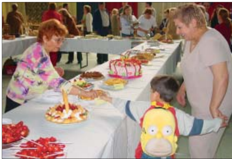
>> La mostra de cuina ofereix plats al gust de tothom