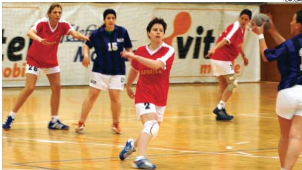
&gt;&gt; La Salle femení no ha fet una bona temporada però ha aconseguit l'objectiu de la permanència

L'entrenador, en declaracions a Montcada Ràdio, opina que l'equip ha patit en excés el canvi de categoria perquè "no hem sabut acoplar-nos i assimilar la Primera Catalana" , una competició que, segons Quirós, és més exigent per la gran diferència de qualitat que hi ha en comparació amb la Segona Catalana, la categoria on La Salle militava la temporada anterior. Pensant en el futur, el tècnic ha manifestat que li agradaria continuar a la banqueta, tot just quan ara començarà la Copa Catalana. El primer partit serà el 24 d'abril contra l'Arrahona a les 10.30h a la pista coberta.