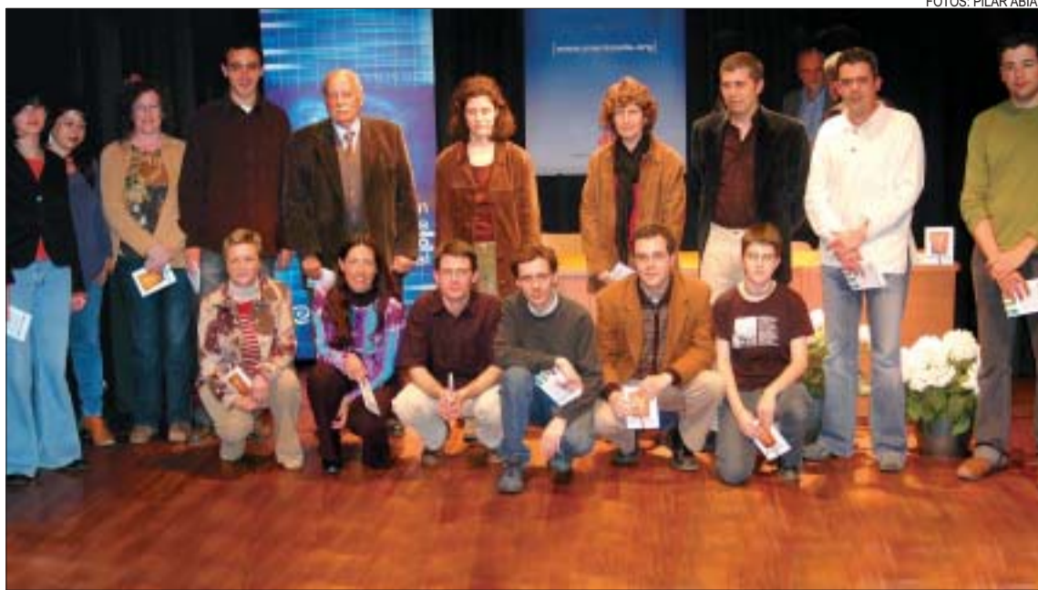
>> Els autors dels microrelats seleccionats per al llibre i els guanyadors del premi en la foto de família