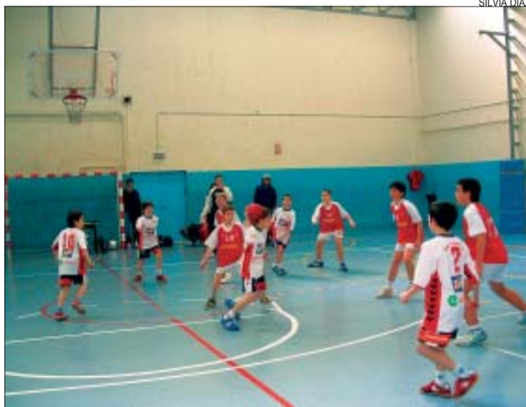
>> La Salle és un dels equips que participarà a la comarcal d'handbol