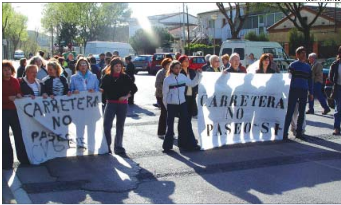
>> Els manifestants, a l'avinguda de Terra Nostra en la primera mobilització feta l'11 d'abril