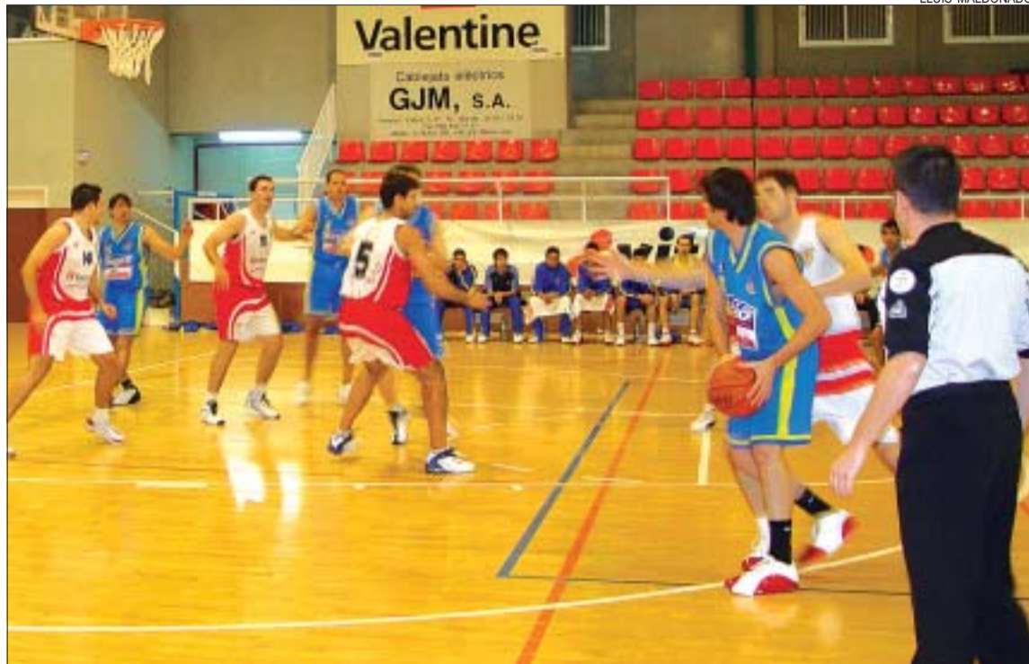
&gt;&gt; El Valentine té dos desplaçaments difícils a la pista del Mataró i el Vic

Campionat estatal. El primer classificat del Grup C és l'únic equip que passarà directament a la fase final. La resta —els tres primers de cada grup EBA— haurà de jugar una fase prèvia a doble partit els dies 15 i 22 de maig. En el cas que el