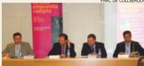
PARC DE COLLSEROLA

Ja està en marxa el Projecte Bici i la campanya de sensibilització per regular l'ús de la bicicleta al parc de Collserola. Amb el lema Al parc, bones pràctiques en bici , es pretén que els ciclistes facin una passejada i una descoberta de l'entorn, sense malmetre'l, i que gaudeixin del parc amb seguretat, tant per a ells com per a la resta d'usuaris. La campanya dona un decàleg de bones pràctiques: cediu el pas, eviteu ensurts, sigueu prudents, vigileu d'interferir, limiteu la velocitat a 20 km/h i circuleu pels indrets adients. El Consorci del parc i la Federació Catalana de Ciclisme, impulsors del projecte, tenen previst publicar una guia d'itineraris en bici pel parc aquesta tardor. Més informació del Projecte Bici: www.parcollserola.net . MS