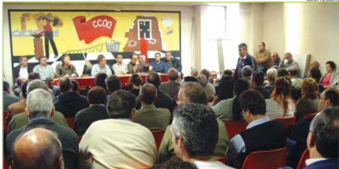
>> Assemblea multitudinària dels treballadors a la delegació local de CCOO

Les demandes socials de la plantilla són recol·locació, cotitzacions especials per als majors de 55 anys i prestacions per desocupació. Els treballadors portaven un mes cobrant el sou sense anar a treballar, excepte una quarantena de persones que havien de liquidar assumptes pendents. Per això també demanen una prolongació de l'atur fins arribar als 24 mesos exactes. Per controlar el compliment de