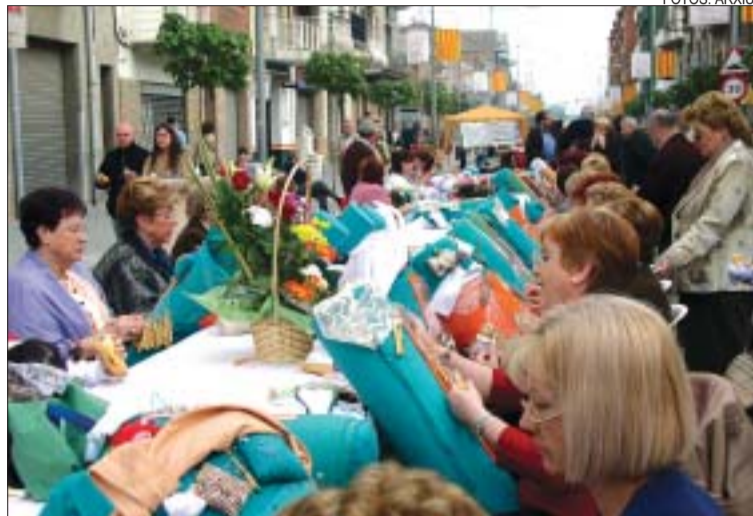
>> La trobada de puntaires sempre té una bona resposta