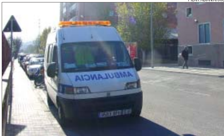
>> Una de les ambulàncies que presta servei al municipi