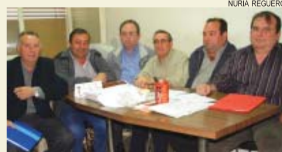
>> Els membres de la Comissió de seguiment