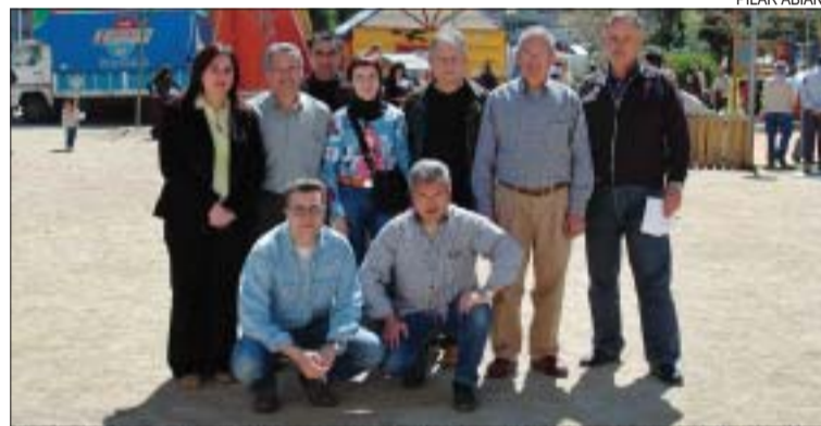
>> Membres de la nova junta de l'entitat durant la festa veïnal