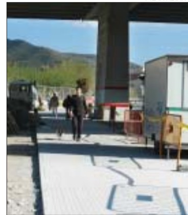
>> Aspecte actual de les obres

Les obres per ampliar la vorera sota el pont de la C-33 paral·lela a la rambla dels Països Catalans van començar a principis de març. La vorera s'eixampla per a la comoditat i la seguretat dels vianants. La vorera agafarà una part del pàrquing de sota l'autopista, estarà limitada a banda i banda per les columnes de contenció del pont i mantindrà la mateixa estètica que l'actual, el mateix tipus de paviment. L'empresa Mantenimiento de Espacios és l'encarregada de les obres, que costen 19.000 euros. L'objectiu de l'actuació és donar més espai als vianants que van en direcció Montcada Nova.