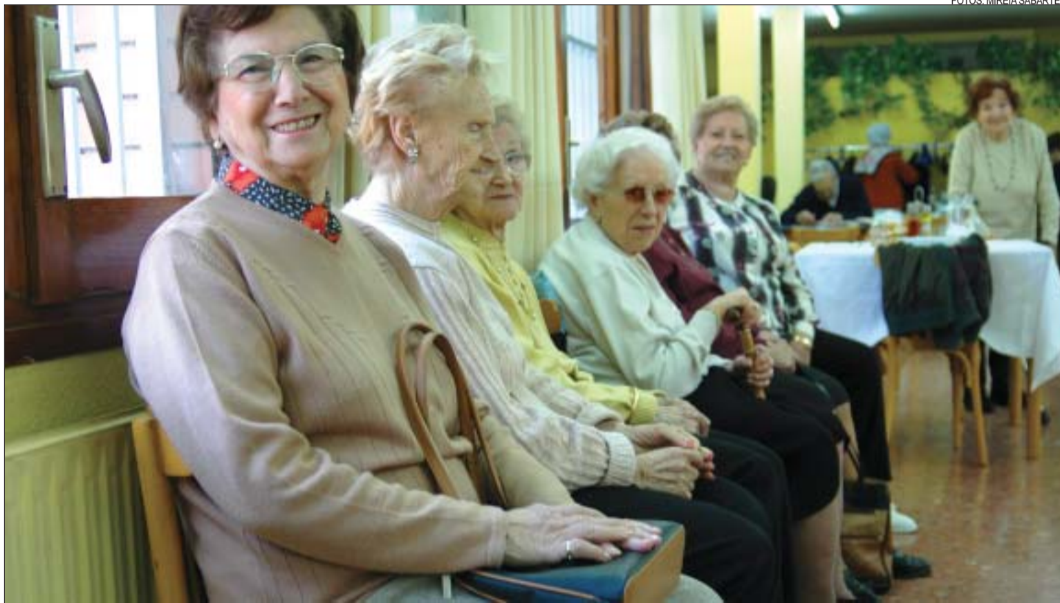
>> Usuàries del Casal en una de les sales del centre

Activitats. I és que al Casal hi ha un racó per a cadascú. Es pot triar entre moltes activitats, com ara les manualitats, la confecció de vestits de paper, la pintura, el cant coral, els cursos de català, les sortides i excursions, el taller d'activitat mental, els jocs de taula... També hi ha perruqueria, a preus mòdics, que porta dues dècades fent crepats i ruixant caps amb molta laca. Hi ha serveis que els ofereix la Generalitat, gestora del Casal, i d'altres que neixen de l'Associació de la Gent Gran de Montcada, que té monitors voluntaris per fer tallers. El president de