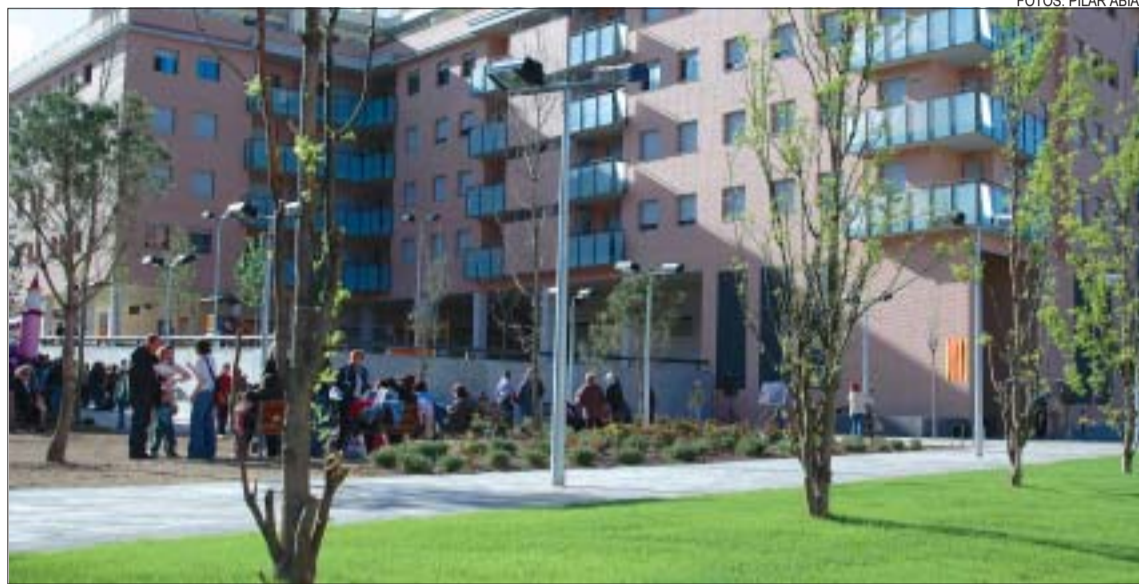
>> Aspecte del nou espai públic el dia de la inauguració amb la zona ajardinada en primer terme

Disseny. La plaça de les Calderes té una superfície de 6.276m 2 , i inclou zones de lleure, un espai de jocs pels nens i zones verdes. El preu final de l'obra ha estat de 450.693,34 euros. Romo va agrair a l'Oficina Tècnica de l'Ajuntament el disseny de l'espai que segueix, segons va dir, la línia