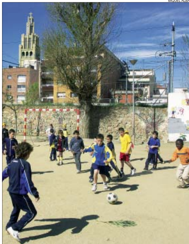
>> El futbol sala va ser protagonista de la festa del CEIP Reixac

El CEIP El Turó també celebrarà les jornades el 30 d'abril i començaran a les 10h amb una cursa d'atletisme, organitzada per la Joventut Atlètica Montcada (JAM). També hi haurà jocs gegants al pati, inflables, un taller d'estampació, un altre de hena (amb