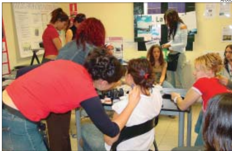
&gt;&gt; La mostra d'ensenyament orientarà els joves amb tastet d'oficis

Una de les novetats més destacades del proper curs en l'àmbit de secundària és la posada en marxa a l'IES la Ferreria d'un nou cicle d'auxiliar d'infermeria de grau mitjà. López ha anunciat que, per al curs 2006-2007, el centre podria oferir el grau superior d'aquest mateix cicle. El