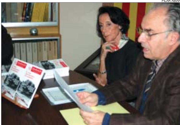
>> La presentació de la publicació es va fer a la seu de l'entitat

va". L'entitat va fer oficial aquesta celebració amb la presentació del nou número de la seva publicació el passat 20 d'abril. El número, més llarg de l'habitual, està dedicat de manera especial a la trajectòria de la Fundació i al Turó de Montcada, que "és, juntament amb Reixac, un símbol del nostre municipi", en paraules de la presidenta de la Fundació.