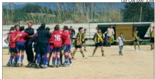
CEF CAN SANT JOAN