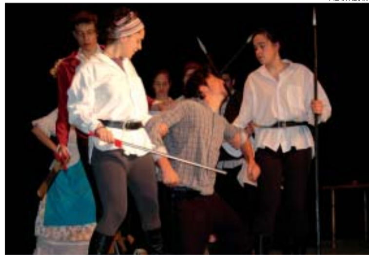
&gt;&gt; Imatge d'un assaig de la representació

text que pertany al gènere de la literatura juvenil. El muntatge es va començar a preparar fa mesos i ha sofert modificacions destacades en la recta final del projecte amb la incorporació de peces musicals que interpreten en directe els mateixos actors. PA