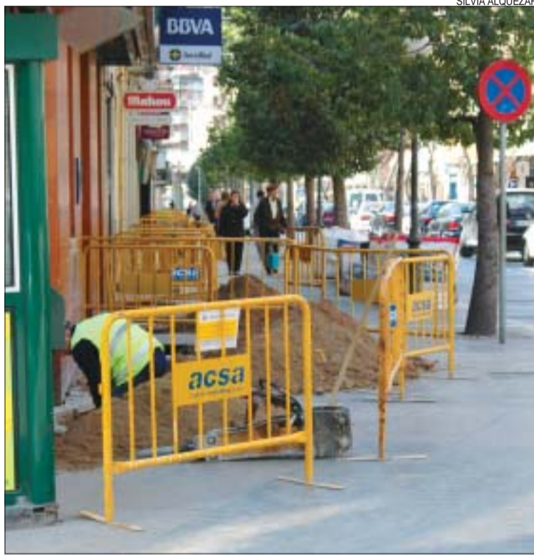
&gt;&gt; Obres de la companyia d'aigües al carrer Major

Altres millores. La companyia d'Aigües està duent a terme la renovació de la xarxa de subministrament a part del carrer Major, des de la cantonada de Bogatell fins a Generalitat. Els treballs, que duraran fins a mitjan maig, s'inclouen en el conveni de col·laboració entre l'Ajuntament i Aigües de Barcelona per a la