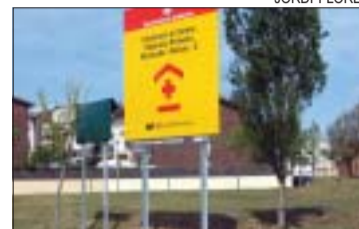
&gt;&gt; Terreny on es construirà el CAP

El proper 6 de maig, a les 11h, es realitzarà l'acte protocolari de colocació de la primera pedra del segon CAP de Montcada i Reixac. L'acte al qual assistirà la consellera de Sanitat, Marina Geli, tindrà lloc als terrenys del futur CAP, ubicat al camí de la Font Freda, cantonada amb els carrers Castelló, passatge de la Costa Brava i València i consistirà en la introducció de monedes de curs legal, les portades del diari del dia i un document signat pels representants de la Generalitat i l'Ajuntament dintre d'una pedra que simbolitzarà l'inici de les obres del futur equipament. PA