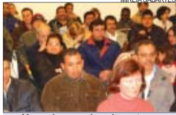
&gt;&gt; Xerrada per a immigrants