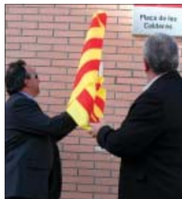
>> Descoberta de la placa

En la jornada inaugural, les autoritats van manifestar la seva sorpresa per algunes pancartes penjades als nous habitatges en protesta per problemes d'humitat i altres deficiències, que els representants de la promotora s'han compromès a resoldre.