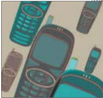
>> Mòbils en desús

Servei de teleassistència. Una quarantena d'avis de Montcada van utilitzar el servei de teleassistència que ofereix l'as-