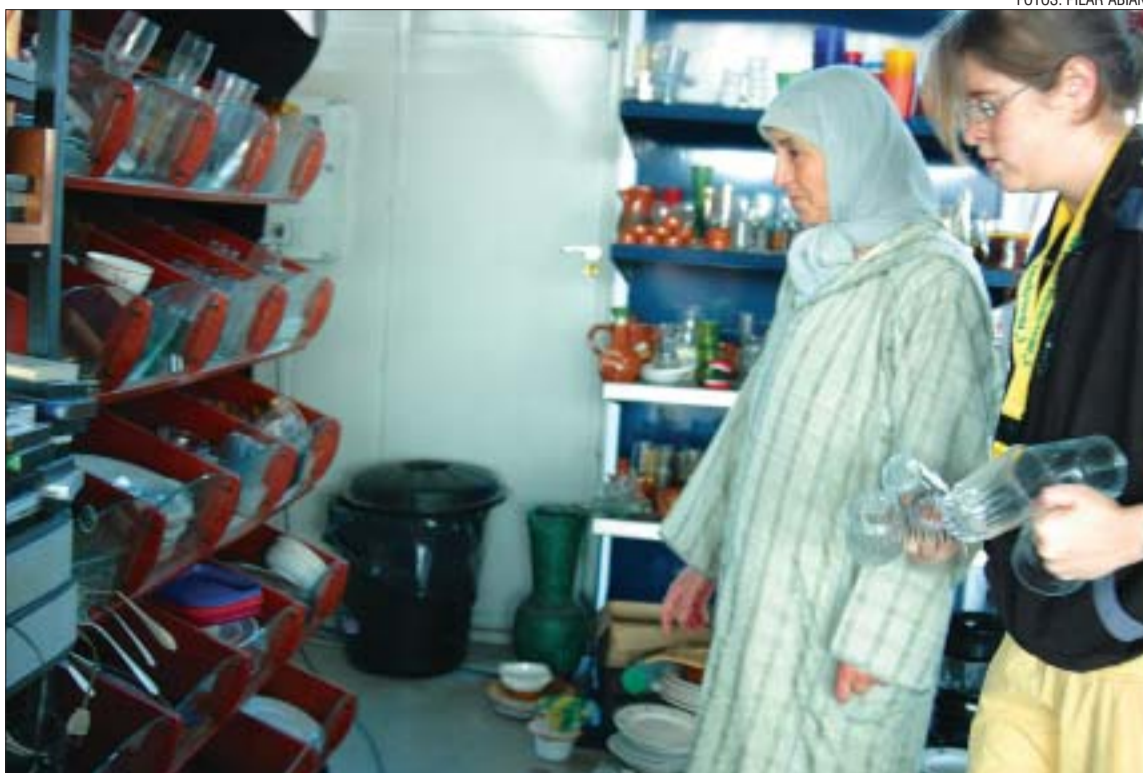
>> A la nau es poden trobar autèntiques gangues en tota mena d'objectes de la llar

A la nau de reciclatge es poden adquirir tota mena d'objectes de