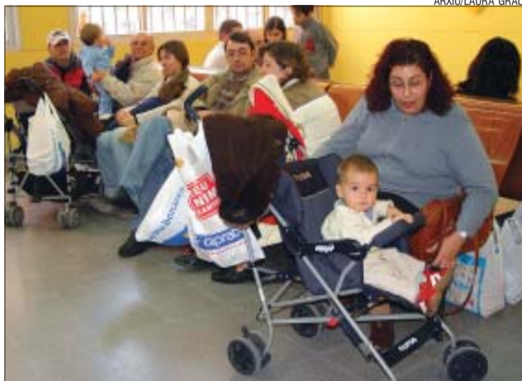
>> L'any passat el virus de la grip va saturar els serveis d'urgència

L'Equip d'Atenció Primària (EAP) de l'ambulatori de Montcada començarà a administrar la vacuna de la grip el proper 4 d'octubre. La campanya, que s'allargarà fins al 19 de novembre, dona prioritat a la vacunació de les persones en què la grip pot produir les complicacions més greus i causar major mortalitat com és el cas de la població de 60 anys o més, però també els nens, joves i adults amb algun problema de salut. La vacuna també es recomana als individus o grups que poden transmetre la grip a persones d'alt risc, com els professionals sanitaris i persones que fan serveis essencials per a la comunitat –policies, bombers o personal de protecció civil, entre d'altres. La població de risc i la que té indicada la vacuna pot acudir a l'ambulatori –a la consulta annexa– sense necessitat de demanar cita prèvia amb horari de 10 a 12.30 h al matí i de 17 a 18.30 h a la tarda. Aquest horari funcionarà fins al 14 d'octubre. A partir d'aquesta data la vacuna l'administrarà la pròpia