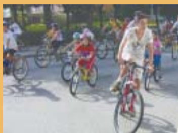
Parc Salvador Allende 11h