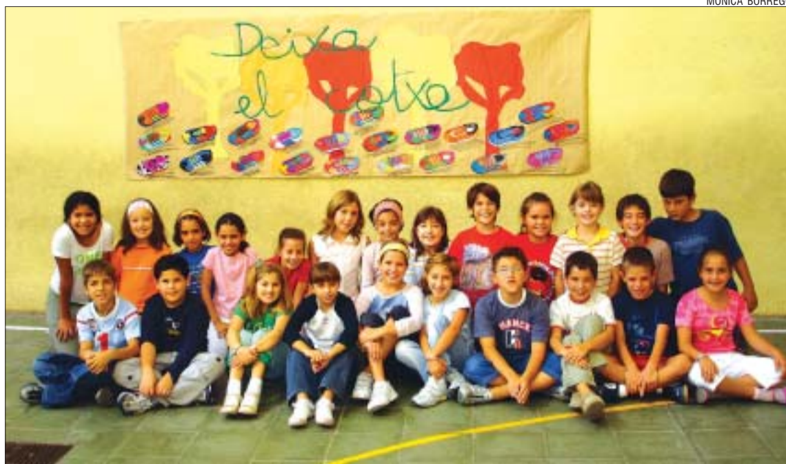
>> Amb el títol 'Deixa el cotxe' una de les classes de 4t del Sagrat Cor va contribuir a la Setmana de la Mobilitat