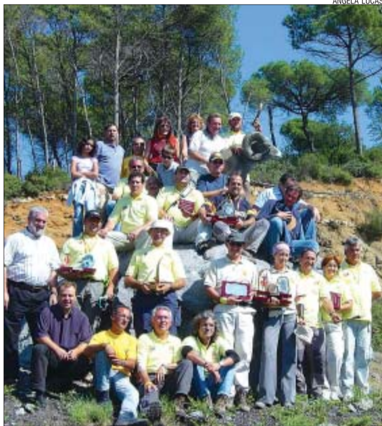
>> Els arquers medallistes amb les autoritats municipals