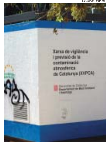
>> Estació de control atmosfèric

A Can Piqué donem la benvinguda a l'estiu amb noves propostes culinàries i un entorn verd en ple èxtasi. Esperem que gaudiu dels canvis, nova Carta de Vins Menú de Tast i la nova Oferta Gastronòmica. Esperem la vostra visita.