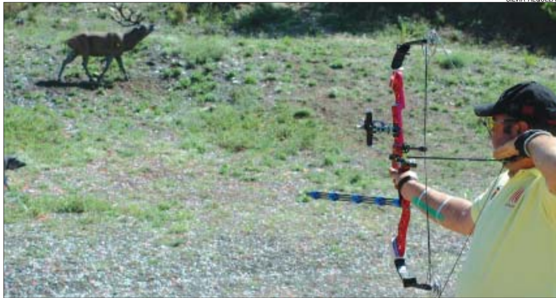
>> Un dels arquers de la selecció catalana durant la competició per autonomies