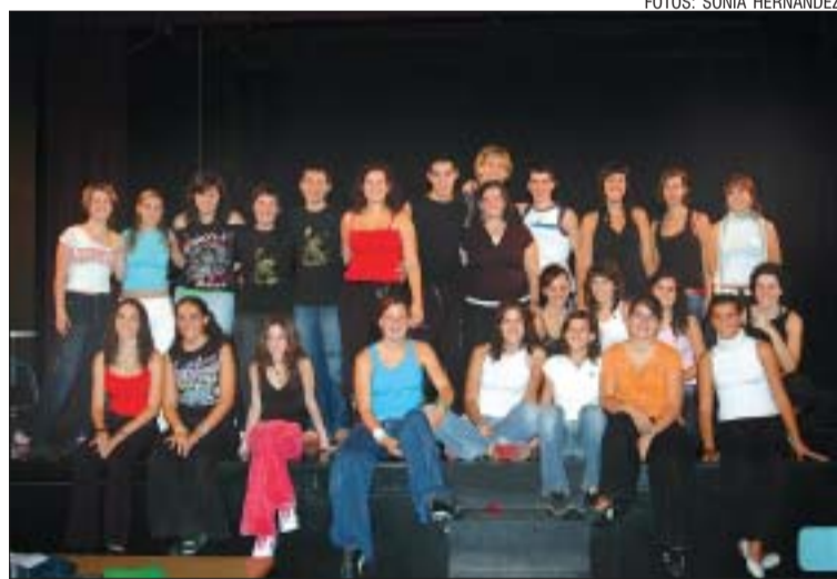
>> Les proves van despertar força expectació

Moment decisiu. Alguns se sentien com si haguessin de participar en algun concurs televisiu que els faria famosos per sempre. Un cop dintre, des del pati de butaques una veu sense rostre demanava al candidat que s'identifiqués per després donar pas a les dues proves: una de text i una de ball. Durant tot el matí per l'escenari dels Herma-