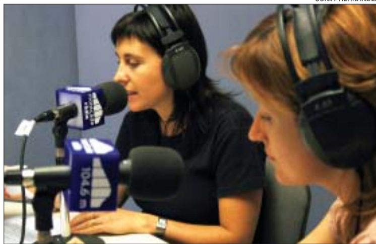
>>> El 'Montcada Notícies' ofereix la informació d'actualitat més propera