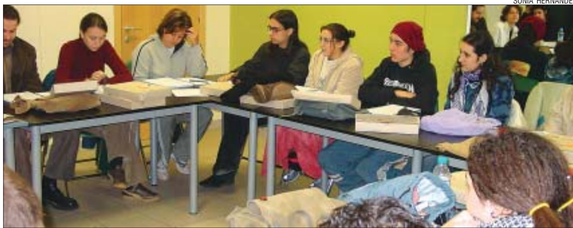
>> El curs de monitors de lleure va ser una de les activitats més nombroses de l'oferta de l'any passat

La Regidoria d'Educació oferta un any més el taller trimestral "Anima't, juga amb ells", adreçat a pares de nens de 9 mesos a 5 anys. L'objectiu de l'activitat és promoure, mitjançant el joc i l'expressió plàstica, la comunicació entre pares i fills. El preu d'inscripció és de 40 euros i el calendari varia en funció de les edats. Els nens de 9 a 18 mesos faran l'activitat els dilluns del 24 d'octubre al 6 de febrer, de 18 a 19.30h, a l'escola bressol Camí del bosc, de Can Cuiàs. En el cas dels alumnes de P3 a P5, el taller es durà a terme els dimecres, del 19 d'octubre al 25 de gener, de 18 a 19.30h, i de febrer a maig, el segon dilluns de cada mes, de 18 a 19.30h, al CEIP Reixac. Pel que fa al grup de nens de 18 a 36 mesos, es farà de febrer a maig i la inscripció s'haurà de formalitzar durant el mes de gener a la Regidoria d'Educació (av. de la Unitat, 6). PA