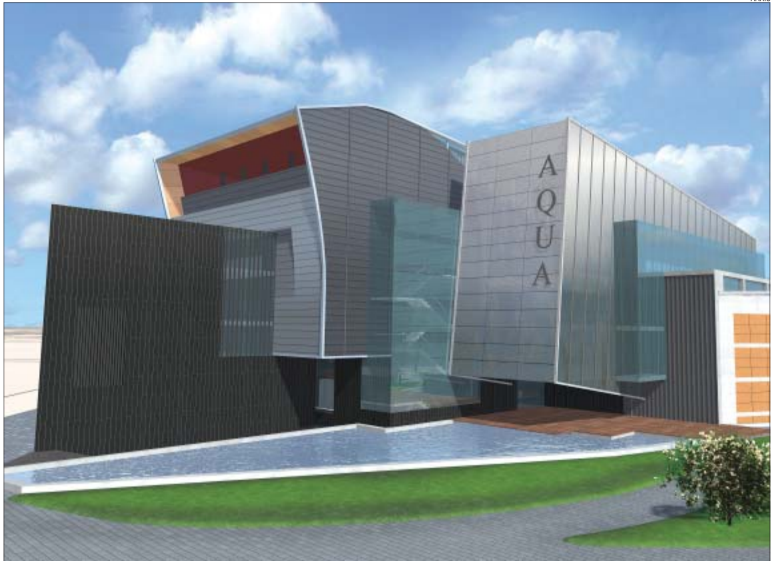
>> Imatge virtual de l'exterior del futur complex. El projecte és un dels més originals i avantguardistes de Catalunya pel que fa a la seva concepció

Edifici original. El projecte lúdico-cultural del Pla d'en Coll és un dels més originals i avantguardistes de Catalunya pel que fa a la seva concepció, ja que integra el complex esportiu Montcada Aqua amb la biblioteca, l'auditori, una sala d'exposicions de més de 120 m 2 i diverses sales que acolliran el fons de la