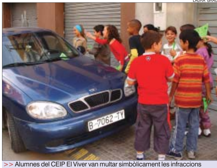
>> Alumnes del CEIP El Viver van multar simbòlicament les infraccions

vehicles mal aparcats. Prèviament les monitores de l'Equip Verd van impartir una xerrada sobre la insostenibilitat del model actual de transport particular i els problemes que genera l'existència de milers de vehicles a les ciutats. A posteriori els escolars van sortir a l'exterior a comprovar les infraccions més habituals als carrers del seu barri, com cotxes damunt la vorera i ocupant els passos de vianants que impedi-