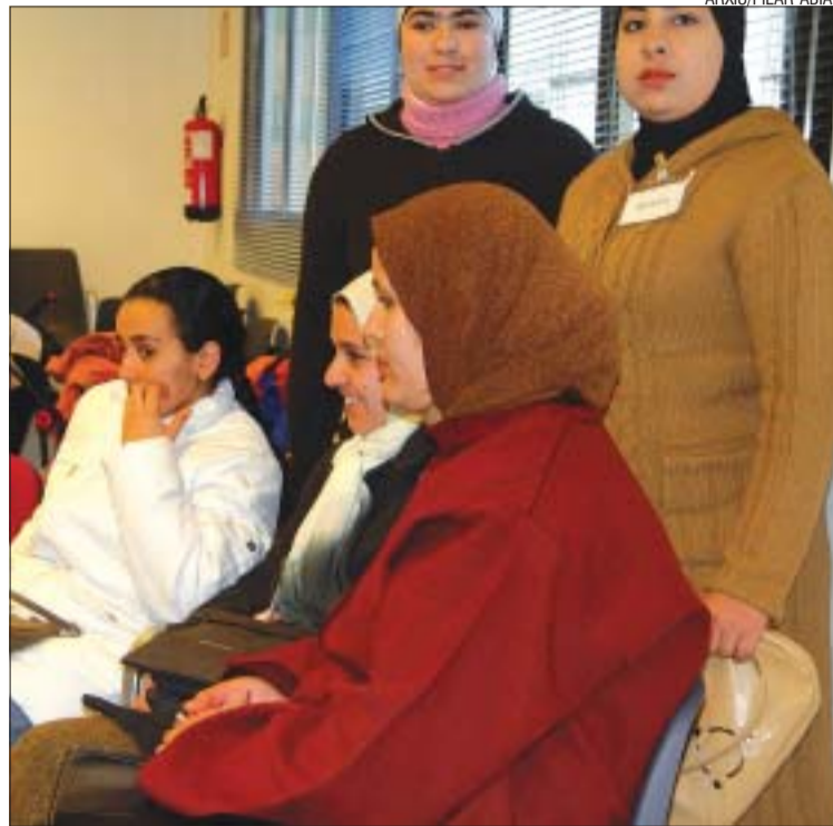
&gt;&gt; Les dones magribines han demanat que l'alfabetització sigui en català

Tradicionalment l'alfabetització sempre s'havia fet en llengua castellana, però a partir d'aquest curs, i a petició de les dones magribines, el Centre Bon Dia alfabetitzarà en català. Des de fa temps el Centre Bon Dia fa una gran funció docent i social adreçada a dones. Dues de les tasques, dutes a terme per persones voluntàries, és l'ensenyament del català i l'alfabetització.