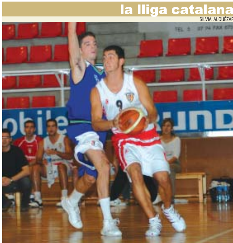
la lliga catalana

Calendari complicat. El tècnic està convençut que l'equip sabrà redreçar la situació tot i el calendari difícil que afronten els montcadencs que, després de la primera derrota a Olesa, es desplacen a la pista del Muro. "Sabem que podem fer bé les coses -afegeix- perquè dels sis partits jugats fins ara, només hem perdut els dos de la lliga" .