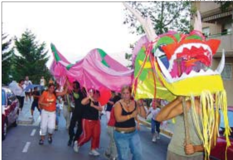
>> La cercavila tradicional va comptar amb el suport de molts veïns

Durant el recorregut, diversos comerços es van afegir a la celebració, que va acabar a la pista coberta del parc del Turó Blau amb l'espectacle Més gats , del Pentina, que van reunir més d'un centenar de petits. També s'havia previst ball popular amb l'orquestra Huracán, sevillanes i espectacles de varietats. En el moment de tancar aquesta edició, l'AV, organitzadora de la celebració, amb la col·laboració de l'Ajuntament, no s'havia reunit per valorar la festa major; tot i que la participació fa endevinar que serà positiva.