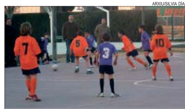
&gt;&gt; Els entrenaments es posen en marxa el 3 d'octubre

Els organitzadors de la lliga, el Consell de l'Esport Escolar de Montcada (CDEM) i l'Institut Municipal d'Esports i Lleure (IME) tenen previst començar la competició la darrera setmana d'octubre. SD