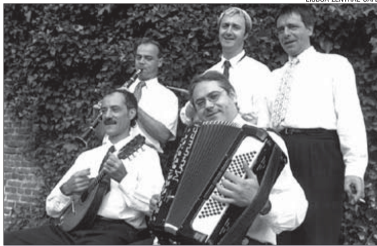
>> Els músics que integren Lisboa Zentral Cafè