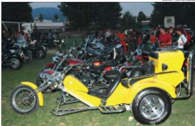
&gt;&gt; Trobada de motos els dies 24 i 25 al camp de futbol de la Ferreria