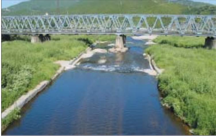
&gt;&gt; El Ripoll al seu pas per Montcada, abans de la seva desembocadura