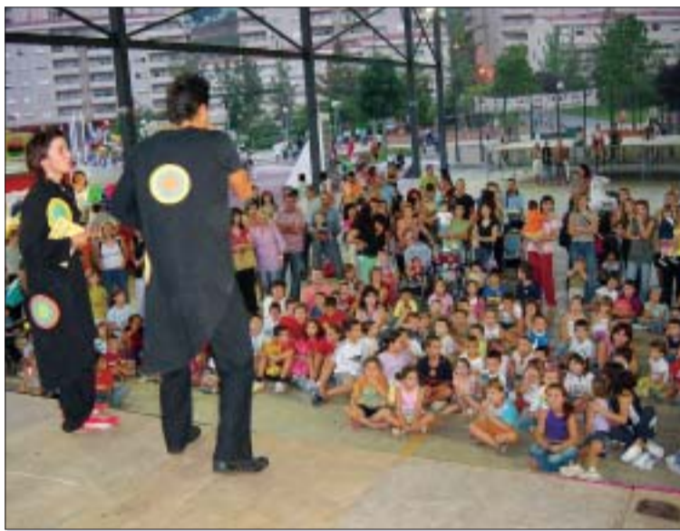
>> La companyia Pentina el gat va animar els més petits