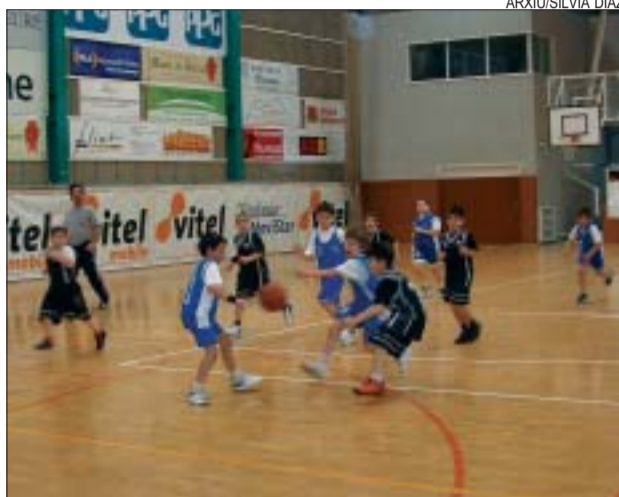
&gt;&gt; Promoció de bàsquet comença l'1 d'octubre

Bàsquet. Els equips de bàsquet de Promoció co-