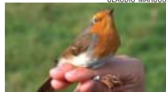
>> Anellatge d'ocells

El Servei de Medi Ambient ha reprès les activitats de natura aquest mes amb una trobada per contemplar el cel nocturn de Reixac el 23 de setembre i una observació d'aus rapinyaires i migratòries el 24. La jornada d'anellament científic que s'havia de fer el 17 de setembre s'ha traslladat al 2 d'octubre, coincidint amb el Dia Mundial dels Ocells. El taller és gratuït i les places limitades. Les persones interessades s'han d'adreçar al Servei de Medi Ambient (935 726 474). L'anellatge és una eina científica que permet conèixer de