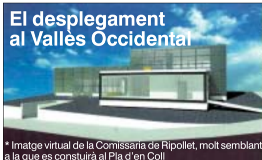
* Imatge virtual de la Comissaria de Ripollet, molt semblant a la que es construirà al Pla d'en Coll

característiques de la població, ja que la intenció del Govern és establir una relació estreta entre els cossos que operaran al país. La Comissaria de Districte de Montcada tindrà 1.050 m 2 , 138 m 2 d'aparcament interior i 525 m 2 d'aparcament exterior. El nombre d'agents que actuaran al municipi encara està per concretar, tot i que girarà al voltant de la cinquantena. El servei dependrà directament de l'Àrea Bàsica Policial que es farà a Cerdanyola, a l'igual que les comissaries de Ripollet i Barberà, mentre que la Unitat Central dels Mossos d'Esquadra estarà a Sabadell i aglutinarà el cos d'especialistes en investigació i explosius.