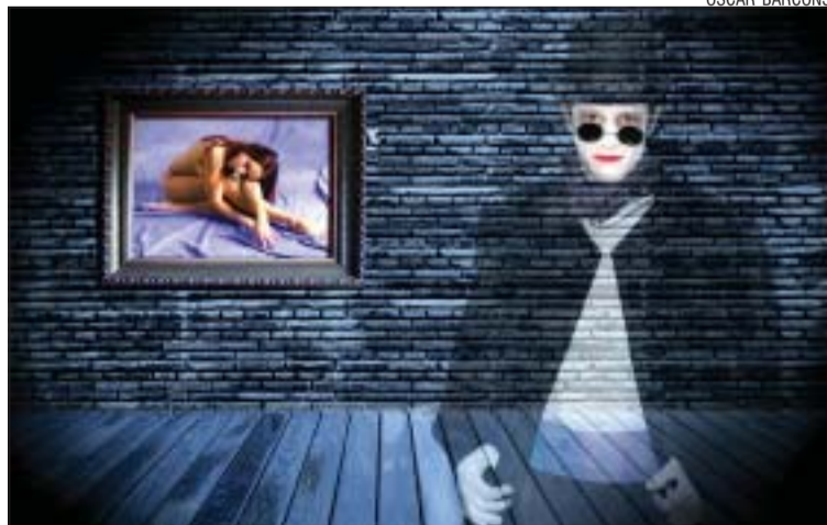
>> Una de les fotografies que es podran veure a la mostra