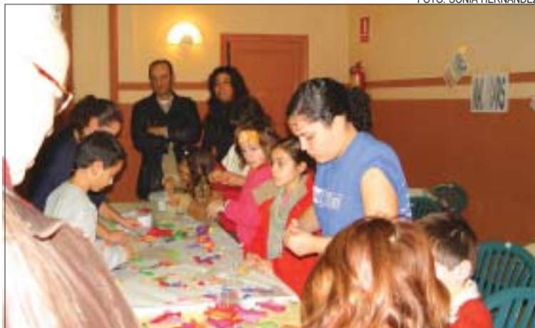
>> Els tallers de manualitats van atraure l'atenció de veïns de totes les edats