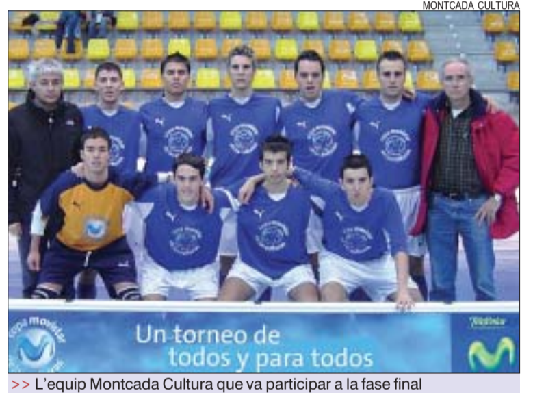
>> L'equip Montcada Cultura que va participar a la fase final