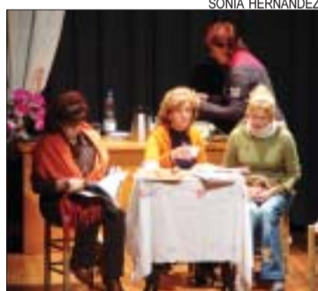
>> El Grup Sajuc, de Can Cuiàs