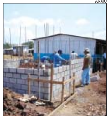
>> Obra d'una escola a Nahulingo