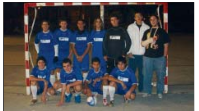
IES MONTSERRAT MIRÓ > Futbol juvenil