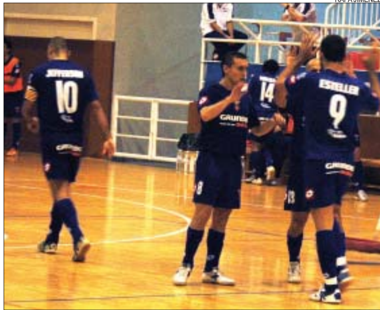
>> Els jugadors del Grundig celebren la golejada contra el Canet