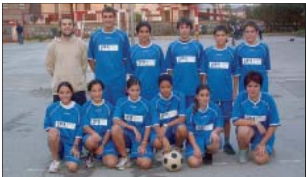
IES MONTSERRAT MIRÓ > Korfball infantil