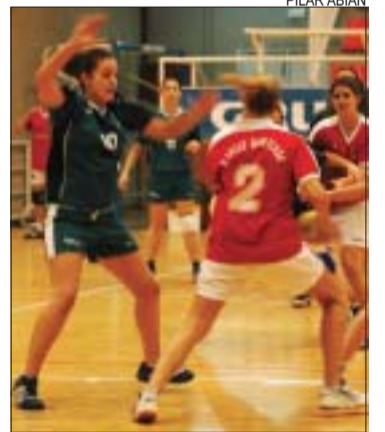
>> La Salle té 3 punts