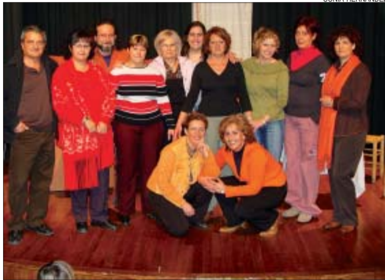
&gt;&gt; Integrants del grup abans de la representació del 25 de novembre