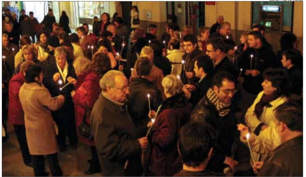
>> Els assistents a la concentració commemorativa van encendre espelmes en record de les víctimes

Després de la lectura del manifest, bona part del públic assistent es va traslladar a l'Auditori, que va acollir la representació de l'obra teatral Crònica de una idea , a càrrec del grup Sajuc, del Grup de Dones de Can Cuiàs, que va registrar un ple absolut. El preu de l'entrada, un euro, es va destinar al Grup El Safareig per la seva tasca d'atenció a les dones víctimes de la violència de gènere. El programa va cloure al Centre Cívic Can Cuiàs amb la projecció de la pel·lícula Nosotras , de Judith Colell, organitzada pel Grup de Dones de Can Cuiàs. D'altra banda, la comissió local d'EUiA va fer un comunicat felicitant i encoratjant tots els col·lectius de dones i homes compromesos en la lluita contra la violència de gènere. La formació afegia en el seu escrit que aquest fenomen s'ha d'eradicar des de la responsabilitat compartida.