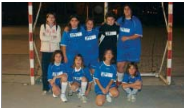
IES MONTSERRAT MIRÓ > Futbol infantil C

Les ganes de continuar practicant futbol sala i continuar amb la lliga escolar es fan paleses a l'IES Montserrat Miró, amb l'aparició de tres equips. L'infantil B, l'entrena Germán Faust.