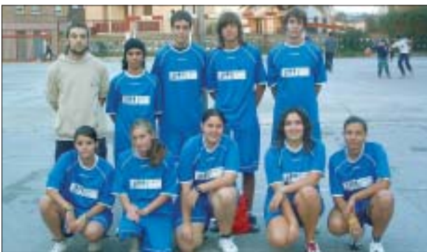
IES MONTSERRAT MIRÓ > Korfball júnior