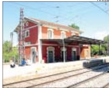
>> Estació de Mas Rampinyo

El Ministeri de Foment ha adjudicat la redacció d'estudis específics destinats a la duplicació del tram Montcada-Vic de la Línia de Puigcerdà, que passa per Mas Rampinyo. El pressupost de l'adjudicació és de més 650 mil euros i el termini per a la realització dels treballs és de 18 mesos. L'estudi té com a fi analitzar i desenvolupar alternatives de traçat per a la duplicació. L'execució de obres suprimirà els 26 passos a nivell que encara existeixen en un traçat de poc més de 50 quilòmetres. LR