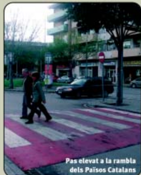
Pas elevat a la rambla dels Països Catalans