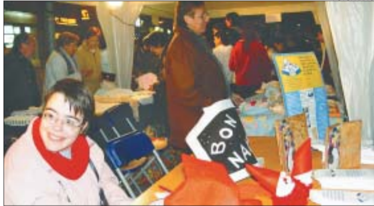
&gt;&gt; Les entitats són una part important de la Fira de Santa Llúcia

Una vintena de parades prendran part a la Fira de Santa Llúcia, el mercat de productes artesanals, típics i nadalencs imprescindibles perquè el Nadal sigui com ordena la tradició. Entre els participants hi haurà productes de jardineria, ceràmica, artesanania de fusta, de vidre, bijuteria, decoració nadalenca, joguines i menjars nadalencs, entre altres. La fira se celebrarà entre els dies 16 i 18 de desembre, a la Rambla dels Països Catalans de Montcada Nova, organitzada per les regidories de Comerç i Educació. Enguany, entre les parades també es trobaran altres