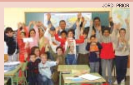
>> Alumnes del Mitja Costa

La delegació salvadorenca va visitar els CEIPs Turó, Mitja Costa i Elvira Cuiàs que mantenen correspondència amb escoles de Nahulingo. L'alcalde va fer entrega als alumnes de la darrera remesa de cartes i es va endur els missatges dels alumnes montcadencs. LR