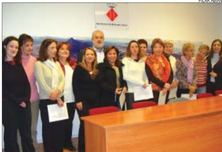
>> L'alcalde amb les participants al programa

Context. Els consultors van parlar de la necessitat de formació i de la forta competència que suposa l'economia submergida.