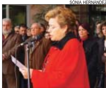
>> Manifest davant de l'Ajuntament