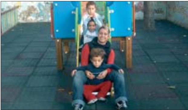
COL·LEGI LA SALLE > Psicomotricitat P-3