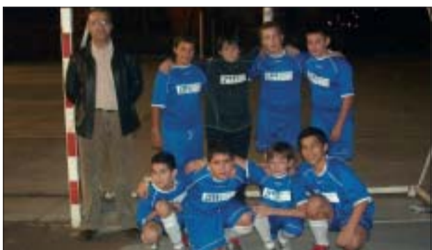
IES MONTSERRAT MIRÓ > Futbol infantil B