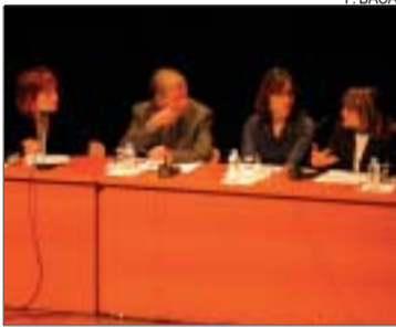
>> Imatge del debat