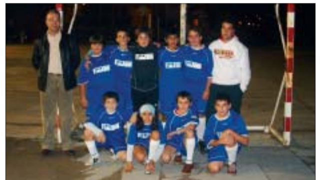
IES MONTSERRAT MIRÓ > Futbol infantil A

L'equip de multiesport B de La Salle està format per una majoria d'infants que l'any passat feia psicomotricitat i que aquest any contacta per primer cop amb la lliga. El monitor és Toni Aguilar.