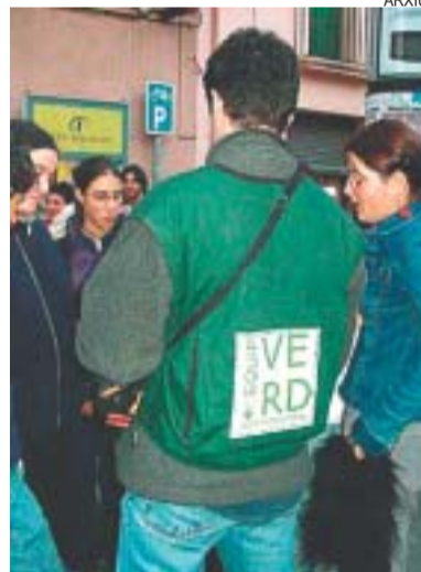
>> L'Equip Verd educa ambientalment

La brossa diària que es genera conté un 40% de matèria orgànica que pot ser reciclada i tornada a la terra en forma d'humus per a les plantes i els conreus. Els veïns que participin en la iniciativa hauran de fer un curs preparatori i acceptar visites de control a casa seva cada sis mesos. A la web www.compostadores.com podeu trobar tota mena d'informació sobre aquest estri. Els interessats a tenir-ne un a casa poden demanar-lo a l'Ajuntament. PA