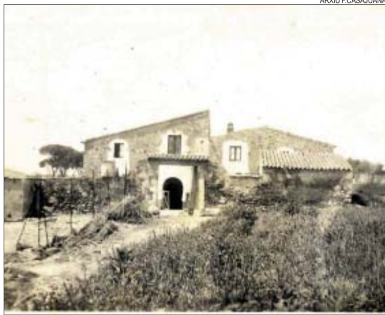
&gt;&gt; El mas Can Castells en una imatge dels anys quaranta

Ous i patates. Can Castells era un bell exponent de l'arquitectura del país i de la forma de viure dels nostres avantpassats. Fins a final dels anys 70