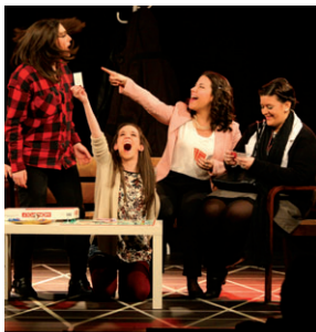
ARXIU PÈLAGA LADRIÈRE

Sis personatges amb trastorns obsessius es coneixen a la consulta d'un afamat psiquiatre. Aquest és el punt de partida de 'Toc', la comèdia que el Grup de Teatre La Salle Montcada va estrenar el passat desembre i que es podrà tornar a veure al teatre de La Unió el 29 de març (18h) i al de La Salle l'11 d'abril (22h) i el 19 d'abril (18h). Les entrades per a les dues funcions de La Salle es poden comprar a l'Oficina Alianz del passeig Rocamora o a la secretaria del col·legi | LG