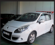
RENAULT SCENIC 1.9 DCI - 130 CV 6 velocidades - NAVEGAROR diciembre 2009 - 103.000 kms