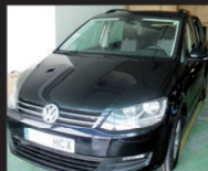
VOLKSWAGEN SHARAN 2.0TDI 140CV - AÑO 2011 - MUY EQUIPADA COMPLETAMENTE NUEVA - 7 PLAZAS

Concesionario multimarca de vehículos NUEVOS, SEMINUEVOS y DE OCASIÓN en PLA D'EN COLL MONTCADA I REIXAC (AL LADO DE LOS MOSSOS D'ESCUADRA) 616 313 142 • web: auto2000.coches.net