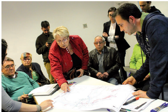
El taller participatiu, fet a la Casa de la Vila, va recollir propostes de diferents col·lectius i ciutadans, en total una trentena de persones