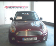
MINI CLUBMAN 1.6i 6 velocidades - 120 cv - año 2008 a4 ea cc - reg. velocidad