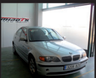
BMW 320i 170cv - IMPECABLE NACIONAL - PERFECTO ESTADO año 2002 - ECONÓMICO