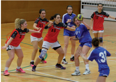
El senyor femení del CH La Salle va superar sense problemes l'EH Sant Joan Despí B (29-15)

El senyor femení del CH La Salle ha començat el seu camí cap a l'ascens a la Lliga Catalana. L'equip que dirigeix Pau Lleixà va finalitzar la primera fase a la segona posició del grup C de Primera Catalana amb un balanç de 12 victòries i dues derrotes. El 22 de març, el femení va començar amb bon peu la segona fase al grup A amb una contundent victòria contra l'EH Sant Joan Despí B (29-15). L'objectiu és acabar entre els dos millors classificats per disputar el Top-4 que determinarà quins són els tres equips que pujaran. "Ens plantejem els propers partits com si fossin una final. Els rivals seran complicats, sobretot com a locals, però volem estar entre els dos primers", explica el tècnic, qui