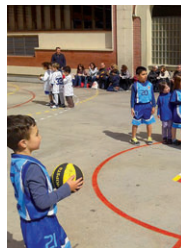
L'equip de l'Escola, a la trobada de bàsquet

19 al web del club www.submir.cat . D'altra banda, l'Escola del club va debutar el 22 de març a la trobada de bàsquet que es va fer a les instal·lacions de l'UE Claret de Barcelona i RJ