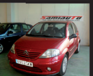
CITROEN C3 1.4i PREMIER Muy bien equipado ECONÓMICO