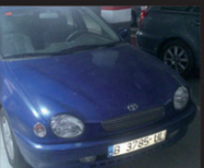
TOYOTA COROLLA - 1.6i 5P - LUNA 85.000 kms - PERFECTO ESTADO - MUY ECONOMICO