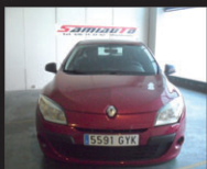
RENAULT MEGANE 1.5dci 90cv - 5p - año 2010 - PERFECTO NUEVA OPORTUNIDAD