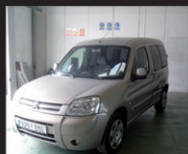
CITROEN BRLINGO 2.0 hdi sx plus doble puerta lateral - aa ee cc reg velocidad - Nov 2005