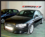
AUDI A4 S LINE nacional full equip año 2007 - 105.000 kms