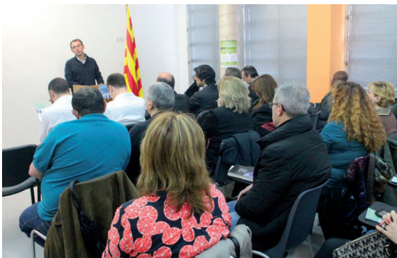
Paredes, durant la presentació del servei, davant dels representants d'empreses i emprenedors que hi van assistir

"Treballar l'ocupació sense tenir cura de les empreses no té