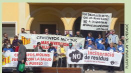
Fotografia de l'antincineració