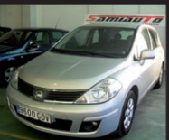
NISSAN TIIDA 1.6i AÑO 2008 - pocos kilometros MUY EQUIPADO