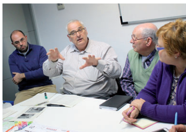
Les comissions de treball van abordar sobre els panells proposats per millorar la mobilitat

ser la millora dels recorreguts de les línies d'autobusos 96, 155 i 648 i l'eliminació de barreres arquitectòniques a les estacions de França, Montcada-Mañresa i Can Sant Joan. Les aportacions dels participants al taller seran