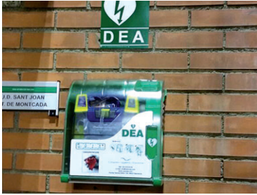
El camp de futbol de Can Sant Joan ja disposa d'un dels 15 desfibril·ladors que hi haurà a la ciutat