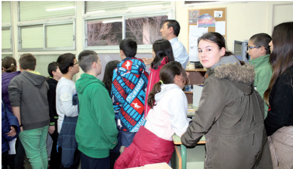
Alumnes de 6è de primària durant la visita a l'INS Montserrat Miró, on hi ha hagut 134 preinscripcions per a un total de 120 places ofertades

A P3, només 9 famílies no podran accedir a l'escola demandada en primera opció