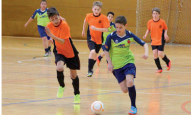
L'aleví B de l'FS Montcada es va veure superat clarament per l'FS Castellar a casa (2-8)

L'aleví B de l'FS Montcada és vuitè a la Divisió amb 25 punts –8 victòries, 1 empat i 9 derrotes. L'equip de Víctor Rojano està format per una majoria de jugadors de primer any i ha perdut els últims partits contra el CET 10 B (5-1) i el Castellar (2-8). "El nostre porter ha marxat i el nou encara s'està adaptant. L'objectiu era mantenir-nos a la categoria i si continuem lluitant, no tindrem problemes", diu Rojano i RJ