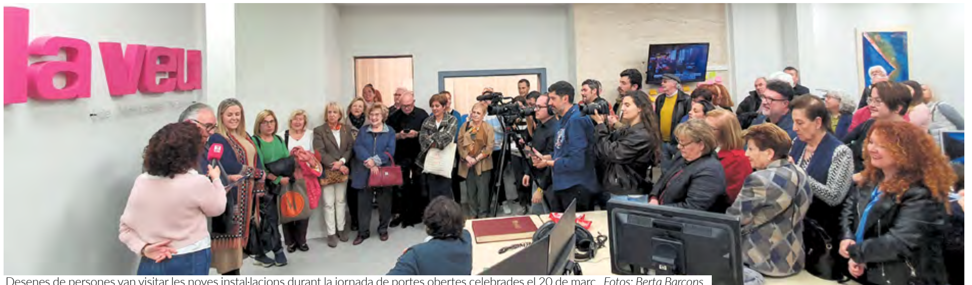
Desenes de persones van visitar les noves instal·lacions durant la jornada de portes obertes celebrades el 20 de març.

Els mitjans tornen a estar a peu de carrer, deixant enrere el soterrani de l'Ajuntament