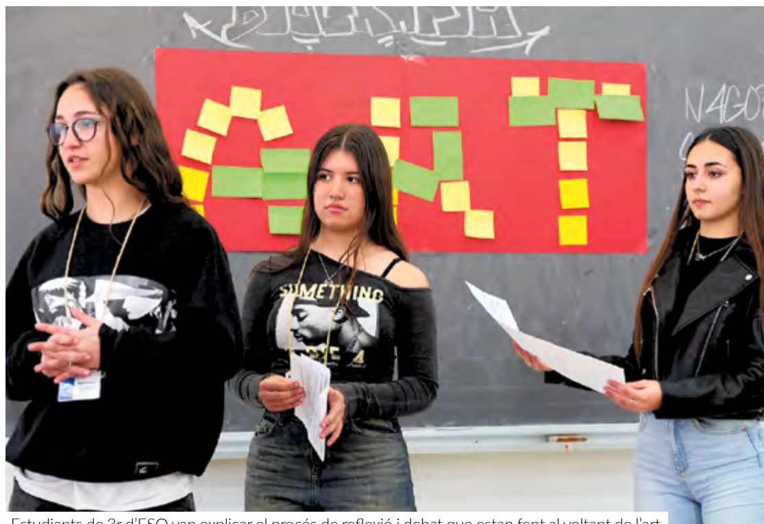
Estudiants de 3r d'ESO van explicar el procés de reflexió i debat que estan fent al voltant de l'art