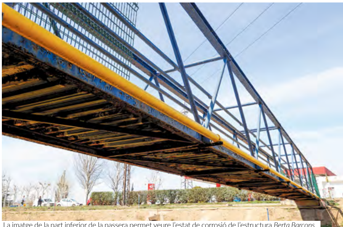
La imatge de la part inferior de la passera permet veure l'estat de corrosió de l'estructura