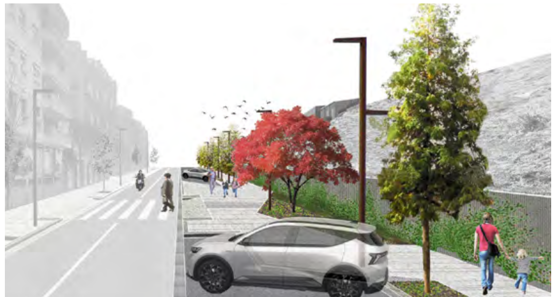
Imatge virtual del projecte on s'aprecia l'amplada de la nova vorera i els llocs d'aparcament Ajuntament

“No es tracta només d'una ampliació de la vorera, sinó de transformar el carrer