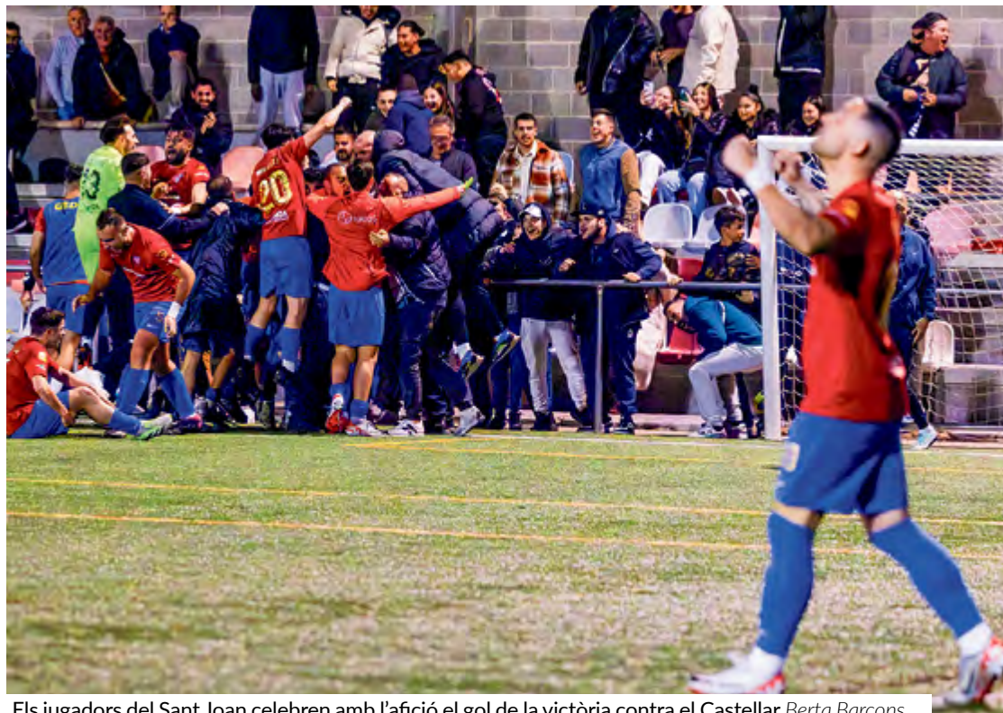
Els jugadors del Sant Joan celebren amb l'afició el gol de la victòria contra el Castellar Berta Barcons

'L'equip ha de continuar perseguint microobjectius i esperar els resultats partit a partit'