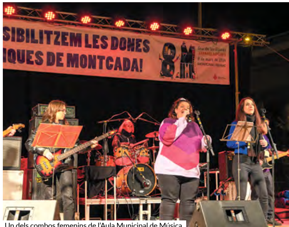
Un dels combos femenins de l'Aula Municipal de Música