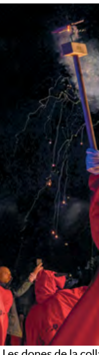
Les dones de la colla