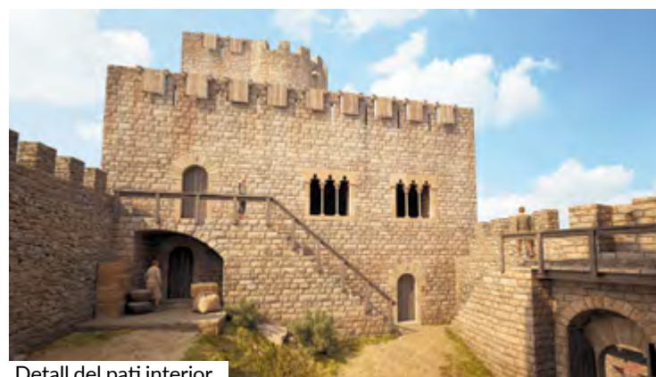
Detall del pati interior