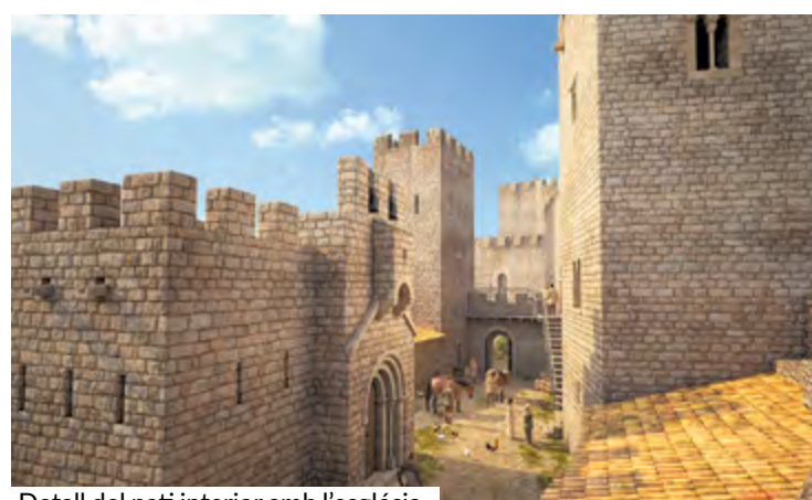
Detall del pati interior amb l'església