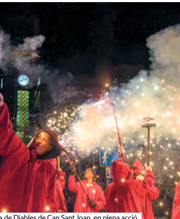
a de Diables de Can Sant Joan, en plena acció