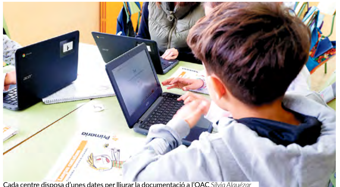
Cada centre disposa d'unes dates per lliurar la documentació a l'OAC Sílvia Alquezar

Les sol·licituds es podran presentar del 22 d'abril al 31 de maig