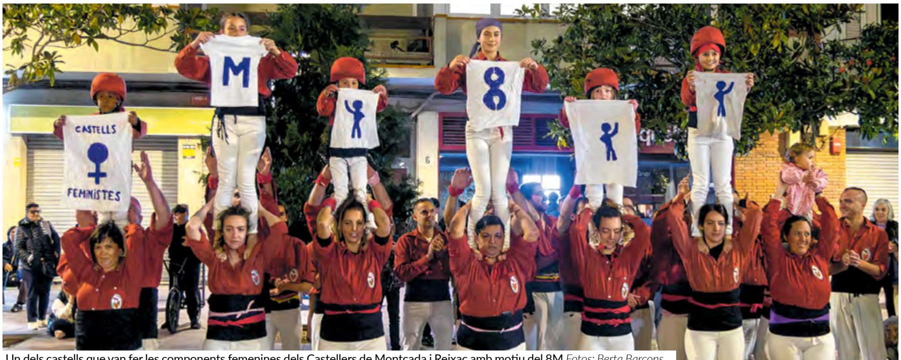
Un dels castells que van fer les components femenines dels Castellers de Montcada i Reixac amb motiu del 8M