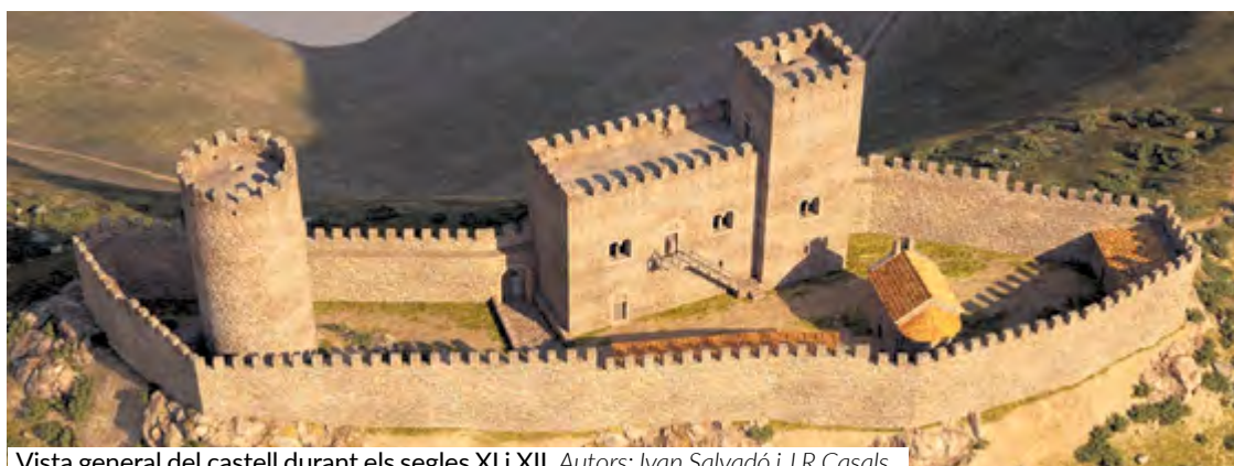
Vista general del castell durant els segles XI i XII Autors: Ivan Salvadó i J.R Casals

digital”. La revista, al preu de 15 euros, es pot adquirir a l'Auditori Municipal. Membres dels Amics del Museu van amenitzar l'acte amb recreacions teatrals de la història del castell.