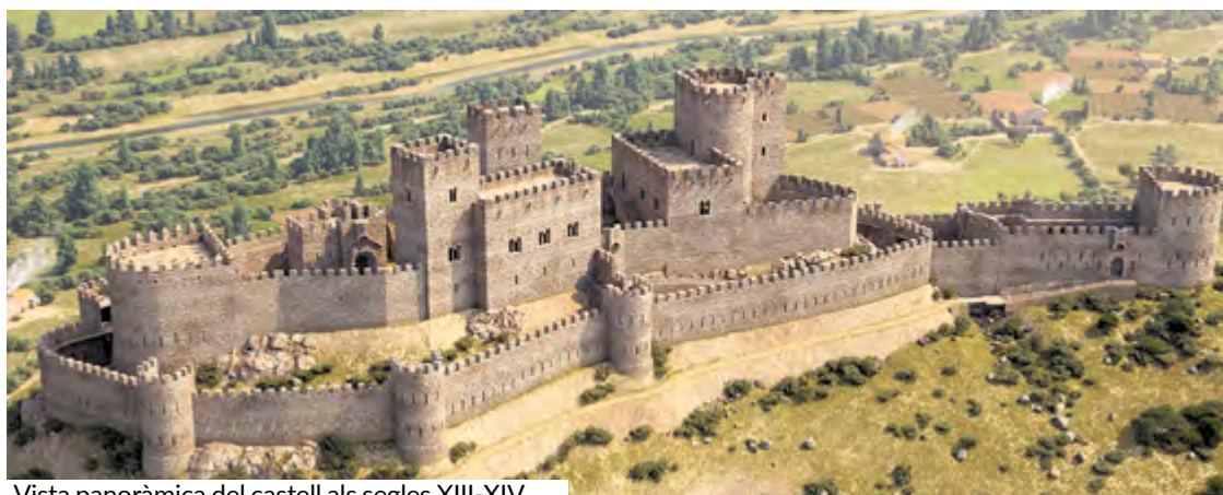
Vista panoràmica del castell als segles XIII-XIV