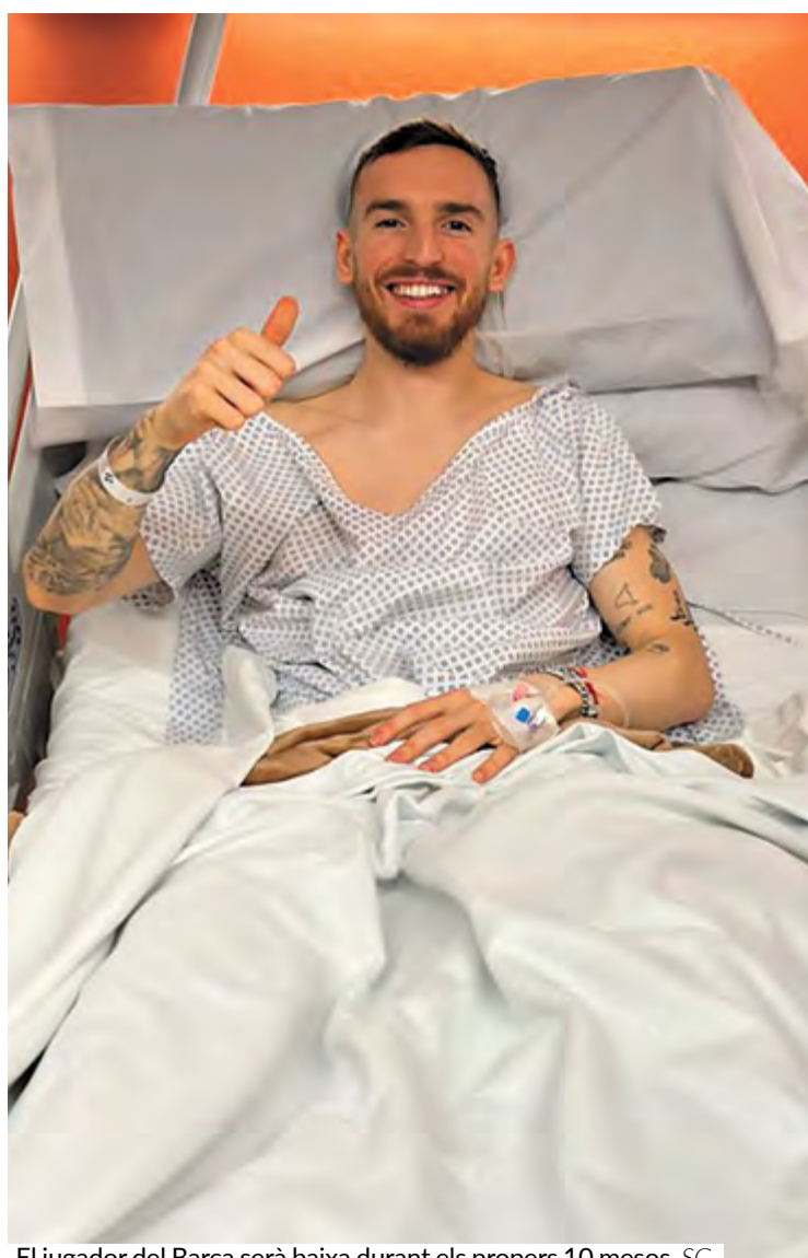
El jugador del Barça serà baixa durant els propers 10 mesos SG