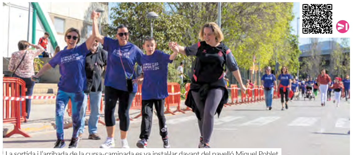
La sortida i l'arribada de la cursa-caminada es va instal·lar davant del pavelló Miquel Poblet