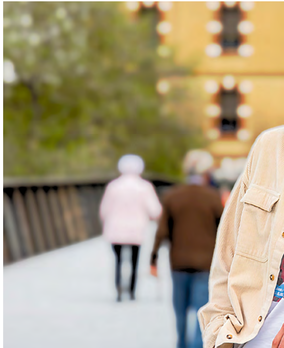
Nil va estudiar al Fedac i a La Salle i va fer el grau en Biomedicina a la UAB. Tot i que fa cinc anys que viu fora, r

Exacte, disposar d’aquesta informació ens permet fer fàrmacs que vagin directament a resoldre problemàtiques concretes i que siguin més efectius i adequats per segons quins perfils genètics. Des que es van començar a fer mapes 3D, a escala atòmica, que permeten veure com els fàrmacs interaccionen amb la seva diana terapèutica, la Bioinformàtica ha agafat molt de pes. Analitzar aquestes interaccions ha donat peu a desenvolupar fàrmacs més potents.