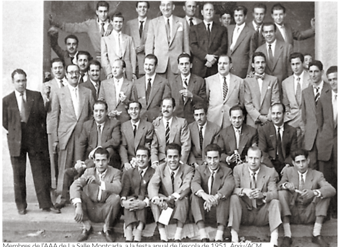
Membres de l'AAA de La Salle Montcada, a la festa anual de l'escola de 1951.