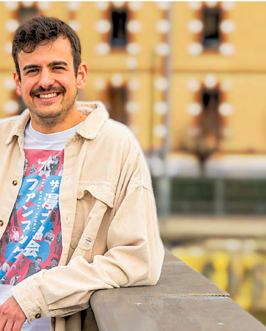
reconeix que se sent molt lligat al municipi per la família, els amics i l'activitat cultural

Òbviament, la família i els amics. Els últims cinc anys he viscut a Barcelona, però vinc sovint a casa, a la Font Puudenta. Per a mi, el que connecta Barcelona i Montcada és la cultura i és precisament això el que més trobo a faltar quan soc a l'estranger. Encara que sembli banal, m'encanten les festes del poble i un esdeveniment que intento no perdre'm mai és el correbars d'inici de la Festa Major.