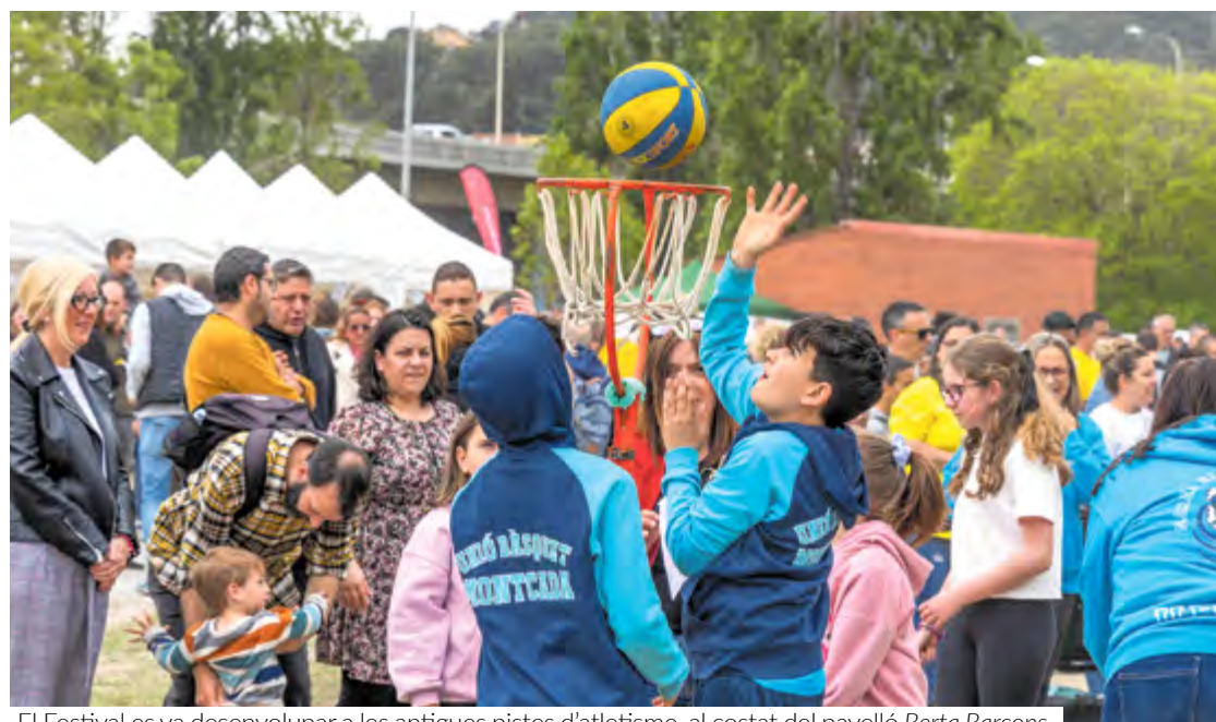
El Festival es va desenvolupar a les antigues pistes d'atletisme, al costat del pavelló Berta Barcons

Va ser precisament la Federació la que va organitzar la primera edició del Festival l'any passat; enguany l'entitat ha comptat amb el suport de l'Ajuntament com a organitzador. Diversos departaments municipals com la