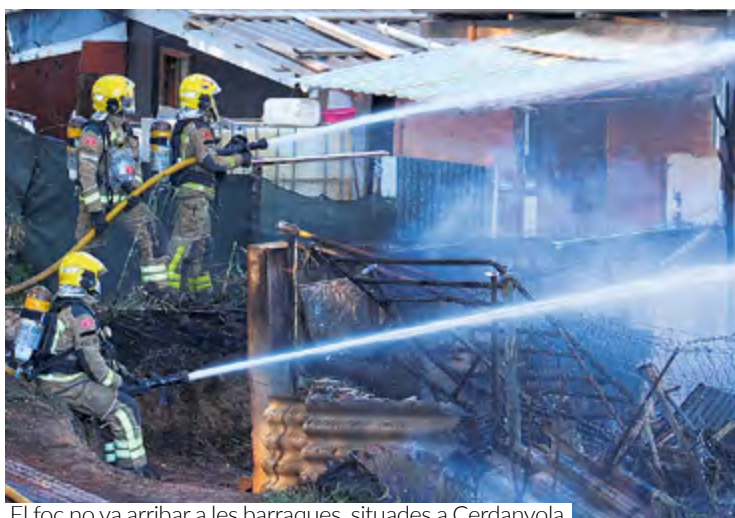
El foc no va arribar a les barraques, situades a Cerdanyola