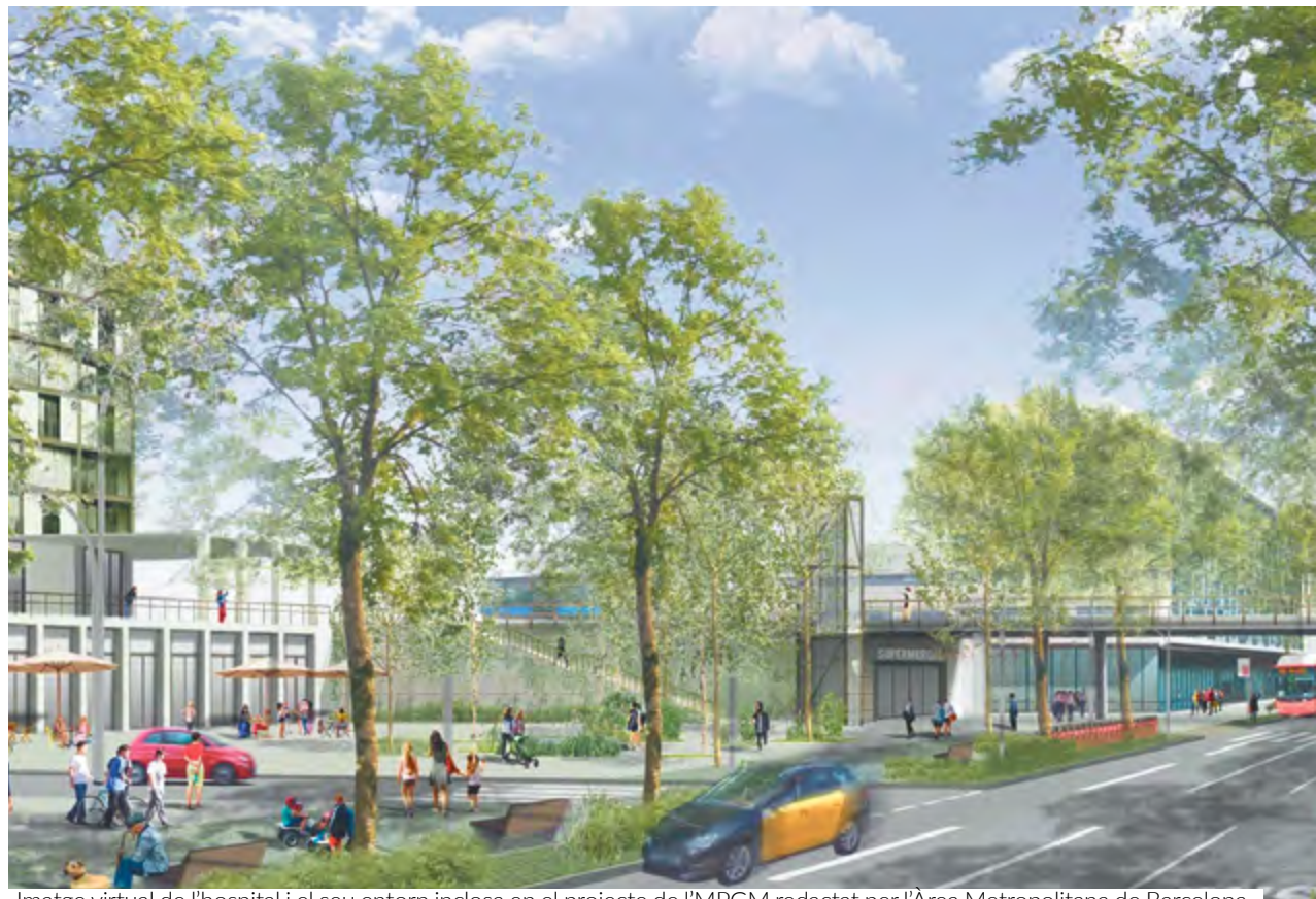
Imatge virtual de l'hospital i el seu entorn inclosa en el projecte de l'MPGM redactat per l'Àrea Metropolitana de Barcelona

nistes”, davant la proximitat de les eleccions, i que el nucli residencial que envoltarà l'hospital no serà cap “bolet”. “No es tractarà de cap barri dormitori, tindrà tots els serveis que necessiti des del punt de vista assistencial i d'escolarització”, ha assegurat