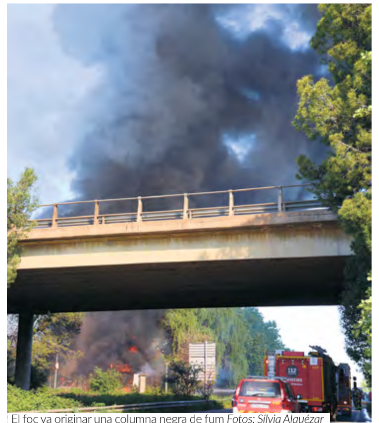
El foc va originar una columna negra de fum