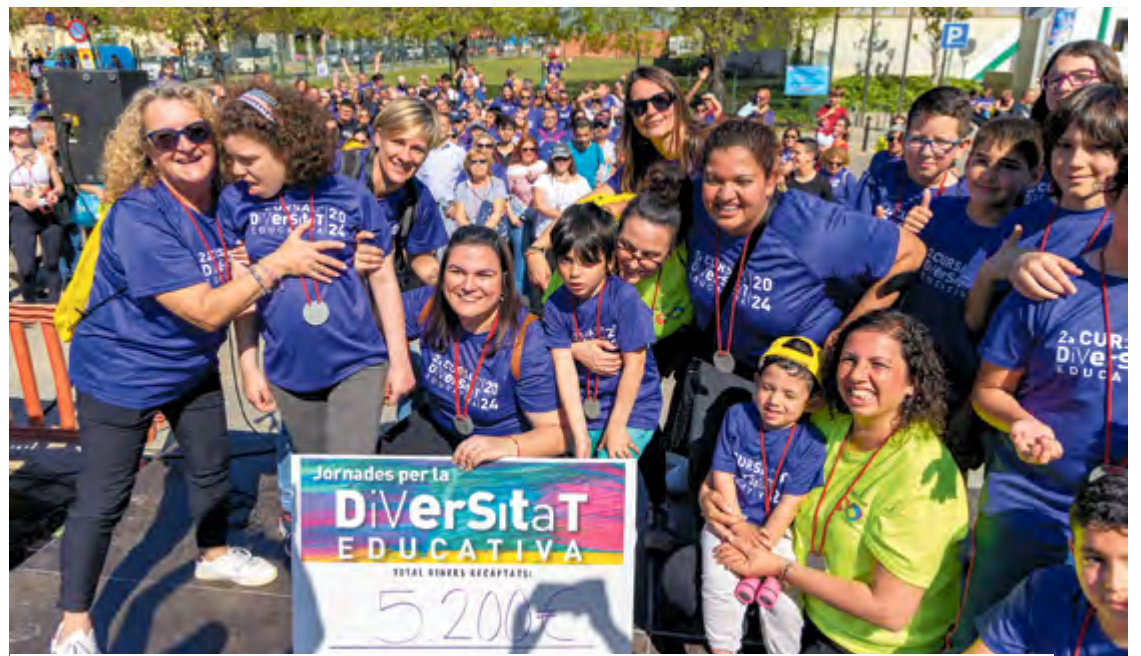
Representants de Suma't Mir amb el xec de 5.200 euros recollits en la segona edició