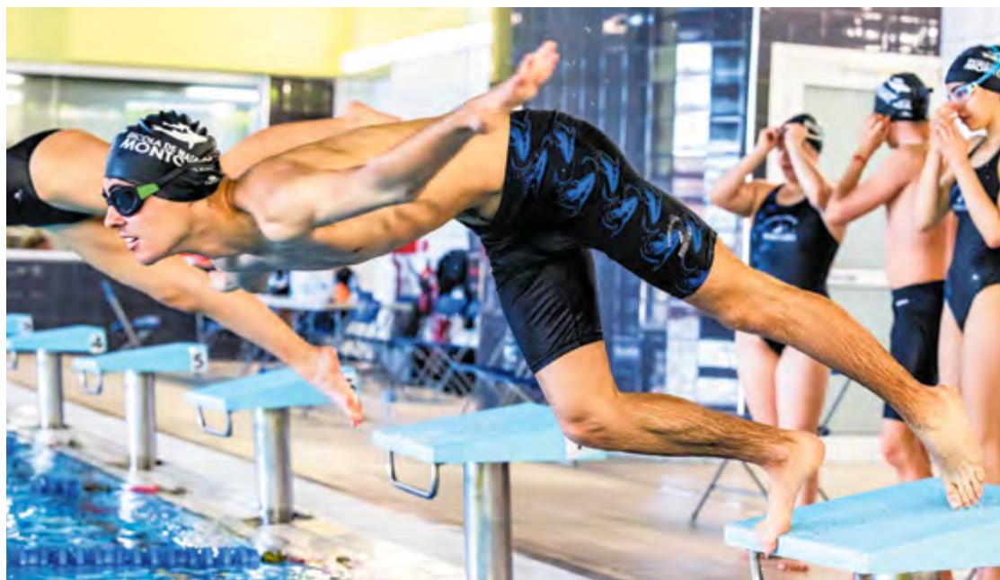
Montcada Aqua va ser l'escenari de la 4a jornada del Campionat Comarcal de natació