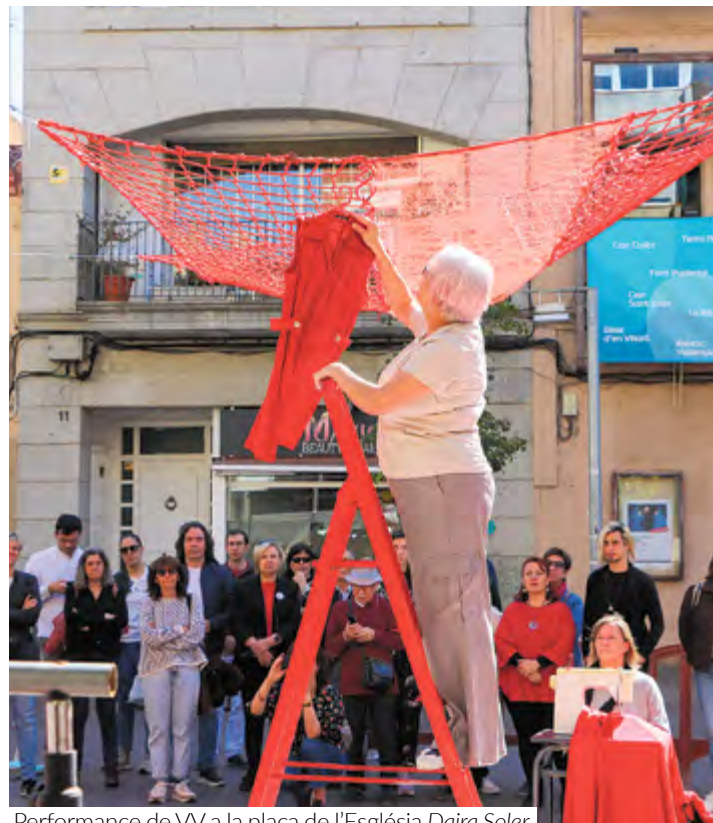
Performance de VV a la plaça de l'Església