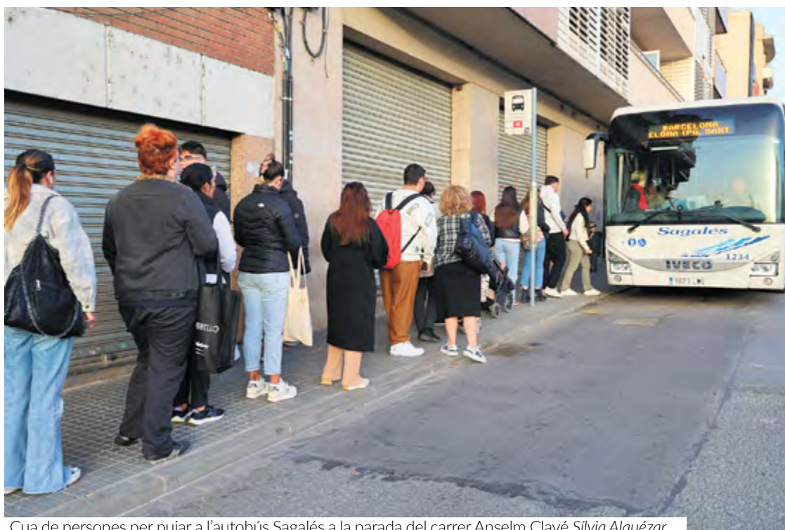
Cua de persones per pujar a l'autobús Sagalés a la parada del carrer Anselm Clavé. Sílvia Alquézar