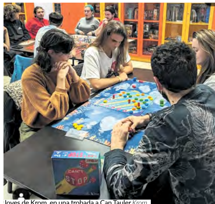
Joves de Krom, en una trobada a Can Tauler Krom

És preferible que les persones que vagin al festival s'inscriguin prèviament a través del web que Krom ha creat per a l'ocasió i que difondrà pel seu canal d'Instagram @Krom_mir, tot i que no és obligatori. També hi haurà la possibilitat d'inscriure's el mateix dia de l'esdeveniment.