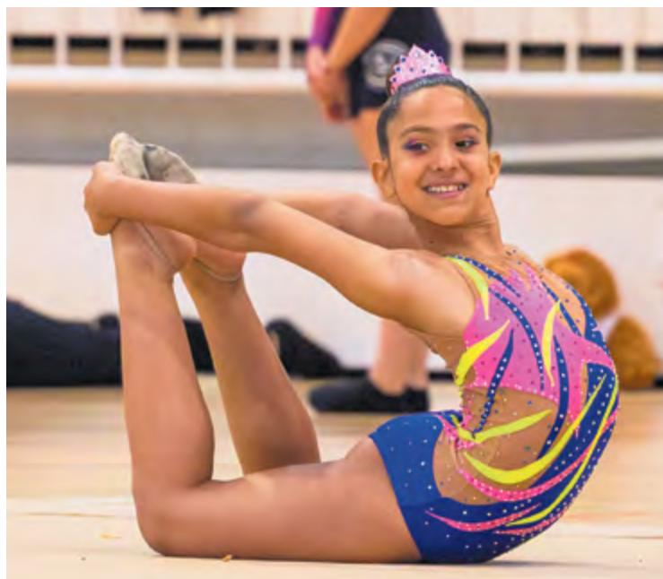
El campionat de gimnàstica rítmica es va fer al pavelló Miquel Poblet

Els dies 20 i 21 d'abril, el municipi va acollir competicions de corfbol, gimnàstica i natació