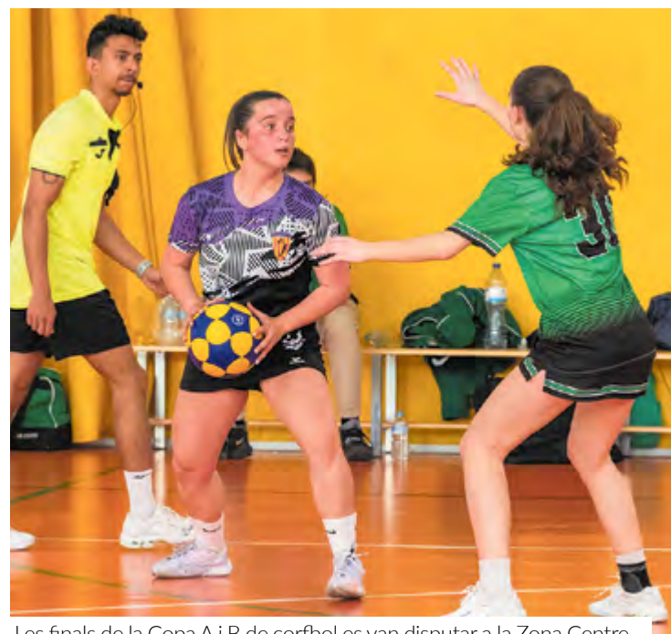
Les finals de la Copa A i B de corfbol es van disputar a la Zona Centre

Diumenge, l'esport protagonista va ser la gimnàstica rítmica amb la segona jornada del campionat comarcal, també organitzat pel CEVOS. Hi van participar els tres clubs montcadencs –La Unió, Mediterrània i Atlàntic–, que van aconseguir 20 medalles individuals i tres per equips. La competició va tenir lloc al pavelló Miquel Poblet.